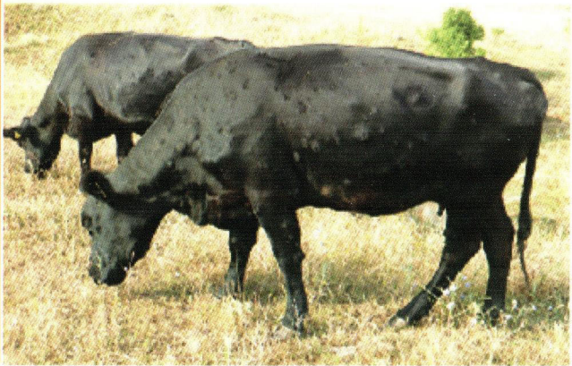
គោឆ្លងជំងឺធ្ងន់ធ្ងរ ដែលឡើងដំបៅស្បែកច្រើនកន្លែង