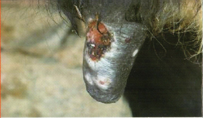
ជំងឺរលាកនៅចុងដោះ