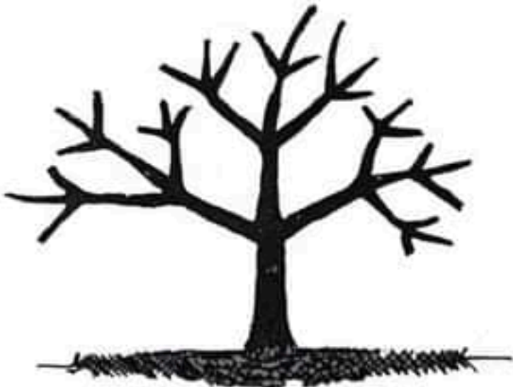
កាត់តែងមែកតាមប្រព័ន្ធ ១-៣-៦-១៨