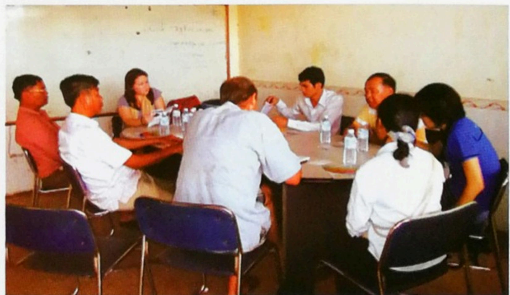
សកម្មភាពសហគមន៍ជួបជាមួយអ្នកបញ្ជាទិញម្រេច

មន្ត្រីជំនាញ និងជួលអ្នកបច្ចេកទេសបើកវគ្គបណ្តុះបណ្តាលបច្ចេកទេសដាំដុះ និងថែទាំម្រេច ដល់សមាជិកស្នើសុំជំនួយពីដៃគូអភិវឌ្ឍន៍ និងលើកគម្រោងផែនការថវិកាដោយខ្លួនឯងបង្កើនមុខរបរបន្ថែមទៀត ស្នើសុំមន្ត្រីជំនាញ និងដៃគូអភិវឌ្ឍន៍ពាក់ព័ន្ធជួយផ្តល់ បច្ចេកទេសកសិកម្មបន្សំទៅនឹងការប្រែប្រួលអាកាសធាតុ។