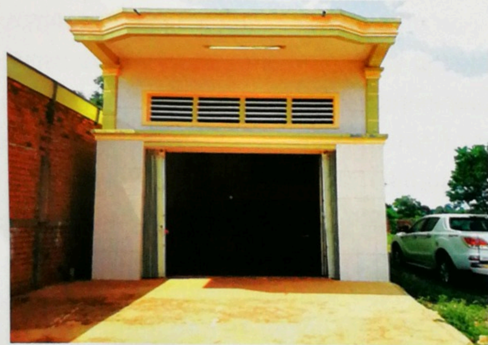
ទ្រព្យសម្បត្តិសហគមន៍កសិកម្មដំណាំម្រេច ដារមេមត់