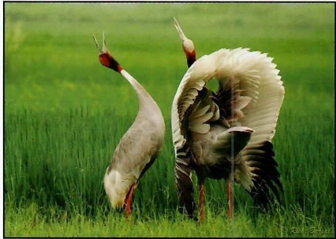
សម្រែកច្រៀងត្រសងក្នុងពេលចែចង់គ្នានៃដៃគូ សត្វក្រៀល ដែលញីតែងតែក្ដោបស្លាបនៅនឹងខ្លួនរបស់វា

ការចែចង់គ្នាគឺចាប់ផ្ដើមពីអាណ្ណាល និងបន្តដោយ មីញី ទោះបីជាមីញីមិនសូវសកម្មក៏ដោយ។ អាណ្ណាលចាប់ ផ្ដើមដោយត្រដាងស្លាបបើក រួចបង្ហោនខ្លួនបន្តិច បន្ទាប់ មកលោតផ្លោះ ចែមទាំងផ្ទៀងផ្ទាត់ខ្លួនចុះឡើងៗ រួចងើប ក្បាលឡើងមុននឹងស្រែកកងវំពង។ បន្ទាប់មកមីញីក៏ចូល រួមកាយវិការទាំងនេះ ដោយយើងឃើញក្រៀលញីឈ្មោល ចែចង់គ្នាដោយលោតចុះឡើងដាក់គ្នាទៅវិញទៅមក។ ការ ចែចង់គ្នានេះមានភាពរស់រវើក និងពិសេសអស្ចារ្យណាស់ ដោយមានសម្រែកច្រៀងត្រសងគ្នាក្នុងពេលដំណាលគ្នា នោះ។