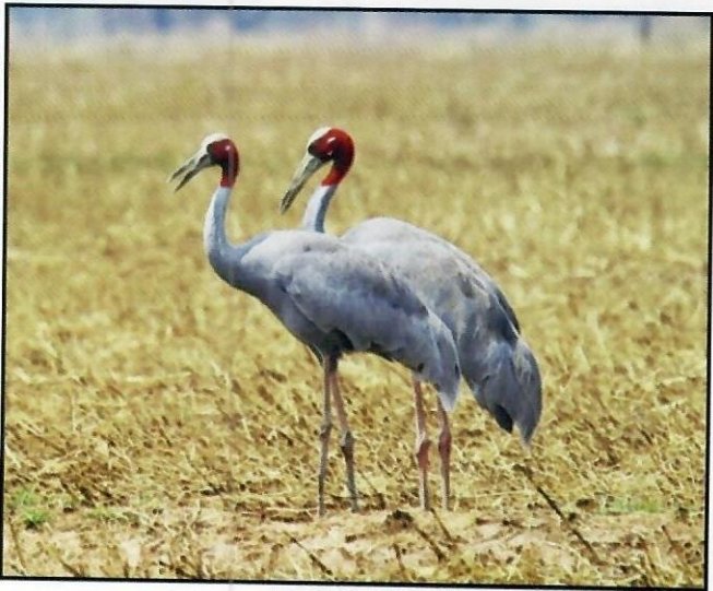
សត្វក្រៀលញីឈ្មោលដែលជាដៃគូបន្តពូជ បំបែកខ្លួនចេញពីហ្វូងរបស់វានៅតំបន់អាងត្រពាំងថ្ម

នៅរដូវពងកូន សត្វក្រៀលញីឈ្មោលដែលជាដៃគូបន្តពូជនឹងបំបែកខ្លួនចេញពីហ្វូងរបស់វា ហើយស្វែងរកទីតាំងសមរម្យដើម្បីធ្វើសំបុក។ នៅក្នុងប្រទេសកម្ពុជា ទីតាំងដែលពួកវាធ្វើសំបុកគឺជាតំបន់ព្រៃឈ្មោះដែលសំបូរដោយតំបន់ដីសើមតូចៗ (ត្រពាំង ឬថ្នកទឹកផ្សេងៗ)។