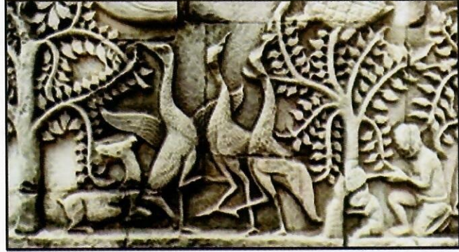
រូបចម្លាក់សត្វក្រៀលដែលត្រូវបានធ្លាក់ជាប់នឹងផ្ទាំងថ្ម នៃប្រាសាទបាយ័ន នៅខេត្តសៀមរាប

សត្វក្រៀលមានវត្តមាននៅក្នុងប្រទេសកម្ពុជាតាំងពី យូរលង់ណាស់មកហើយគិតចាប់ពីសម័យអង្គរ នាសតវត្ស ទី៩ ដល់ សតវត្សទី១៥។ បើសិនយើងបានទស្សនាប្រាសាទ បាយ័ននៅខេត្តសៀមរាប យើងនឹងឃើញរូបចម្លាក់សត្វ ក្រៀលដែលត្រូវបានធ្លាក់ជាប់នឹងផ្ទាំងថ្ម។ ប្រជាជនមូលដ្ឋាន ធ្លាប់មានជំនឿថានៅពេលដែលមានសត្វក្រៀលមួយគូហើរ រំលងដំបូលផ្ទះនរណាម្នាក់ នោះនឹងមានគុស្នេហ៍វ័យក្មេង នៃគ្រួសារនោះពង្រត់គ្នាពុំខាន។ ប៉ុន្តែសព្វថ្ងៃនេះ ប្រជាជន ឈប់ជឿអបិយជំនឿនោះទៀតហើយ។