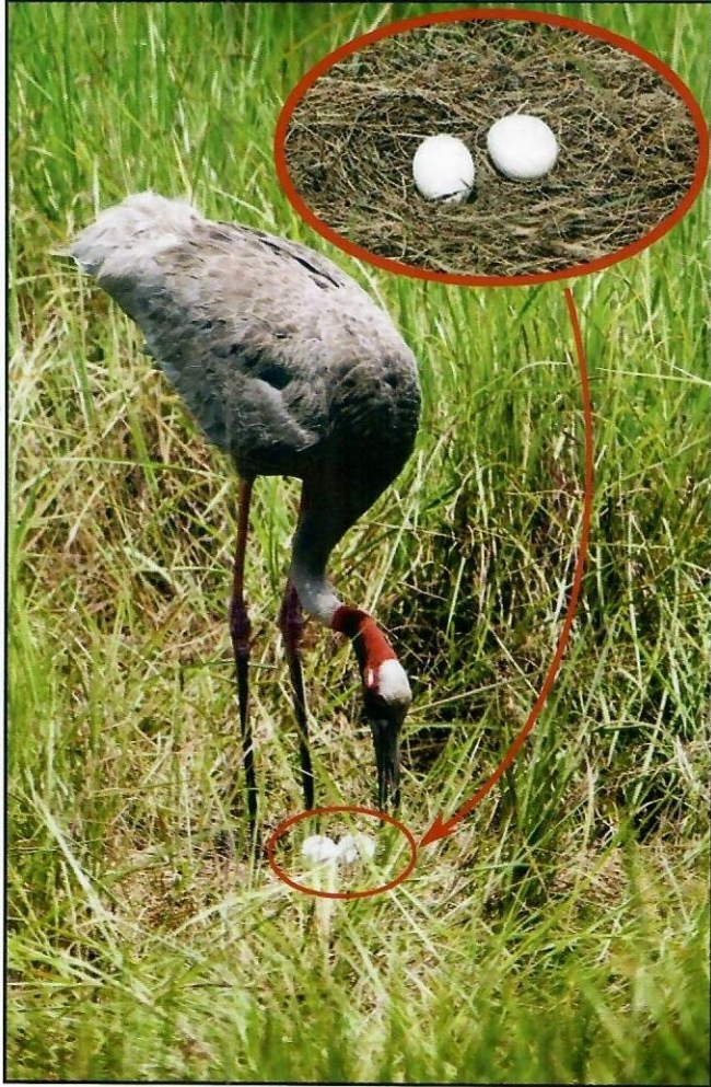
សត្វក្រៀល និងសំបុកពងរបស់វា

នៅក្នុងព្រៃនោះ។ ក្រៀលញីឈ្មោលទាំងពីររួមគ្នាធ្វើសំបុក ដែលសំបុកនោះធ្វើពីចំបើង និងស្មៅត្រែងជាដើម។ សំបុក ទាំងនោះមានអង្កត់ផ្ចិតរហូតដល់២ម៉ែត្រ និងកម្ពស់រហូត ដល់១ម៉ែត្រ ចំណែកឯស៊ុតក្រៀលគឺស្រាលអាចអណ្តែត លើផ្ទៃទឹកបាន។