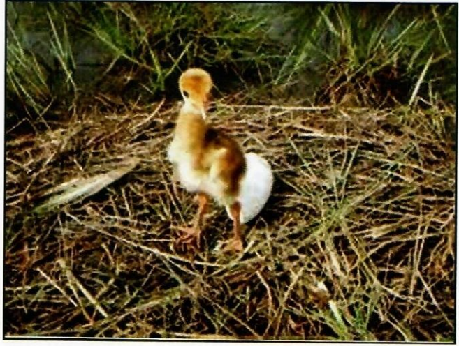
កូនសត្វក្រៀល

កូនតូចដែលទើបនឹងញាស់គឺជាបំផុតណាស់បើ ធៀបនឹងសត្វស្លាបផ្សេងទៀត។ ពួកវាបើកភ្នែកភ្លាមៗ បន្ទាប់ពីញាស់ ហើយអាចដើរបាននៅពេលដែលឈាមរបស់ វាស្ងួតភ្លាមៗនោះ។ កូនតូចអាចរត់កាត់ទឹកភ្នែកបានយ៉ាង លឿន ហើយដើរតាមមេរបស់វា។ នៅពេលដែលកូនក្រៀល មានអាយុ ៣ ឬ ៤ខែ វានឹងមានដុះស្លាបសម្រាប់ហោះ ហើរបានហើយ។