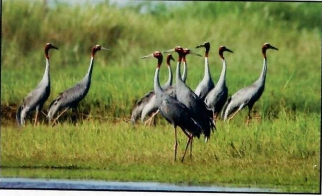
សត្វក្រៀលដែលរកចំណីជាហ្វូងក្នុងរដូវកាលមិនបន្តពូជ