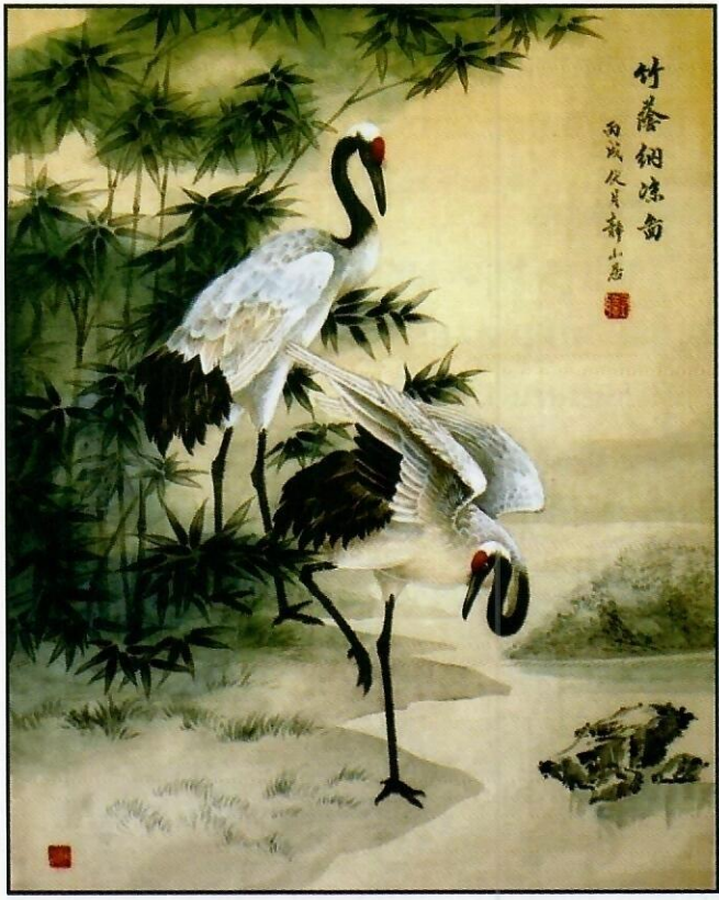
រូបគំនូរសត្វក្រៀលចិន ត្រូវបានប្រើជានិមិត្តរូបហុងស៊ុយ ដើម្បីនាំមកពលនៃជីវិតដ៏ថ្លៃថ្នូរ និងសន្តិភាព និង នាំប្រលឹងមនុស្សទៅកាន់ឋានសួគ៌

សត្វក្រៀលគឺជានិមិត្តរូបនៃជោគវាសនាល្អ និងអាយុ យឺនយូរ។ ពួកវាក៏ត្រូវបានគេគិតថាជានិមិត្តរូបនៃមនោ សញ្ជេតនាស្នេហាស្ម័គ្រស្មោះ ដោយយោងទៅតាមការ ភ្ជាប់ចំណងមេត្រីភាពរបស់ពួកវា។ តាំងពីបុរាណកាល រហូតដល់បច្ចុប្បន្ន ប្រជាជននៅទ្វីបអាស៊ី មានចិន កូរ៉េ ជប៉ុន វៀតណាម និងខ្មែរ មានជំនឿថា សត្វក្រៀល ជា និមិត្តរូបនាំមកនូវសេចក្តីសុខដុមរមនា ត្រជាក់ត្រជុំ អាយុ យឺនយូរដល់មនុស្ស ហេតុដូច្នោះហើយបានជាគេនិយមជូន អំណោយដល់គ្នាទៅវិញទៅមកនូវរូបសត្វក្រៀលដ៏ស្រស់ស្អាត សម្រាប់ដាក់តាំងនៅតាមគេហដ្ឋាន។ នៅក្នុងប្រទេសភូមា សត្វក្រៀល ត្រូវបានគេឃើញមានក្នុងពុទ្ធសាសនា។