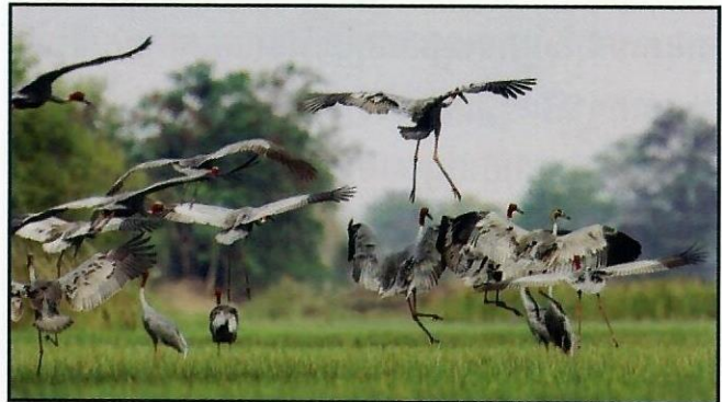
ហ្វូងសត្វក្រៀល