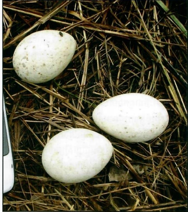
ពងសត្វក្រៀល

ជាទូទៅ សត្វក្រៀលផ្តល់កំណើតដោយមានស៊ុត ចំនួន ០២គ្រាប់ តែនៅពេលខ្លះមានស៊ុតចំនួន០៣គ្រាប់ ហើយកម្រនឹងមានស៊ុត០៤គ្រាប់ណាស់។ ក្រៀលញីឈ្មោល ទាំងពីរក្រាបពង ទោះបីជាភាគច្រើនមីញីមានតួនាទីក្រាប ពង រីឯអាណ្តោលមានតួនាទីការពារសំបុកពីការយាមី របស់សត្រូវ។ ស៊ុតត្រូវបានញាស់ក្នុងអំឡុងពេលពី ៣០ ទៅ ៣៤ ថ្ងៃ រហូតដល់ពេលវាញាស់។