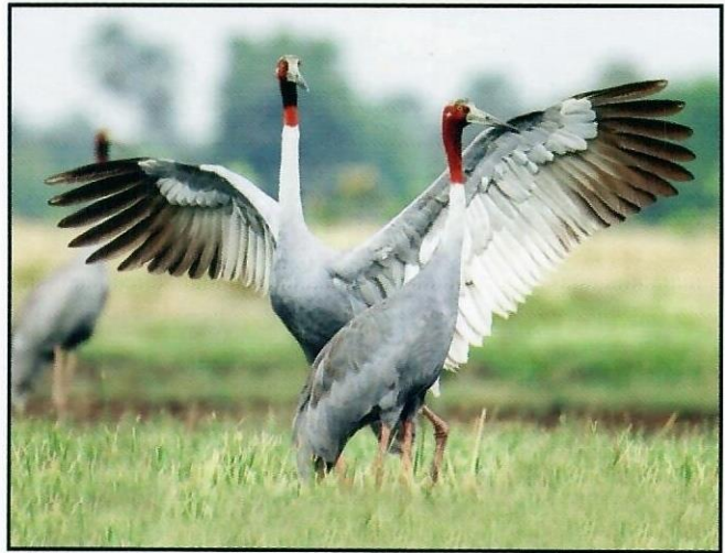
សត្វក្រៀលញីឈ្មោល

សត្វក្រៀលគឺជាសត្វស្លាបដែលមានកម្ពស់ខ្ពស់ជាងគេលើពិភពលោក ហើយអាចហើរបាន។ ជាទូទៅ សត្វក្រៀលមានកម្ពស់ប្រហែល ១,៧៦ ម៉ែត្រ មានទម្ងន់ពី ៥-១២គីឡូក្រាម និងប្រវែងស្លាបទាំងសងខាង ២,៥ ម៉ែត្រ។ ពួកវាមានម្រាមជើងមុខវែងៗចំនួនបី និងម្រាមជើងក្រោយខ្លីមួយ។ ពួកវាមិនអាចទំនោលើដើមឈើបានទេ ហើយដេកដោយឈរស្ងៀមផ្ទឹងនៅទីតាំងជិតៗកន្លែងរកចំណីរបស់វានៃតំបន់ដីសើម។ សត្វក្រៀលមានសម្បុរប្រទេសលើដងខ្លួន កន្លែងខាងលើនិងក្បាលមានពណ៌ក្រហមក្បាលផ្នែកខាងលើបំផុត និងត្រចៀក មានពណ៌ប្រផេះស្រាល។ កូនក្រៀលមានមាត់តូចបន្តិច និងមានពណ៌ត្នោតនៅចំក្បាលរបស់វា។ គេពិបាកសម្គាល់ថា សត្វក្រៀលណាជាឈ្មោលឬញី នៅពេលដែលពួកវានៅជាគូ ប៉ុន្តែមីញីមានមាត់តូចជាងអាឈ្មោលបន្តិច។ សត្វក្រៀលត្រូវបានចាត់ជាប្រភេទសត្វងាយរងគ្រោះនៅក្នុងបញ្ជី ក្រហម IUCN។