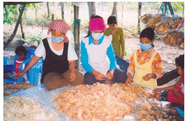
ការច្រកចេកឆាបទៅក្នុងស្បោង