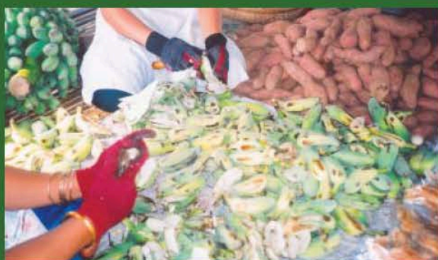
សកម្មភាពបកសំបកចេកដោយដៃ