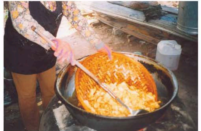
ការស្រងបន្ទះចេកឆាបចេញពីក្នុងខ្ទះប្រេងសណ្តែក