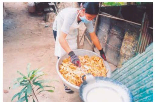
ការក្រឡុកស្ករស ជាមួយបន្ទះចេកឆាប