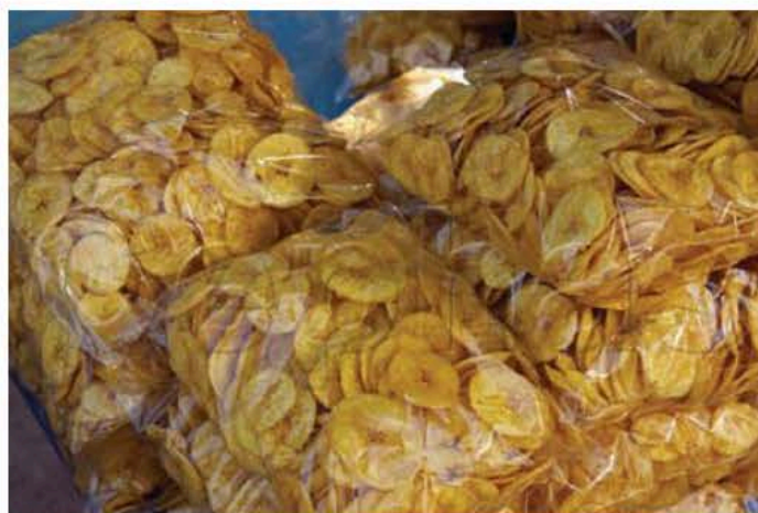
ផលិតផលចេកឆាប់បានដាក់នៅទីផ្សារ