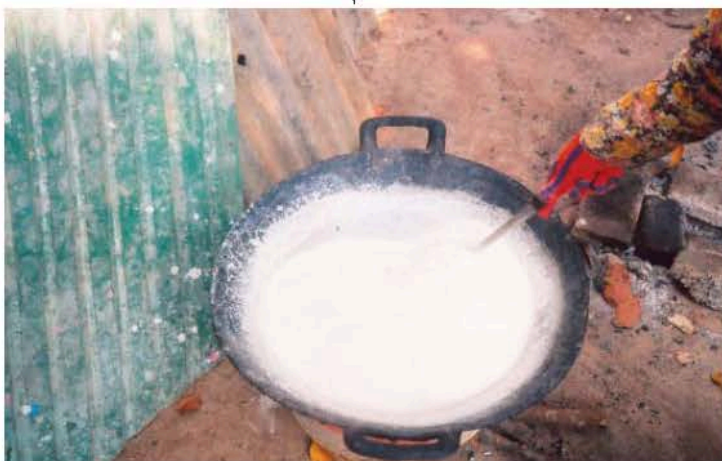
ទឹកស្ករស លាយជាមួយទឹកដោះតោ