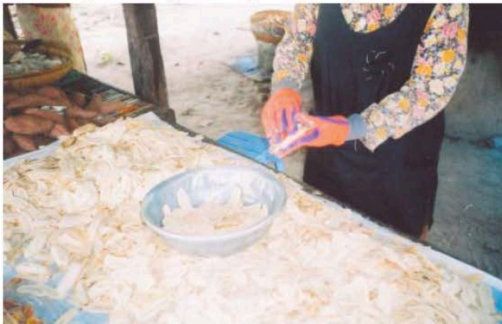
រេះបន្ទះចេកចេញពីគ្នាមុនពេលបង់ចូលខ្ទះប្រេងសណ្តែក