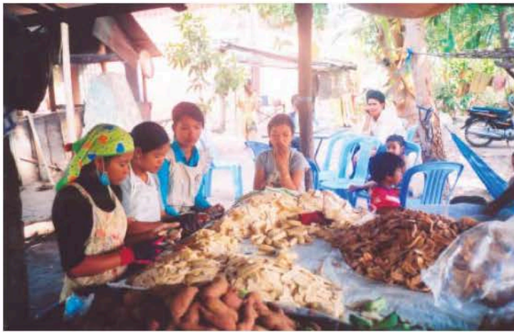
សកម្មភាពចិតផ្លែចេកជាបន្ទះៗដោយប្រើកាំបិតមុខពីរ