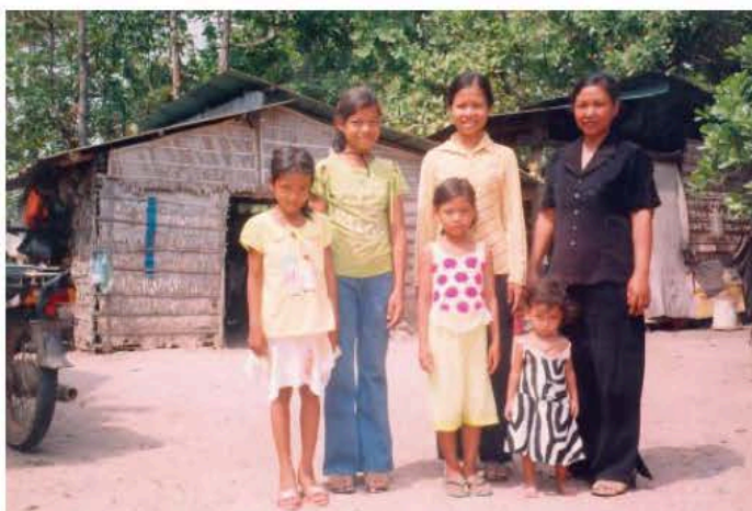
គេហដ្ឋានមុនពេលប្រកបមុខរបរចេកឆាប់