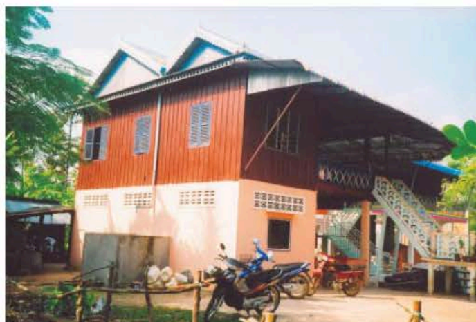
គេហដ្ឋានដែលបានសង់ក្រោយពេលប្រកបមុខរបរចេកឆាប់