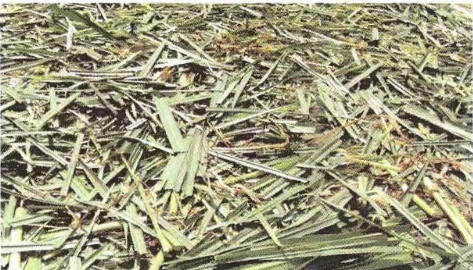
ស្មៅស្តេចដាំនៅក្នុងស្ថានីយ៍ពិសោធន៍សត្វ សរភក

សត្វនៃសាកលវិទ្យាល័យភូមិន្ទកសិកម្ម ។ ស្មៅស្តេច ត្រូវបានកាត់នៅអាយុ ៣០ ទៅ ៤៥ ថ្ងៃ ។ បន្ទាប់មកគឺយើងយកវាមកកាត់ជាបំណែកតូចៗ(ប្រវែងប្រហែលជា ៥ ស.ម) ហើយយកវាទៅសម្ងួតក្រោមពន្លឺព្រះអាទិត្យប្រមាណជា ៤ ទៅ ៥ ម៉ោង ។ បន្ទាប់មកយើងច្រកវាចូលទៅក្នុងបាវមុនពេលដាក់វាចូលទៅថង់ពូស្តិក ។ ជាចុងក្រោយយើងអាចផ្តល់គោស៊ីក្រោយផ្តាច់ ១៥ថ្ងៃ ។