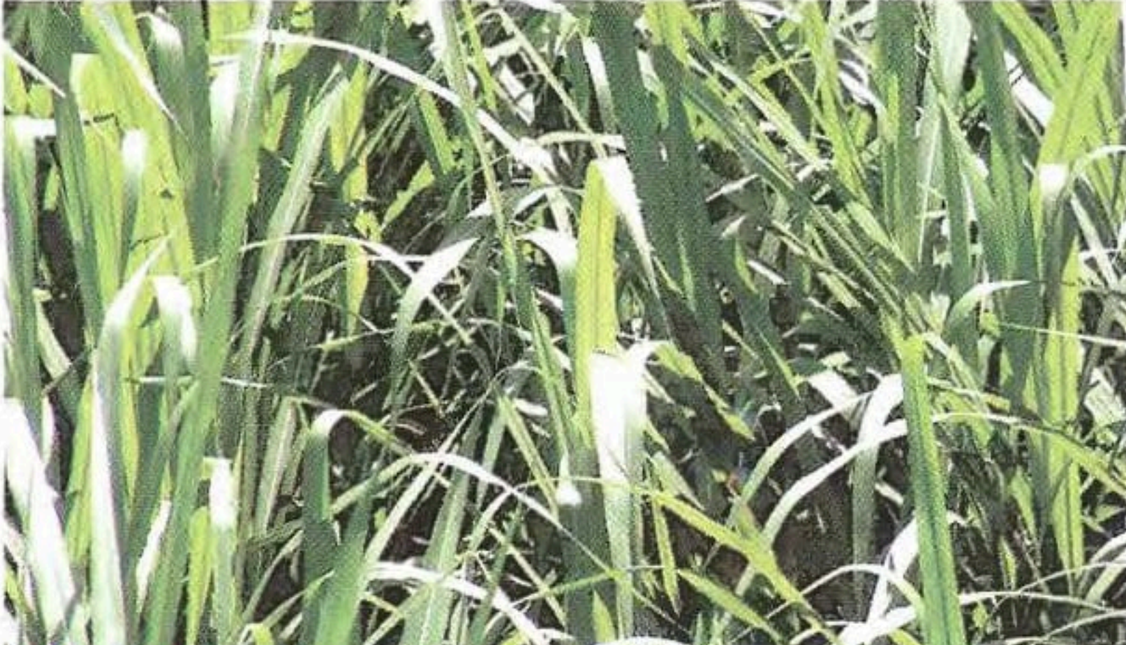
ស្មៅស្តេច សម្ងួតក្រោមពន្លឺព្រះអាទិត្យ