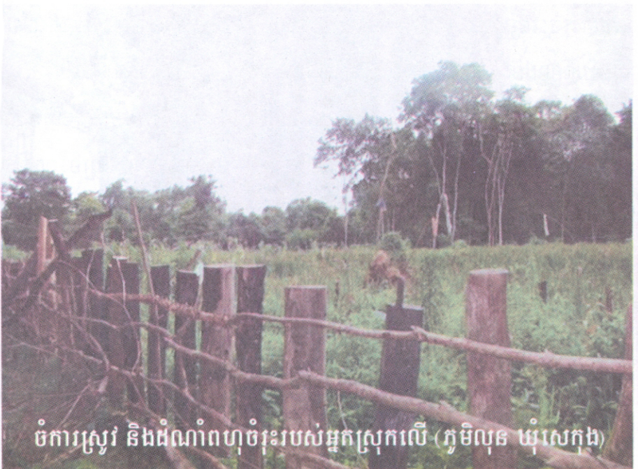
ចំការស្រូវ និងដំណាំពហុធុររបស់អ្នកស្រុកលើ (ភូមិលុន ឃុំសេកុង)