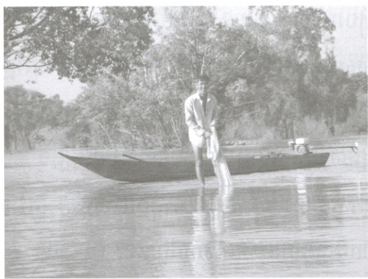
ការនេសាទត្រីនៅក្បែរអន្លង់អាចម៍ក្រពើបីពាន់ នៅក្នុងទន្លេមេគង្គភាគខាងលើ ខេត្តស្ទឹងត្រែង

អន្លង់អាចម៍ក្រពើបីពាន់មានបណ្តោយ ៥០០ម និងទទឹង១០០ម៉ែត្រ ជម្រៅ នារដូវប្រាំង២០ម៉ែត្រ និងរដូវវស្សា៤០ម៉ែត្រ (ការវាស់ដោយអ្នកនេសាទ នៅភូមិ- អូររុនដោយប្រើខ្សែសន្ទូចចងនឹងដុំថ្ម ដើម្បីធ្វើការវាស់ជំរៅ បណ្តោយ និង ទទឹងរបស់ អន្លង់អាចម៍ក្រពើបីពាន់នាពេលកន្លងមក) ។