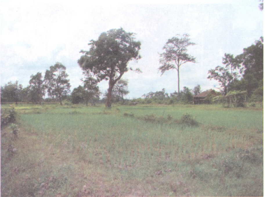
អម្ពកស្រែស្រូវ និងផ្ទះស្រែរបស់អ្នកស្រុកលើ (ភូមិលុន ឃុំ សេកុង ស្រុកសៀមបាំង)