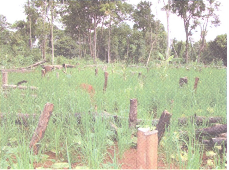
ចំការពនេចរ និងដើមឈើច្បោះរបស់បងប្អូនជនជាតិដើមភាគតិច