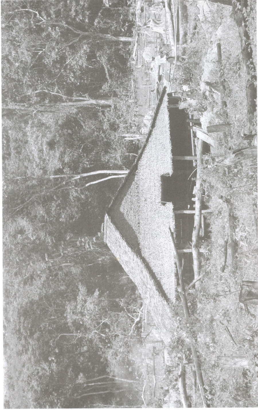
ទិដ្ឋភាពផ្ទះ និងចំការពនេចរ(ចំការវិលដុំ) របស់ជនជាតិព្រំដែននៅភូមិយួន ឃុំផាកណាម ស្រុករឹងសៃ ខេត្តរតនគិរី