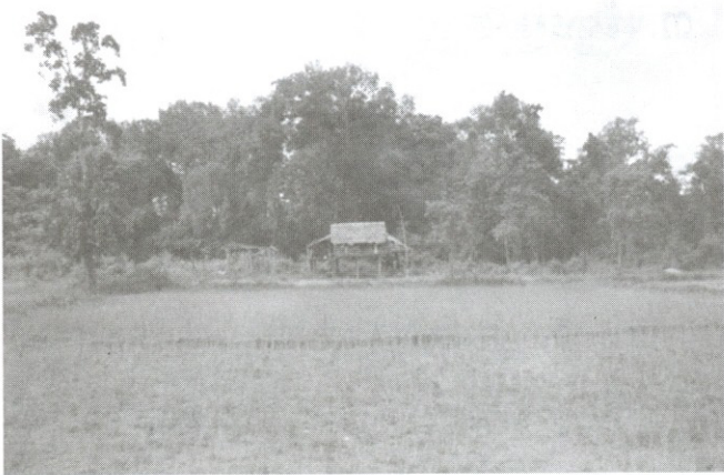
ស្ថានភាពផ្ទះស្រែ និងអង្គកស្រែស្រូវ របស់អ្នកស្រុកលើ នៃភូមិលុន ឃុំ សេកុង ស្រុកសៀមបាំង ខេត្តស្ទឹងត្រែង

កម្លាំងពលកម្មរបស់មនុស្ស ដើម្បីដាំស្រូវ និងថែទាំស្រូវ ។