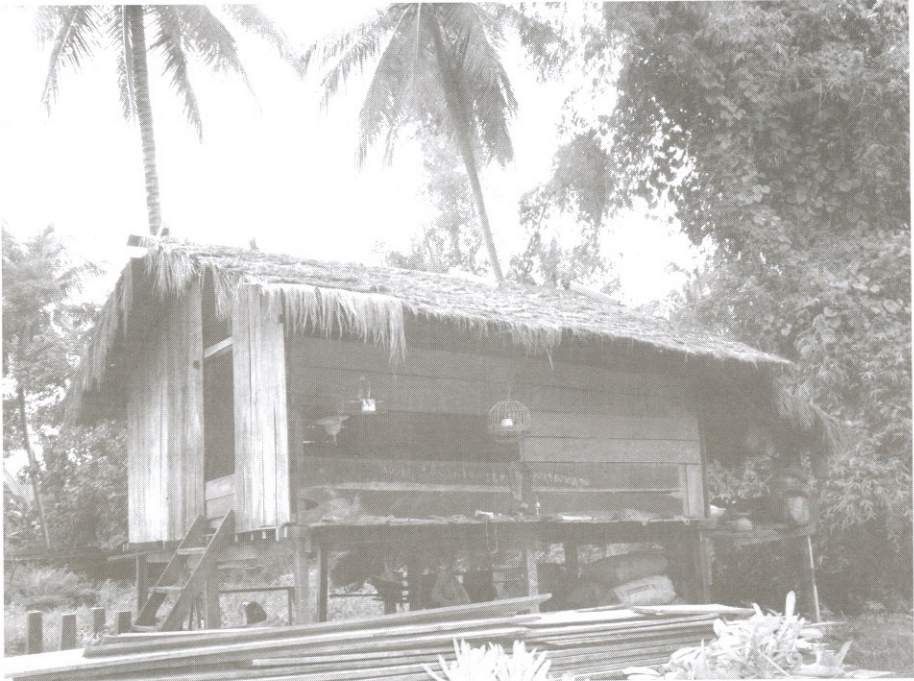
ស្ថានភាពផ្ទះរបស់អ្នកស្រុកកោះឈើទាលធំ ខេត្តស្ទឹងត្រែង