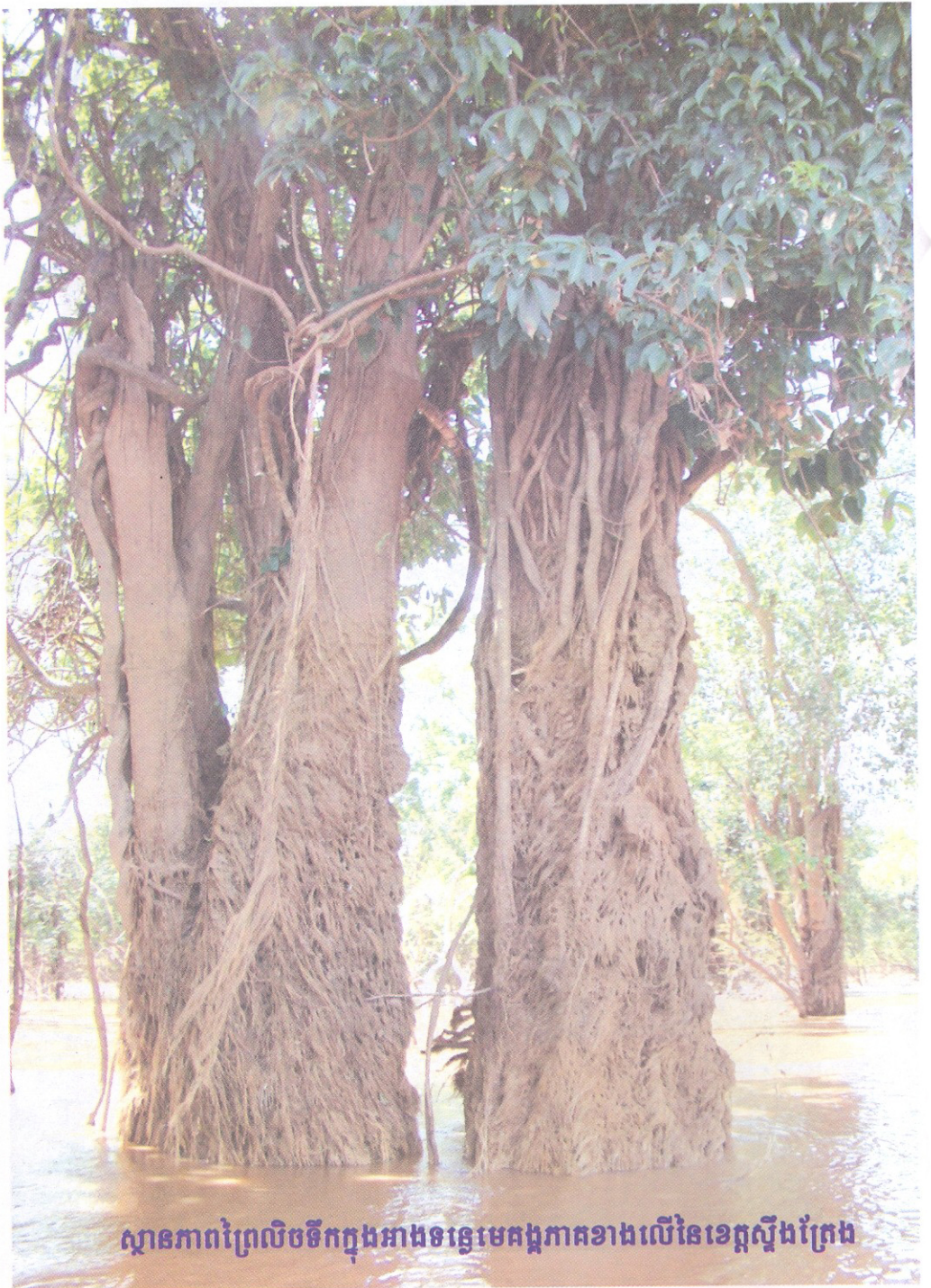
ស្ថានភាពព្រៃលិចទឹកក្នុងអាងទន្លេមេគង្គភាគខាងលើនៃខេត្តស្ទឹងត្រែង