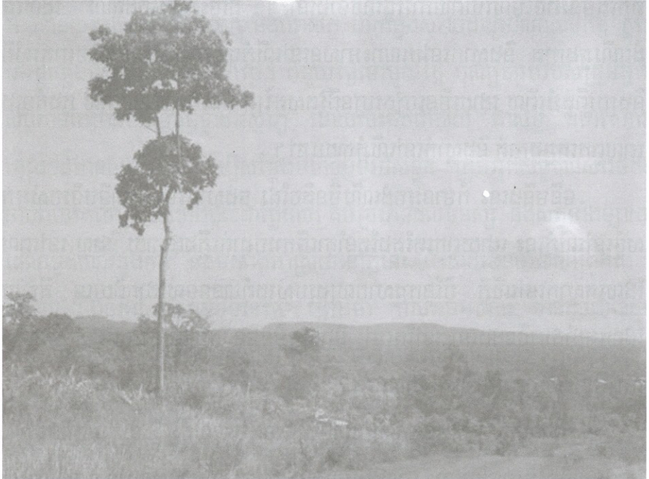
ទិដ្ឋភាពភ្នំបាយនៅ មើលពីចំងាយ

សារការវិវត្តនៃសង្គម ការបំផ្លាញព្រៃឈើ និងកត្តាបច្ចេកវិទ្យាខ្ពស់ៗ បានហូរចូលទៅ កាន់ខេត្តមណ្ឌលគិរី និងភ្នំបាយនៅយ៉ាងគគ្រឹកគគ្រេង ដែលនាំឱ្យជំនឿតាំងពីជំនាន់ ដើមនោះ សាបរលាបបន្តិចម្តងៗ។ ទោះជាយ៉ាងណាក៏ដោយ ក៏បងប្អូនជនជាតិដើម ភាគតិចនៅតែគោរពចំពោះតំណាងនេះដដែលរហូតមកដល់ពេលបច្ចុប្បន្ននេះ ។