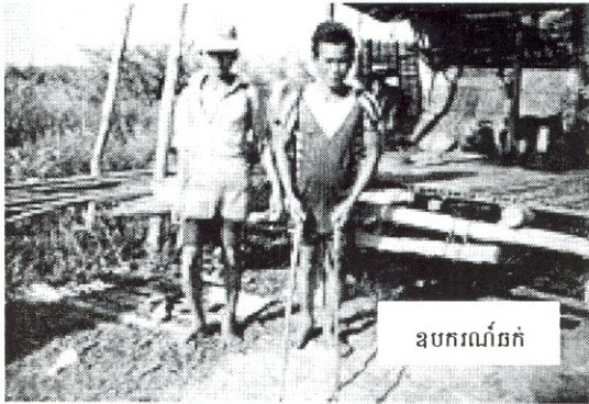
ឧបករណ៍ឆក់