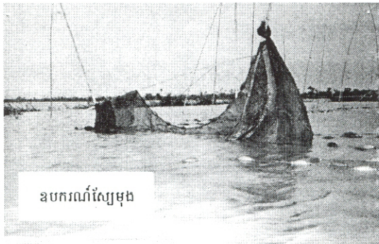
ឧបករណ៍ស្បែក