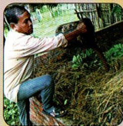
ដូសជីឡូឌស្ទីនរាវ ស្រោចពីលើសារធាតុ ដែលបានផ្សំរួច