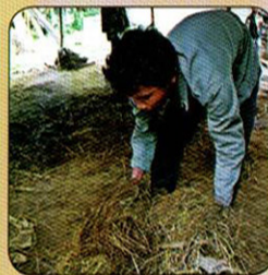
ប្រមូលសំរាមដែល អាចពុកផុយរលួយ ដាក់ក្នុងរោងជី