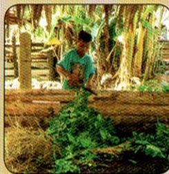
កាប់ចិត្រាំស្លឹកឈើ ស្រស់ដាក់ក្នុងរោងជី