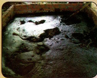
ទម្រង់ពាក់កណ្តាលស្នូត