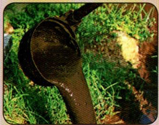
ទម្រង់រាវ