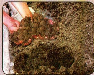
ទម្រង់ស្នូត