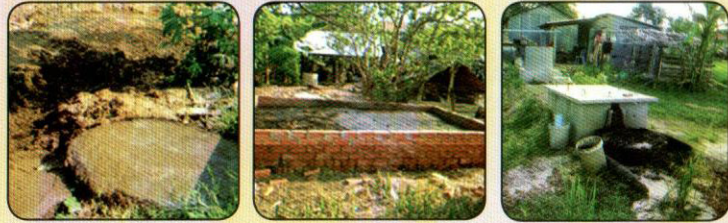
អាងស្តុកគ្មានគំរឹប រណ្តៅដីអត់ដំបូល ទុកអោយដីហូរពាសវាលពាសកាល