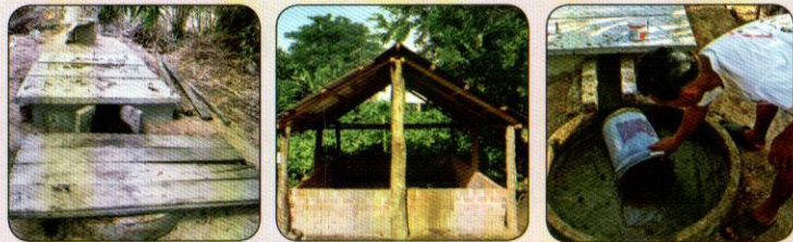
អាងស្តុកមានគំរឹបការពារ រោងដីមានដំបូល ដូសដីឡើងវិញដើម្បីប្រើជាប្រចាំ