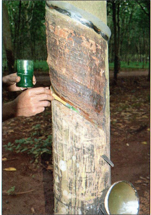
ការិយាល័យសរីរវិទ្យានិងអាជីវកម្ម ខែតុលា ឆ្នាំ២០១២