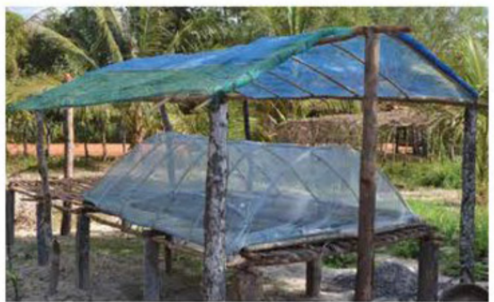
រានបណ្តុះកូនបន្លែសម្រាប់រដូវប្រាំង