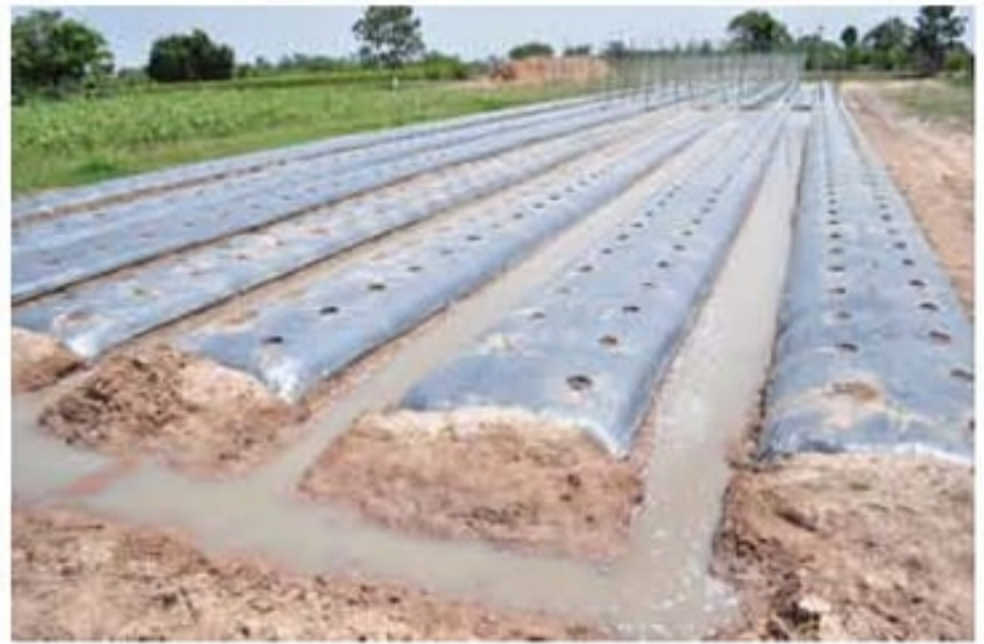
រងបានបញ្ចូលទឹកនៅពេលព្រឹកត្រៀមដាំកូនស្ពៃក្លោបពេលរសៀល