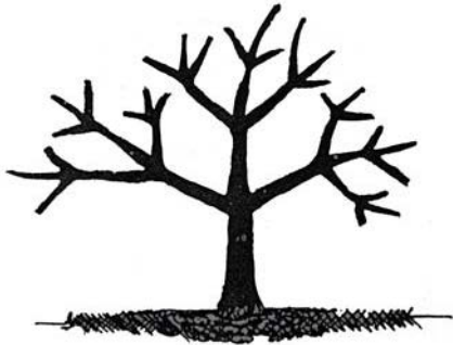
កាត់តែងមែកតាមប្រព័ន្ធទ-៣-៦-១៨