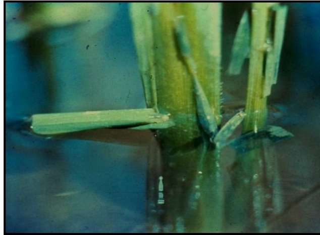
ការបំផ្លាញរបស់ដង្កូវបំពង់កាត់ស្លឹក មានរយៈពេលពី ២០ថ្ងៃ ៥-វិធានការការពារ និងកំចាត់

-កាត់ចុងស្លឹកស្រូវធ្វើជាបំពង់ បណ្តែតលើផ្ទៃទឹកនៅពេល ថ្ងៃ បំផ្លាញស្លឹកស្រូវនៅពេលយប់ ។