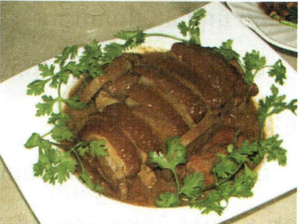
ផលិតផលកែច្នៃពីត្រាវ