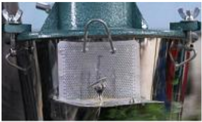
សន្ទះកែសម្រួល