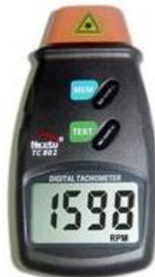
បរិក្ខារវាស់ល្បឿនជុំដោយប្រើកាំរស្មីឡាហ្វែរ