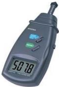
បរិមាណវាស់ល្បឿនជុំដោយផ្ទាល់

ក្នុងពេលដំណើរការ យើងអាចវាស់ល្បឿនជុំរបស់ម៉ាស៊ីនបាន។ ជាទូទៅ បរិក្ខារវាស់ល្បឿនជុំមាន ២ ប្រភេទ គឺប្រភេទវាស់ផ្ទាល់ និងវាស់ដោយប្រើកាំរស្មីឡាហ្វែរ។ វាបង្ហាញល្បឿនជុំ គិតជាជុំ / នាទី។