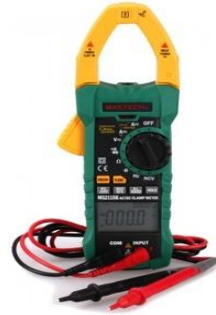
បរិក្ខារវាស់បានច្រើនមុខ (Electric Multi Meter)

បរិក្ខារខាងក្រោម អាចវាស់បាន ច្រើនមុខ (Electric Multi Meter) ដូចជា តង់ស្យុង អាំងតង់ស៊ីតេ រេស៊ីស្តង់ និងទិន្នន័យផ្សេងទៀត នៅពេលម៉ូទ័រកំពុងដំណើរការ។