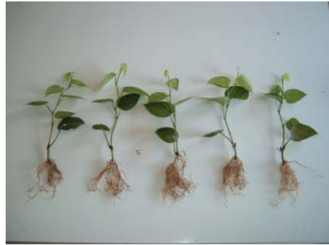
၆.၆ ရေဗျဉ်း