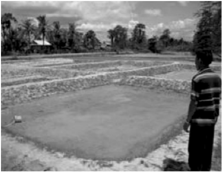
ការបូមទឹកពង្រឹង-ចាប់ត្រីកាច-ស្តារភក់ ការសំអាតស្មៅ-រុក្ខជាតិជុំវិញស្រះ

-ការបាចកំបោរបាតស្រះ: ប្រើកំបោរសបាចឱ្យសព្វបាតស្រះ ដើម្បីសម្លាប់មេរោគ និងកែលំអកម្រិត pH ឬ កម្រិតជាតិជួរនៃទឹក។ ចំពោះស្រះថ្មី