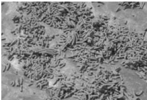
ការសម្រួតចំណីគ្រាប់