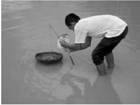
ការផ្តល់ចំណីដោយប្រើកន្ត្រែង