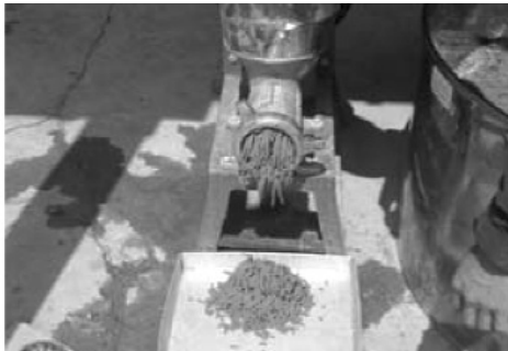
ឧបករណ៍ផលិតចំណីគ្រាប់