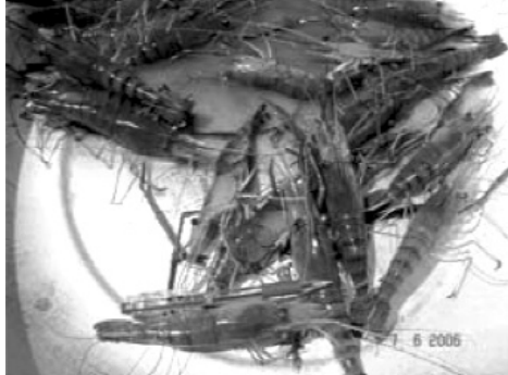
ការប្រមូលផលបង្កង