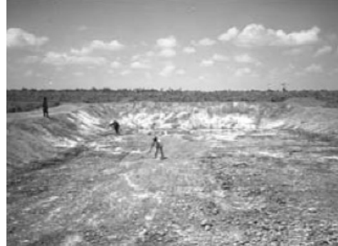
ការបាចកំបោរបាតស្រះចាស់

ចំណាំ: ពេលបញ្ចូលទឹកក្នុងស្រះ ត្រូវច្រោះនឹងស្បែកក្រឡាស្តិតទំហំ ០.៥ មិល្លីម៉ែត្រ ដើម្បីការពារត្រីល្អិត កំពឹស និងសត្វចង្រៃផ្សេងៗចូលក្នុងស្រះ ដែលបានរៀបចំហើយ ។