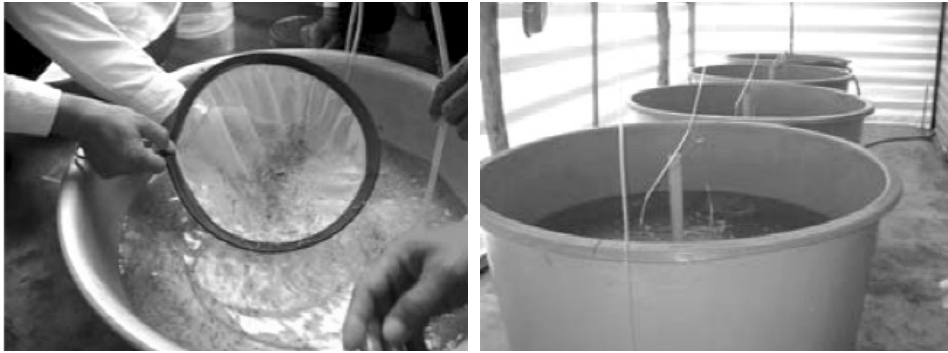
កូនបង្កពូជសម្រាប់ដាក់ចិញ្ចឹម