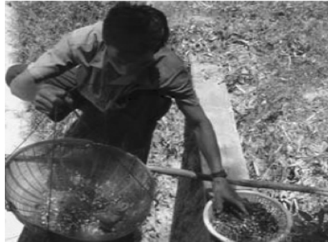
ប្រភេទចំណីស្រស់