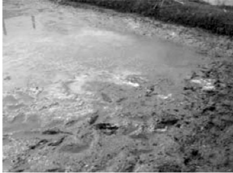
ការបាចកំបោរបាតស្រះថ្មី