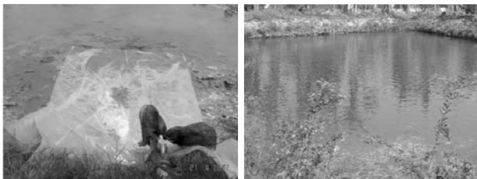
បញ្ចូលទឹកដោយច្រោះនឹងស្បែក គុណភាពទឹកស្រះក្រោយពេលរៀបចំ

ត្រូវបាចកំបោរក្នុងបរិមាណពី ៣ ទៅ ៥ គីឡូក្រាម ក្នុង ១០០ ម៉ែត្រការេ និង ចំពោះស្រះចាស់គួរប្រើកំបោរក្នុងបរិមាណពី ៧ ទៅ ១០ គីឡូក្រាម ក្នុង ១០០ ម៉ែត្រការេ ។