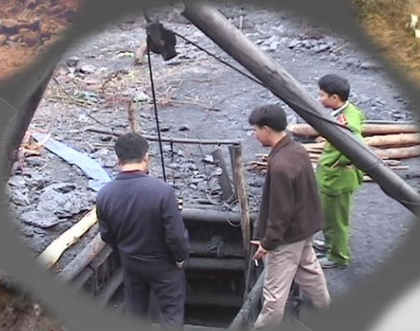
ប្រើប្រាស់ ទៅខេត្ត Quang Ninh (2009)