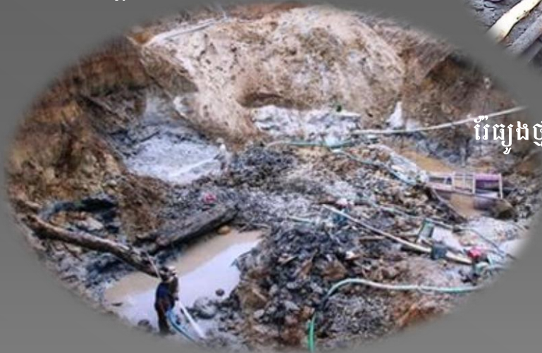
ការធ្វើអាជីវកម្មវ៉ែនដៃសំណប់ហាំង នៅបឹងទំនប់វារីអគ្គិសនី Da Kha ខេត្ត Lam Dong (2008)