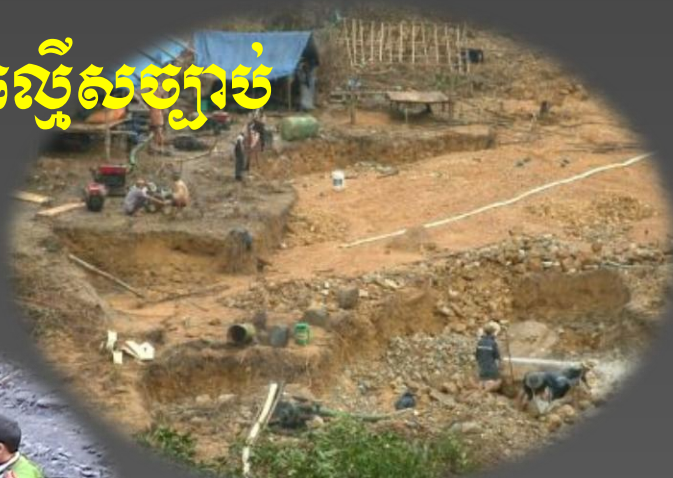
វ៉ែមាស នៅ Phuoc Son, ខេត្ត Quang Nam (2008)