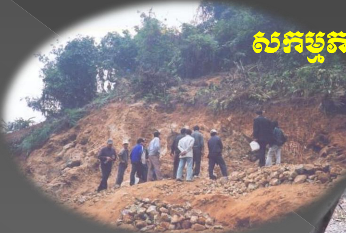
ការដឹកយកវ៉ែនដៃនៅ Ta Phoi, ខេត្ត Lao Cai (2007)