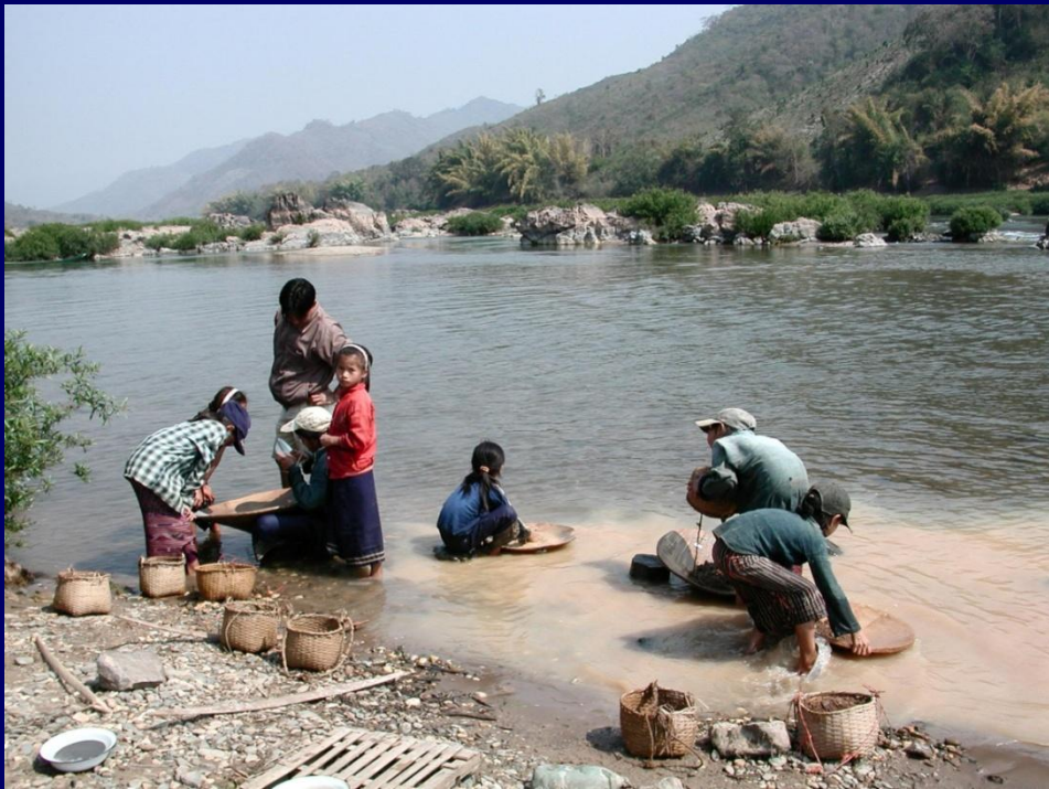
ការលាងរ៉ែមាសនៅប្រទេសឡាវ