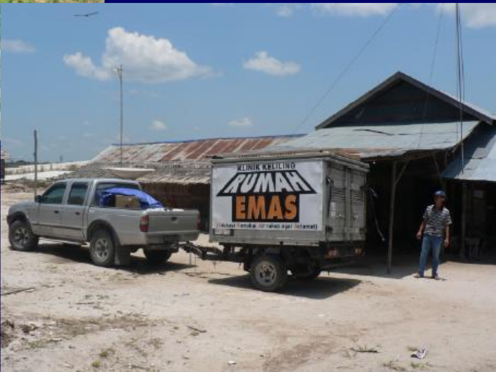
“អង្គភាពបណ្តុះបណ្តាលចល័ត” សម្រាប់សាកល្បងបច្ចេកវិទ្យានៅក្នុងតំបន់យកវីនានា