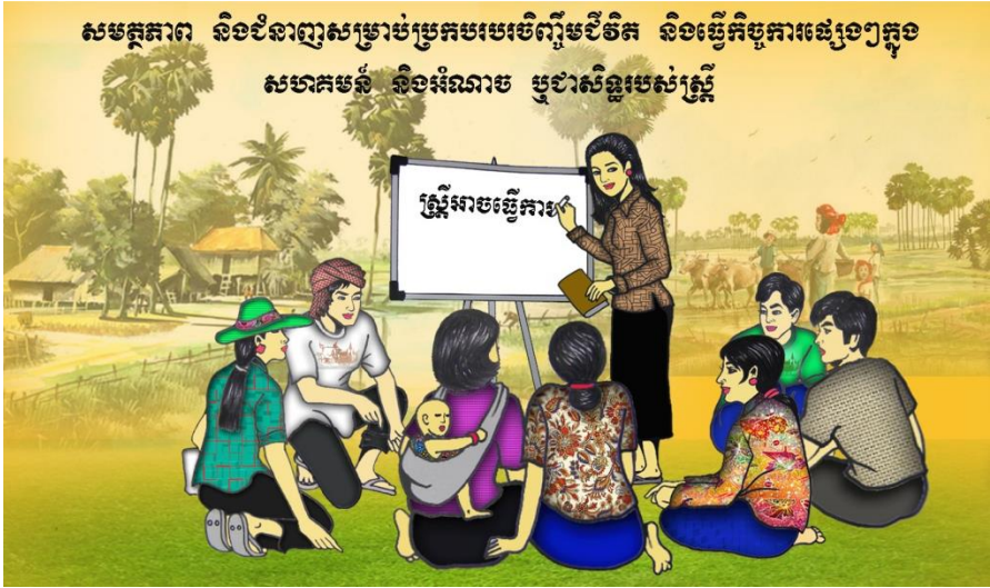
(លើករូបនេះបង្ហាញ)

សមត្ថភាព និងជំនាញសម្រាប់ប្រកបរបរចិញ្ចឹមជីវិត និងធ្វើកិច្ចការនានាក្នុងសហគមន៍ គឺជាអំណាច ឬជាសិទ្ធិរបស់ស្ត្រី មិនមានអ្នកណាម្នាក់អាចរារាំង ឬដកហូតអំណាចនោះ ពីស្ត្រីបានទេ។ ស្ត្រីត្រូវហ៊ាននិយាយជាមួយប្តី និងក្រុមគ្រួសារ ឬសហគមន៍ដើម្បីប្រើប្រាស់អំណាច ឬសិទ្ធិរបស់ខ្លួន។