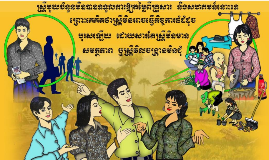
(លើករូបនេះបង្ហាញ)

ប៉ុន្តែស្ត្រីមួយចំនួននៅតែមិនបានទទួលការឲ្យតម្លៃពីគ្រួសារ និងសហគមន៍ ព្រោះគេគិតថាស្ត្រីមិនអាចធ្វើ កិច្ចការធំដុះបុរស ដោយសារតែស្ត្រីមិនមានសមត្ថភាព ឬស្ត្រីវិលចង្កានមិនជុំ។