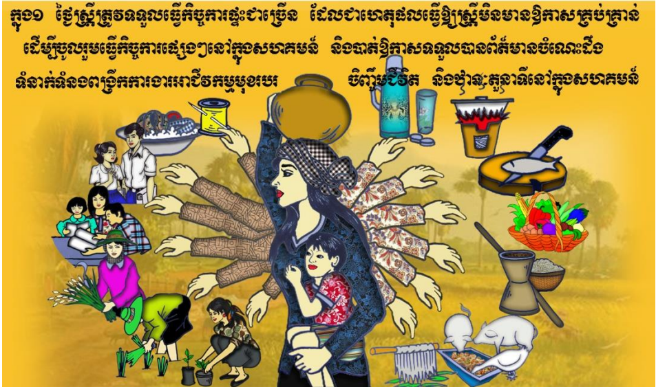
(លើករូបនេះបង្ហាញ)

តាមរយៈលំហាត់យើងដឹងហើយថា ក្នុង១ថ្ងៃស្រ្តីត្រូវទទួលខុសត្រូវលើកិច្ចការជាច្រើនមុខ។ មានអ្នកខ្លះ បានហៅស្រ្តីថាមានដៃ១០០ ព្រោះតែស្រ្តីមានការងារច្រើនដែលត្រូវធ្វើ។ ចំណុចនេះ គឺជាហេតុផលមួយដែលធ្វើឲ្យស្រ្តីមិនមានឱកាសគ្រប់គ្រាន់ដើម្បីចូលរួមក្នុងកិច្ចការផ្សេងៗនៅក្នុងសហគមន៍ និងបាត់បង់ឱកាសទទួលបានព័ត៌មាន ចំណេះដឹង ទំនាក់ទំនងពង្រីក ការងារអាជីវកម្ម មុខរបរចិញ្ចឹមជីវិត និងឋានៈតួនាទីនៅក្នុងសហគមន៍។