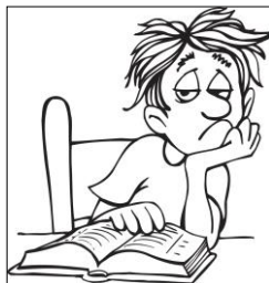
មិនយកចិត្តទុកដាក់