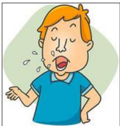
មិននិយាយតែឯង