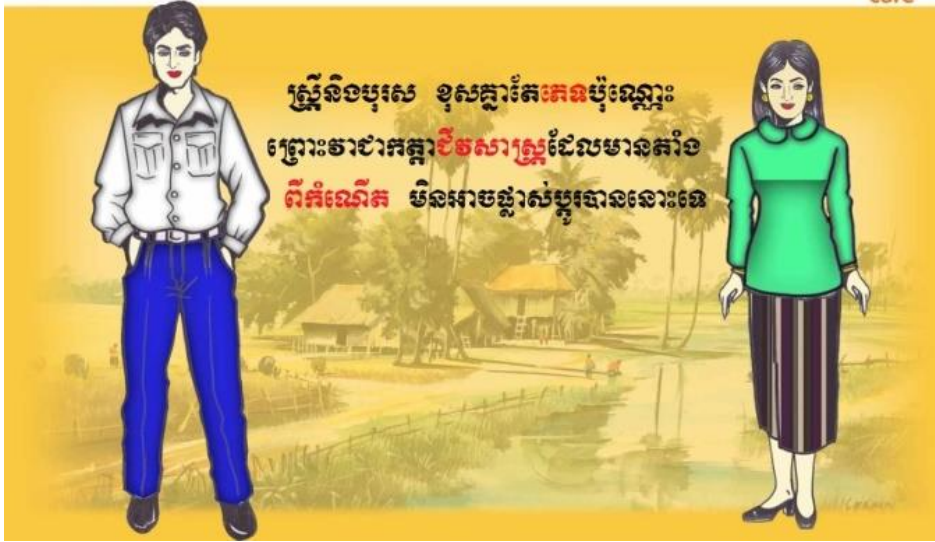
(លើករូបនេះបង្ហាញ)

ក្រៅពីកត្តាភេទនេះ ទាំងស្ត្រី ទាំងបុរស មានសិទ្ធិស្មើគ្នាតាំងពីកំណើត រស់នៅស្មើភាពគ្នា និងមាន សមត្ថភាពដូចគ្នាក្នុងការធ្វើកិច្ចការនានា និងទទួលបានលទ្ធផលស្មើគ្នាចំពោះការងារដូចគ្នា ។