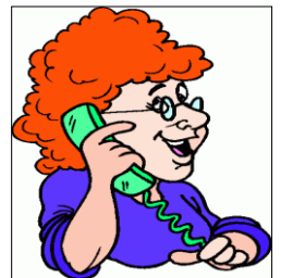
មិននិយាយទូរស័ព្ទ