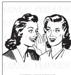
មិននិយាយគ្នាពេលរៀន