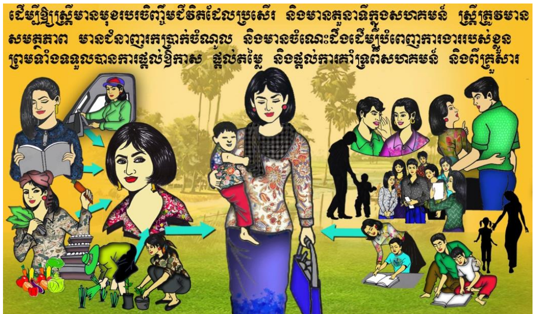
(លើករូបនេះបង្ហាញ)

សមាជិកគ្រួសារ និងសហគមន៍ត្រូវផ្តល់តម្លៃ និងផ្តល់ឱកាសដល់ស្ត្រី ដើម្បីឲ្យស្ត្រីមានពេលវេលាគ្រប់គ្រាន់រកប្រាក់ចំណូល និងបំពេញកិច្ចការផ្សេងៗក្នុងសហគមន៍បានល្អ។