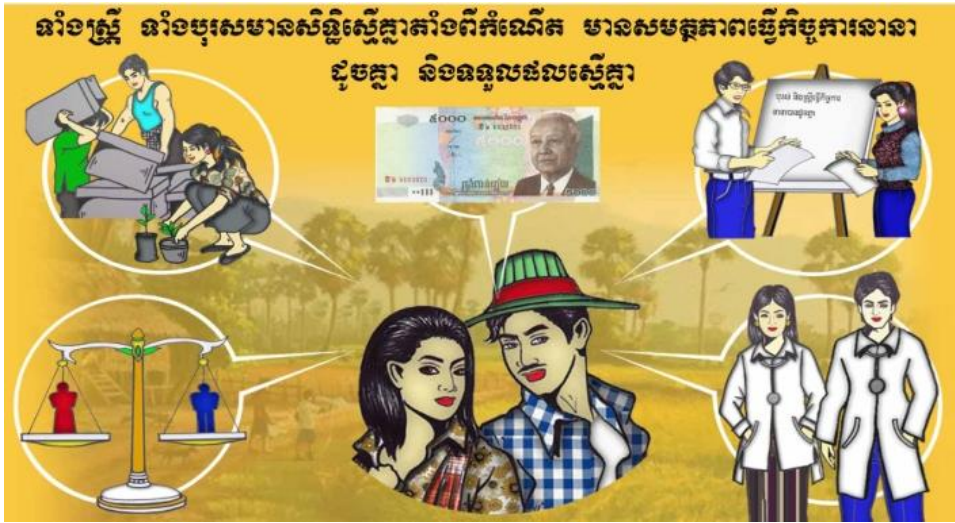
(លើករូបនេះបង្ហាញ)

ក្រៅពីកត្តាភេទនេះ ទាំងស្ត្រី ទាំងបុរស មានសិទ្ធិស្មើគ្នាតាំងពីកំណើត រស់នៅស្មើភាពគ្នា និងមាន សមត្ថភាពដូចគ្នាក្នុងការធ្វើកិច្ចការនានា និងទទួលបានលទ្ធផលស្មើគ្នាចំពោះការងារដូចគ្នា ។