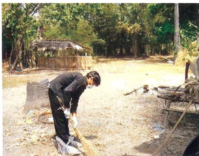
សំអាតបរិវេណជុំវិញអោយបានឡើងទាត់