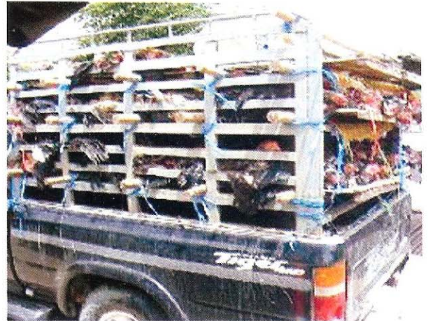
ការដឹកជញ្ជូនបក្សី និង ផលិតផលមានដើមកំណើតពីបក្សី ដោយប្រើយានជំនិះកខ្វក់ ដែលអាចយកមេរោគពីកន្លែងមួយ ទៅកន្លែងមួយទៀត