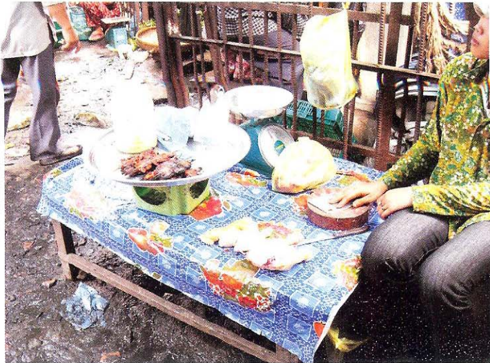
ការដាក់លក់មិនបានត្រឹមត្រូវ - ដាក់ម្ហូបឆៅ និង ឆ្អិន ជាមួយគ្នា