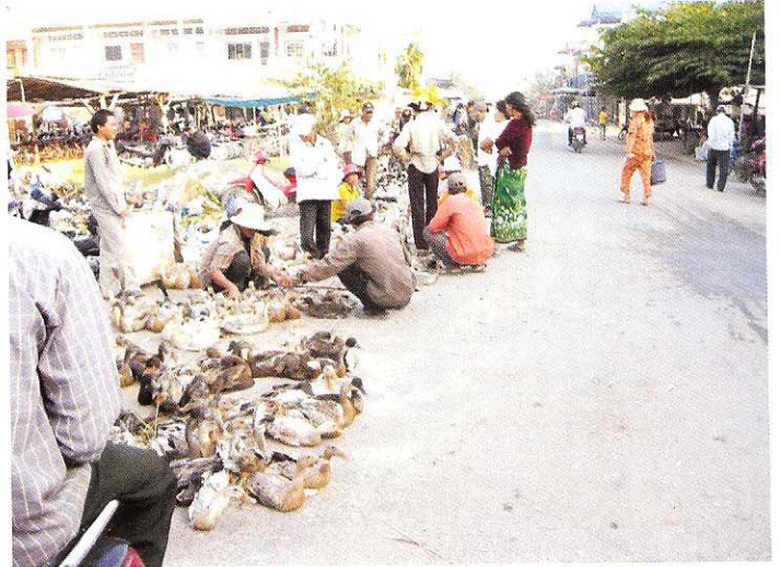
កន្លែងលក់មិនសមស្រប