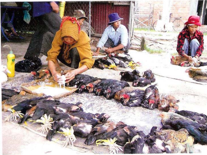
សំលាប់បក្សី នៅក្នុងផ្សារ ដោយគ្មានអនាម័យត្រឹមត្រូវ