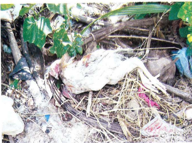
ការចោលបក្សីងាប់មិនបានត្រឹមត្រូវ គឺជាប្រភពដ៏ល្អ មួយរបស់ជំងឺ