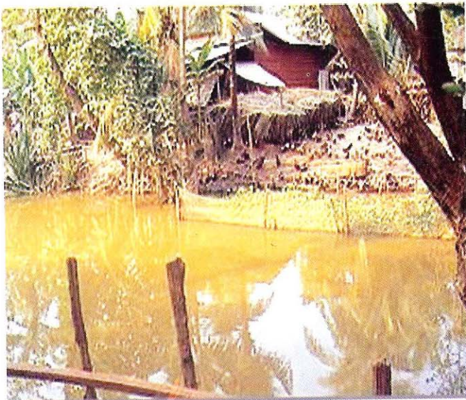
ការចិញ្ចឹមបក្សី តាមវាល/តាមស្ទឹង