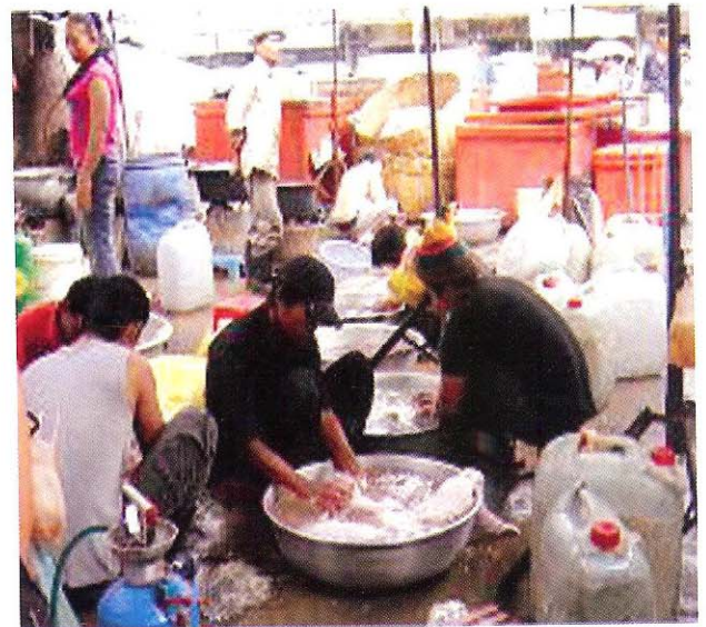
ការសំលាប់បក្សី ដែលគ្មានអនាម័យត្រឹមត្រូវ