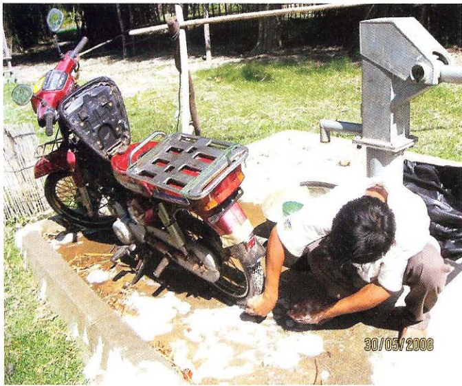
លាងម៉ូតូ ជាមួយសាប៊ូ និង ទឹក