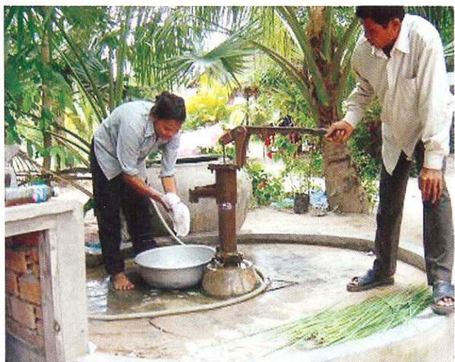
លាងដៃជាមួយសាប៊ូ និង ទឹក ក្រោយពេលប៉ះពាល់បក្សីហើយ

ធ្វើការពិគ្រោះយោបល់ ជាមួយមន្ត្រីបសុពេទ្យរបស់អ្នក ប្រសិនបើអ្នកសង្ស័យថាបក្សីរបស់អ្នកមានជំងឺ។ កុំរង់ចាំ ទាល់តែស្ថានភាពចេះតែដុះដាលទៅ។ ការរកឃើញជំងឺបានឆាប់ និង ការរាយការណ៍ភ្លាមៗ ប្រហែលជាអាចជួយ បញ្ឈប់ការរាលដាលរបស់ជំងឺបាន។ រោគសញ្ញា ដែលត្រូវប្រុងប្រយ័ត្ន រួមមាន ងាប់ភ្លាមៗ អស់កំលាំង មិនសូវស៊ី ចំណី រាត ពិបាកដកដង្ហើម ដូចជា ក្អក កណ្តាស់ និង ដង្កក់ ញ័រ បែបសន្លែប្រសាទ សំយ៉ុងស្លាបចុះ ឬ ខ្លិន និង ហើមក្បាល ដោយសិរ ណង់ និង ជើងមានស្នាមជាំ។ កុំប្រើប្រាស់ការព្យាបាល ដែលគ្មានការណែនាំពីមន្ត្រី បសុពេទ្យ ព្រោះអាចមានផលប៉ះពាល់អវិជ្ជមាន ធ្វើអោយបក្សីរបស់អ្នក កាន់តែឈឺធ្ងន់។