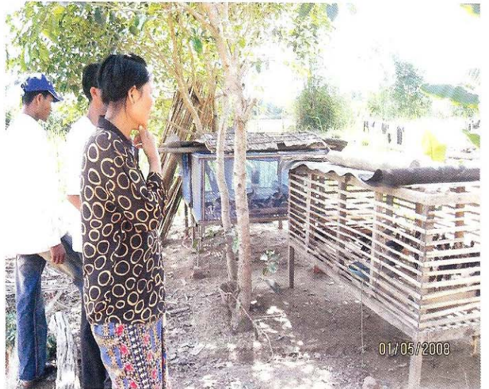
មនុស្សមិនគួរចូលទៅកាន់កសិដ្ឋានដទៃទៀតឡើយ