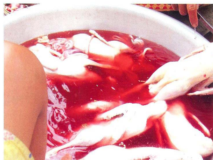
ការសំលាប់គ្មានអនាម័យត្រឹមត្រូវ អាចចំលងជំងឺមកកាន់មនុស្ស (រូបភាពទាំង ២)