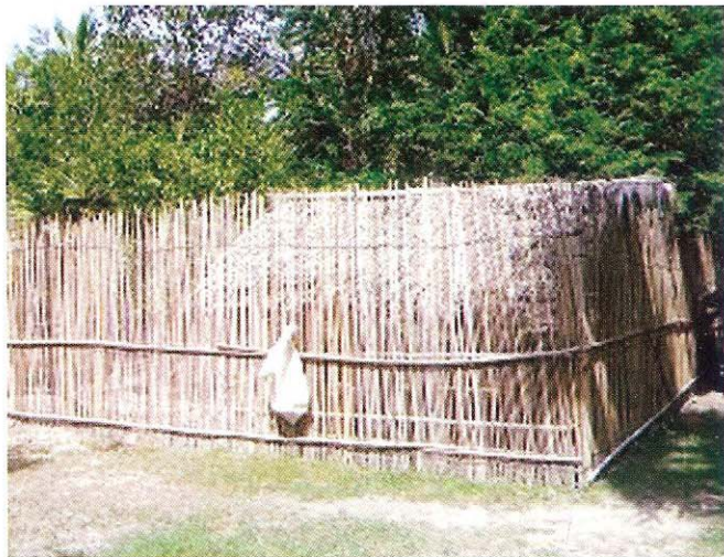
ធ្វើរបងជុំវិញកន្លែងដាក់បក្សី