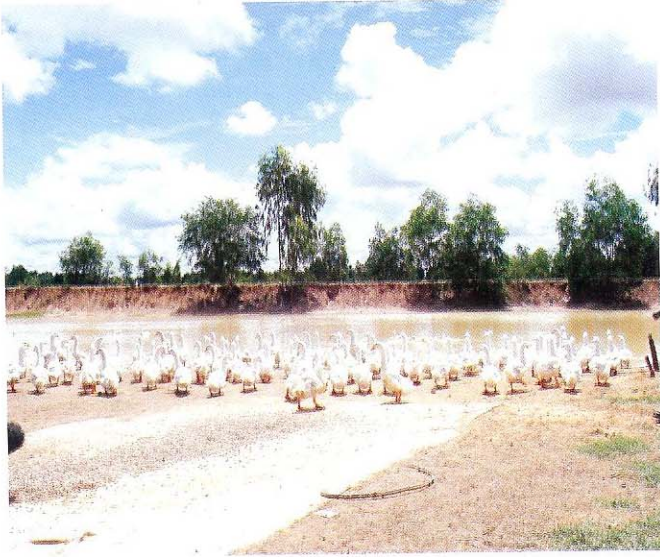
ការចិញ្ចឹមបក្សីពាសវាសពាសកាល តាមបឹង ឬ តាមវាល