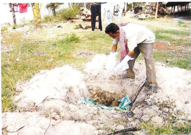
ដុត ឬ កប់បក្សីងាប់ អោយបានត្រឹមត្រូវ