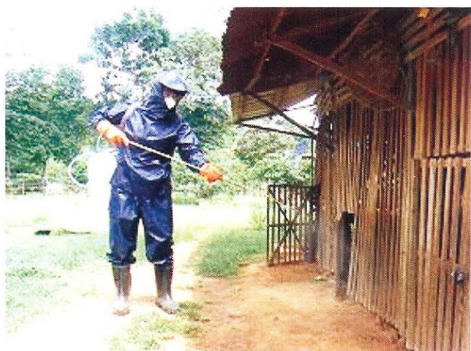
សំលាប់មេរោគលើទ្រុងបក្សី និង ទីធ្លាជុំវិញ