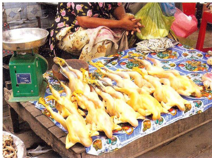
សំអាតកន្លែងលក់ និង ជញ្ជីងអោយ បានស្អាត

សំអាត និង សំលាប់មេរោគ នៅចុងថ្ងៃនីមួយៗ ។ កុំភ្លេចកន្លែងលក់ និង ទ្រុង ។ សំអាតលាមក និង រោមទាំងអស់ ជាមួយនឹងទឹក ហើយ បន្ទាប់មក បាញ់ថ្នាំសំលាប់សត្វល្អិតដែលសមស្រប (ដូចជា TH 4, GPC8, First Stop, កំបោរ) ។