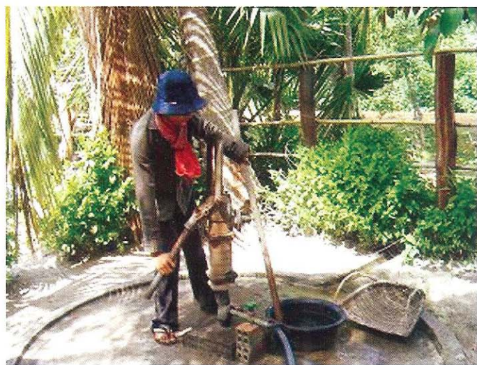
សំអាត និង សំលាប់មេរោគ ឧបករណ៍ប្រើប្រាស់ បន្ទាប់ពីប្រើហើយ