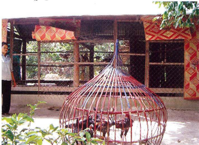
ដាក់បក្សីថ្មី អោយនៅដោយឡែកពីបក្សីចាស់ អោយបានយ៉ាងហោចណាស់រយៈពេល ១៤ ថ្ងៃ