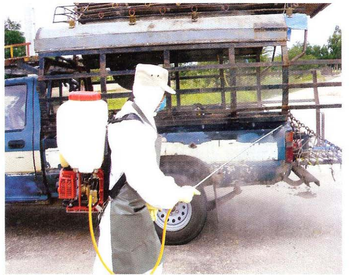
បាញ់ថ្នាំសំលាប់មេរោគ លើយានជំនិះ បន្ទាប់ពីដាក់បក្សីចុះរួច