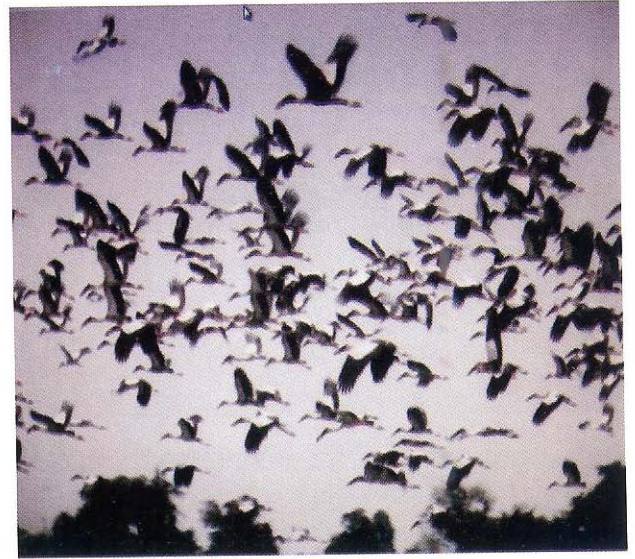
បក្សីហើរដោយសេរី អាចជាភ្នាក់ងារចំលងវីរុស