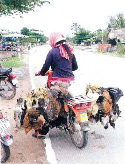
អ្នកទិញលក់បក្សី គួរទិញលក់ នៅតាមដងផ្លូវ