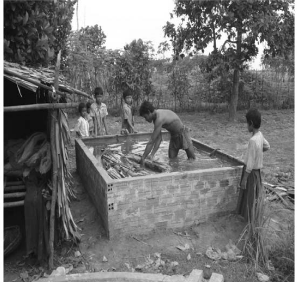
រូបភាពទី៤: ការត្រាំរុក្ខជាតិទានា និងដើមបេកដើម្បីឲ្យអស់ជាតិប្រៃ និងស៊ីម៉ង់ត៍មុនពេលលែងកូនត្រី