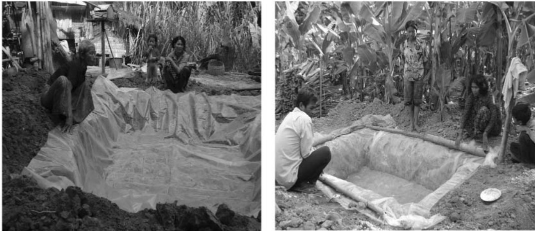
រូបភាពទី៣៖ ការរៀបចំកូនអាងតូចដោយដឹកដី និងក្រាលក្រណាត់កៅស៊ូ