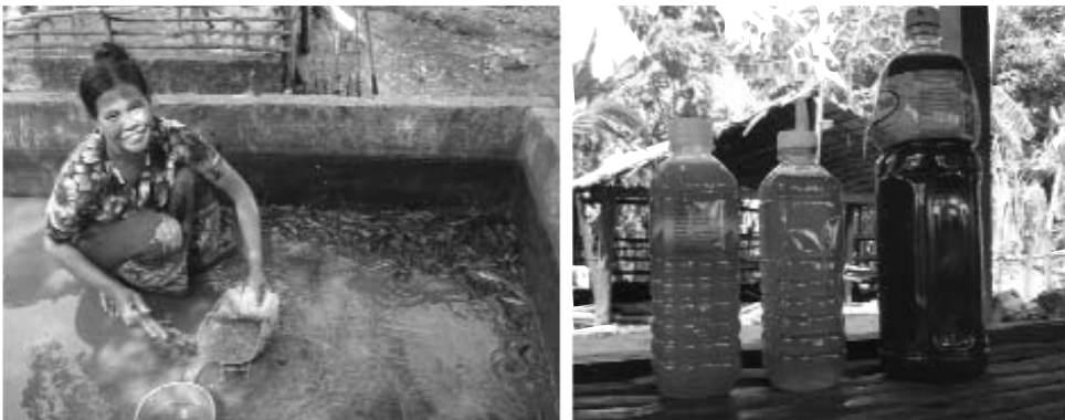
រូបភាពទី៩: ការបង្កូរទឹកចេញ និងការសំអាតអាង និងការមេអ៊ីអ៊ីមសំអាតសំលាប់មេរោគ

គួរប្រើទឹកមេបំបែក ឬ អ៊ី អ៊ីម ផ្សំពីផ្លែឈើលាយបាចចូល ទៅក្នុងអាងឬស្រះត្រី ១០មីលីត ក្នុង១ម៉ែត្រគូបទឹក ដើម្បីកែប្រែគុណភាពទឹក និងអាចជួយសំលាប់ពពួកបាក់តេរីចង្រៃពីក្នុងទឹក និងបន្ថយការស្អុយនៃទឹកក្នុងស្រះ ឬអាងចិញ្ចឹម ។