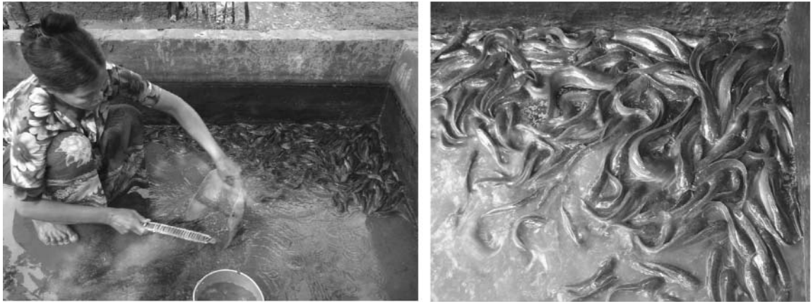
រូបភាពទី១០: ការបង្ហូរទឹកចេញ និងការសំអាតអាង និងការមេអ៊ីអិមសំអាតសំលាប់មេរោគ

គួរចាប់ត្រីដែលចិញ្ចឹមមកថ្លឹង ដើម្បីបានដឹងពីភាពលូតលាស់របស់វា។ ក្នុងដំណាក់កាលនេះកសិករត្រូវគិតគូរ ពីចំណី ដែលត្រូវផ្តល់បន្ថែម ដើម្បីបង្កើនភាពធំធាត់របស់ត្រី។