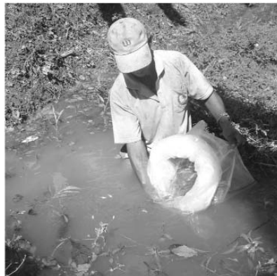
រូបភាពទី៥: សកម្មភាពព្រលែងកូនត្រីចូលក្នុងស្រះ ឬអាងតាមលក្ខណៈបច្ចេកទេស