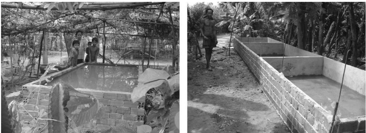
រូបភាពទី២: កូនអាងតូចដែលសង់ត្រូវត្រាំទឹកជាមុនសិនមុក់ត្រីចិញ្ចឹម

យើងអាចរៀបចំស្រះ ដោយដឹកជាស្រះតូចដែលមានទំហំ ទៅតាមការចង់បានរបស់អ្នកចិញ្ចឹម ការដឹកជាស្រះតូច អាចធ្វើការចិញ្ចឹមបានពេលមួយឆ្នាំ និងអាងចិញ្ចឹមបានពី ២ ទៅ ៣ដង ក្នុងមួយឆ្នាំ ប្រសិនបើកសិករអាចមាន លទ្ធភាពផ្តល់ចំណីគ្រប់គ្រាន់ ។ ក្រៅពីនេះ កសិករក៏អាចធ្វើជាអាងស៊ីម៉ង់តូចៗ ទៅតាមលទ្ធភាពដើម្បីធ្វើការ ចិញ្ចឹមត្រីអណ្តូងបានដែរ ។ វិធីនេះកសិករត្រូវចំណាយទុនច្រើនបន្តិច ប៉ុន្តែគាត់អាចប្រើប្រាស់សម្រាប់ចិញ្ចឹមបានរយៈ ពេលយូរពី ៨ ទៅ ១០ឆ្នាំ ព្រោះគាត់ពុំចាំបាច់ចំណាយទុនដើម្បីធ្វើអាងទៀតឡើយ បើប្រៀបធៀបទៅនឹងស្រះដែល ប្រើក្រណាត់កៅស៊ូរៀបជុំវិញក្នុងអាង ព្រោះវិធីសាស្ត្រនេះ កសិករនឹងចំណាយទុនដើម្បីទិញកំរាលកៅស៊ូជារៀងរាល់ វគ្គនៃការចិញ្ចឹមត្រី ។