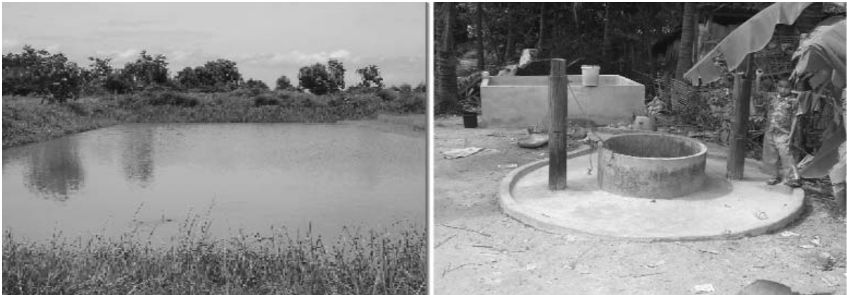
រូបភាពទី១: ស្រះដែលមានលក្ខណៈល្អប្រសើរ និងអាងតូចធ្វើពីស៊ីម៉ង់ និងឥដ្ឋ

ត្រូវជ្រើសរើសទីកន្លែង ដែលងាយបញ្ចេញបញ្ចូលទឹកបានស្រួល ។ ងាយក្នុងការថែទាំ ផ្តល់ចំណី និងនៅជិតផ្ទះ មានម្លប់ខ្លះ និង ត្រូវមានពន្លឺគ្រប់គ្រាន់ សម្រាប់ស្រះចិញ្ចឹមត្រី តូច ឬអាងតូច នៅក្បែរប្រភពទឹកដូចជា: ត្រពាំង ស្រះ អណ្តូង ជាដើម ។ ព្រោះយើងអាចងាយស្រួលក្នុងការផ្លាស់ប្តូរទីកន្លែងគ្រប់ពេលដែលយើងត្រូវការ ។