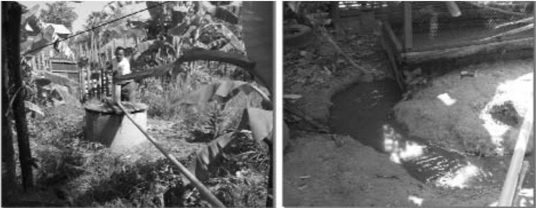
រូបភាពទី៨: ការបង្កូរទឹកជាក់ស្រះ និងការបង្កូរទឹកចេញពីស្រះដើម្បីសំអាតស្រះ