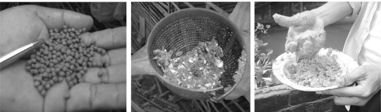
រូបភាពទី៧: ចំណីសិប្បនិម្មិតសម្រាប់ត្រីអណ្តែង ( ចំណីគ្រាប់ ត្រី-កង្កែប-ពស់ចិញ្ចៀន និង បាយជ្រូក )