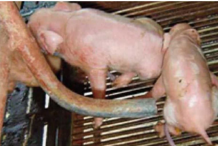
កូនជ្រូកទី ២ នឹងបន្តនៅ ១០ នាទីក្រោយ