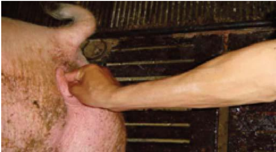
លាងសំអាតដៃ ហើយលាបប្រេង រំអិល ។ លូកដៃចូលក្នុងស្បូនផ្ទៃមៗ និងប្រុងប្រយ័ត្ន

ខ/ លូកដៃចូលតាមយោនី: ដើម្បីកំណត់ពីបញ្ហា ថាតើដោយសារកូនមានទីតាំងខុសធម្មតា ឬកូនថ្លោសពេក ។ ស្ត្រីអាចធ្វើកិច្ចការនេះបានល្អជាងបុរស ។ ពេលលូកដៃ ជួយបង្កើតរូងរាល់ហើយត្រូវចាក់អង់ទីប៊ីយ៉ូទិចរយៈពេល៣ថ្ងៃ ។ ពេលលូកដៃជួយបង្កើត