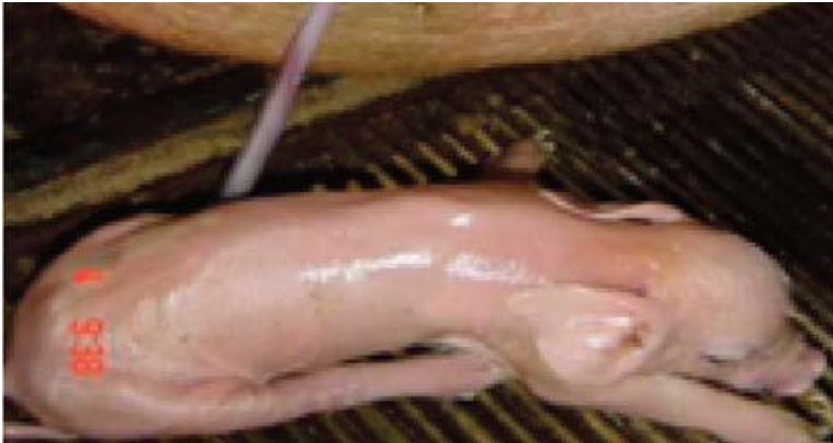
កូនជ្រូកនឹងផ្តាច់ទងដូតខ្លួនវា នៅពេលវាទៅបោដោះមេ