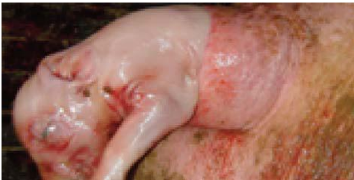
ការកើតកូនជ្រូក១ត្រូវតែមាន រយៈពេលតិចជាង ១ នាទី