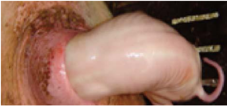
ត្រូវជួយទាញចេញឱ្យលឿន ព្រោះកូនជ្រូកមិនអាចដកដង្ហើមរួច