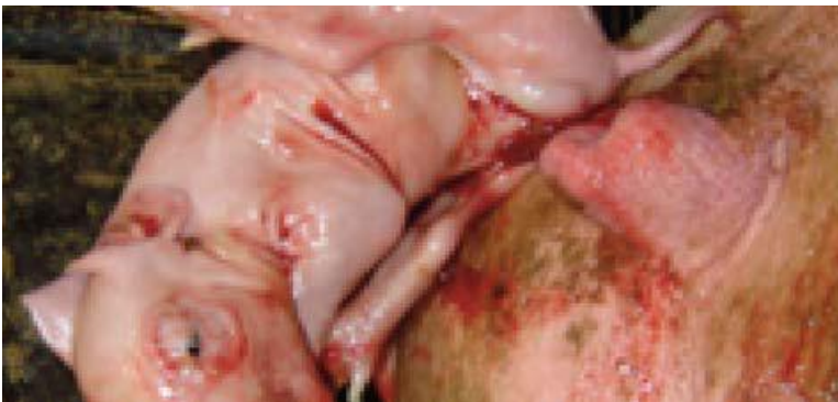
កូនកើតរួច