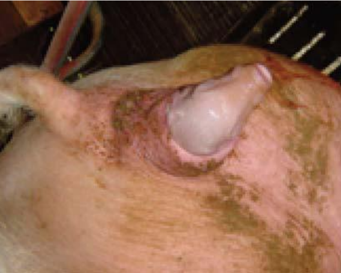
ភ្លាមៗបន្ទាប់ពីសាច់ដុំកន្ត្រាក់ កូនជ្រូកទី ១ត្រូវកើតចេញមក