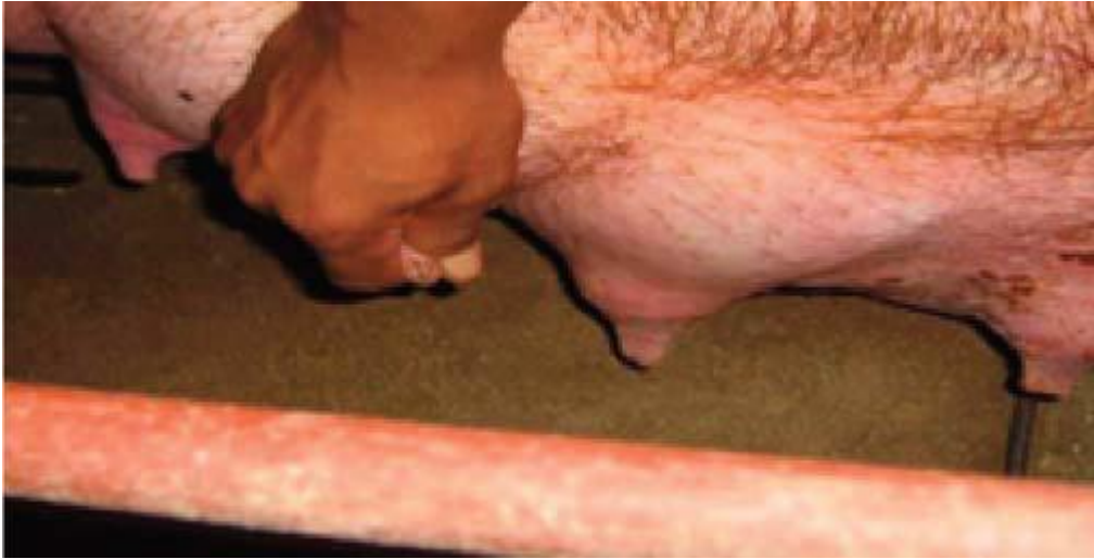
កន្សោមដោះ និងគ្មានទឹកដោះ ដែលកើតមាន ក្រោយពីកើតកូន រួច គឺ ជាជំងឺ (លាសដោះ អត់ទឹកដោះ និង រលាកស្បូន)

ធានាឱ្យមានទឹកដោះដំបូង (Colostrum) និងទឹកដោះសំរាប់បៅ ការមានទឹកដោះដំបូង គឺមានសារៈសំខាន់ណាស់ ក្នុងការ ជួយកូនជ្រូកតែជួនកាលបន្ទាប់ពីកើតរួច មេជ្រូកខ្លះមិនអាចផលិតទឹកដោះដោយសារមានបញ្ហាគ្រុនក្តៅមិនស៊ីចំណី ហើយ កន្សោមដោះឡើងវិញ ។ បញ្ហានេះគឺជាបញ្ហាលាសដោះអត់ទឹកដោះ និងរលាកស្បូន (MMA) ។