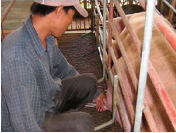
៨-១០ ម៉ោង មុនកើត ទឹកដោះចាប់ផ្តើមចេញនៅពេលដែលគេប្របាច់