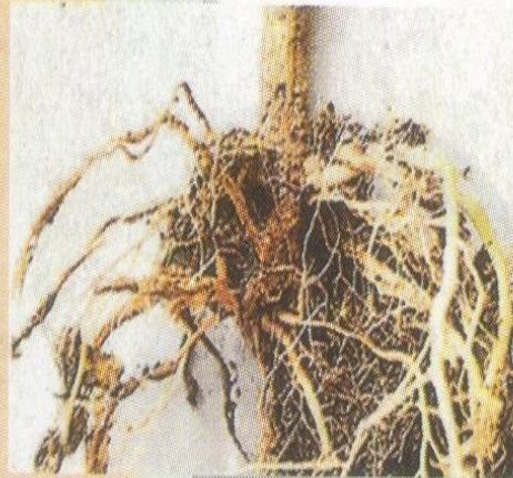
Maladie de la pourriture des racines