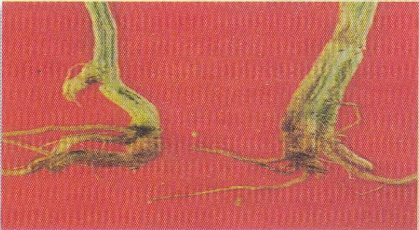
Dépérissement du concombre