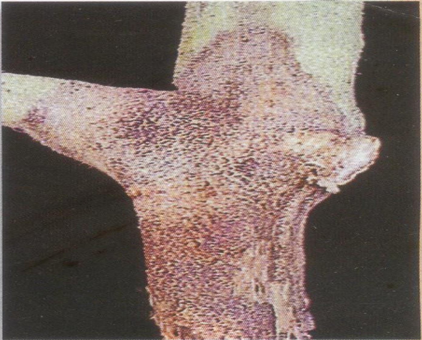
Chancre à Didymella