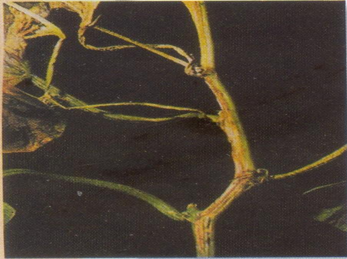
Fusariose du melon : nécrose de la tige

- ជម្ងឺស្លូតស្លាក ឫស និងដើម Fusarium wilt