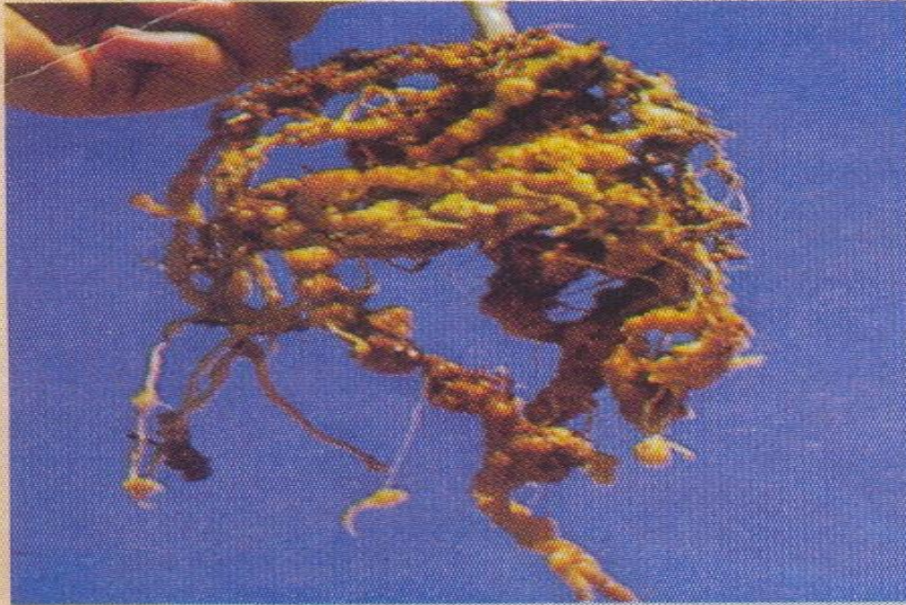
Meloidogyne : galles sur racines de melon

- ជម្ងឺពកបួសណេម៉ាតូតនេះបណ្តាលមកពីមេរោគឈ្មោះ Meloidogyne spp