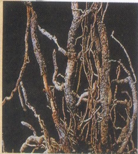
Maladie des racines liégeuses