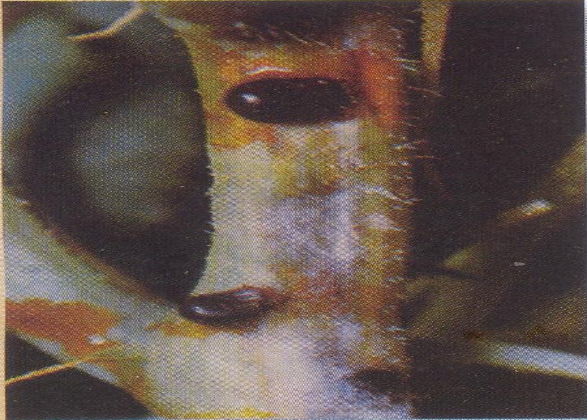
Fusariose sur tige de melon : gouttes de gomme

- ជម្ងឺផ្សិតលើដើម និងស្លឹក: ជម្ងឺនេះច្រើនកើតនៅចុងរដូវវស្សា