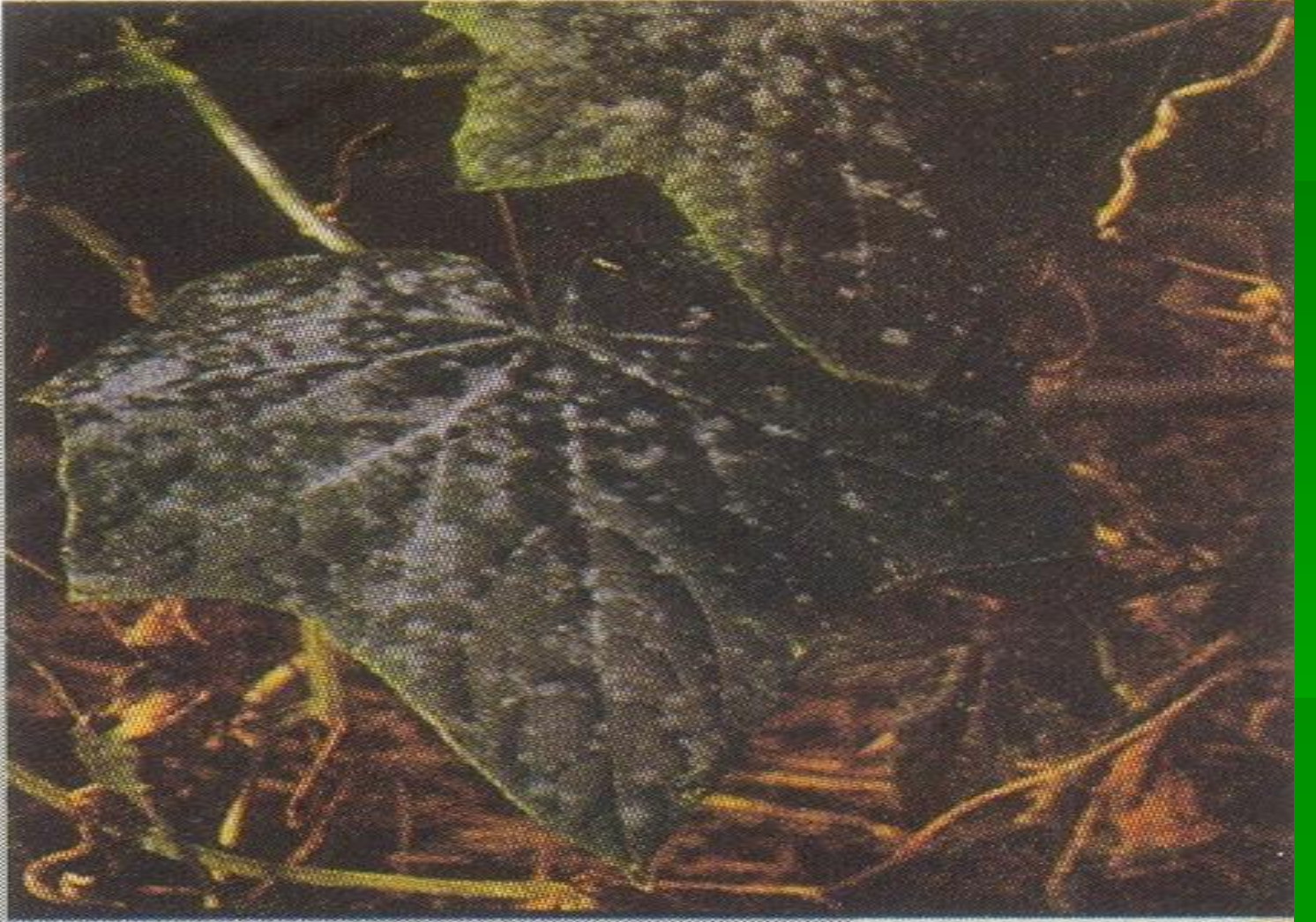
Oidium : taches sur feuilles