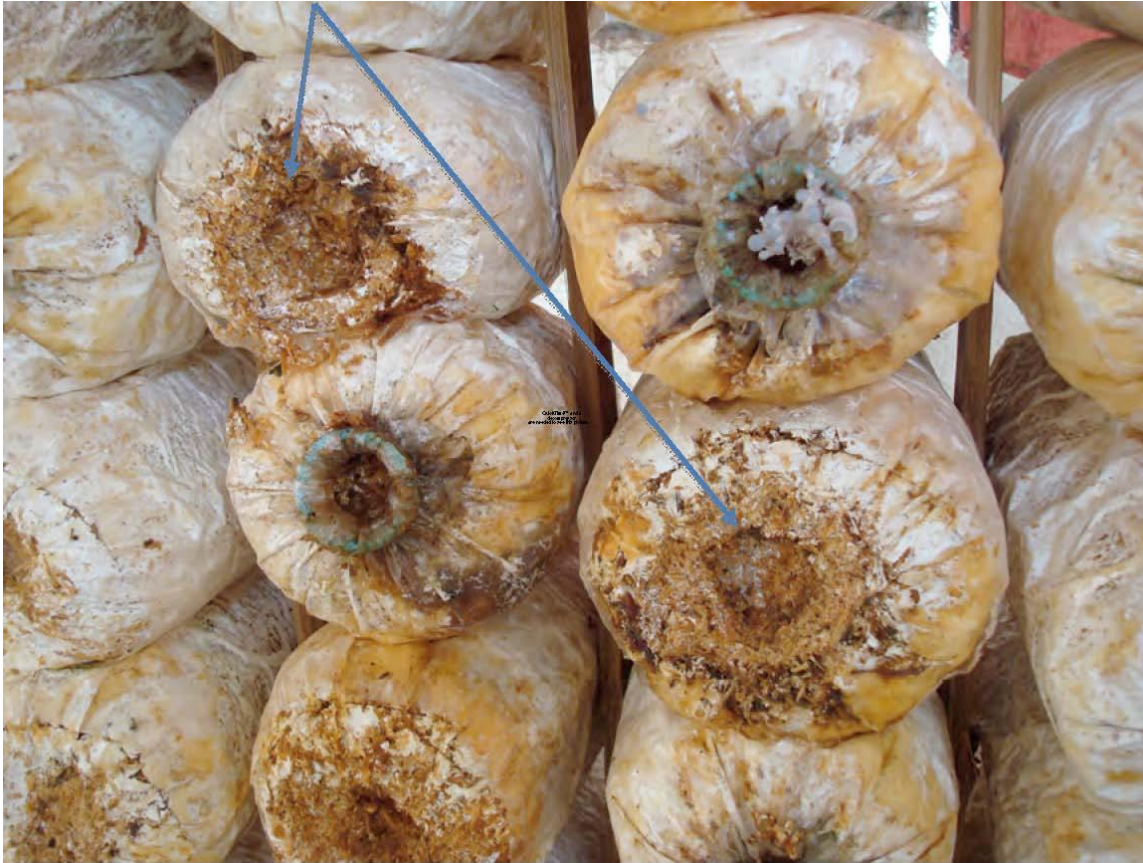
ការកាត់មាត់មាត់មាត់កញ្ចប់ផ្សិតនឹងផ្តល់ផលរយៈពេលខ្លី ផលតិច ។