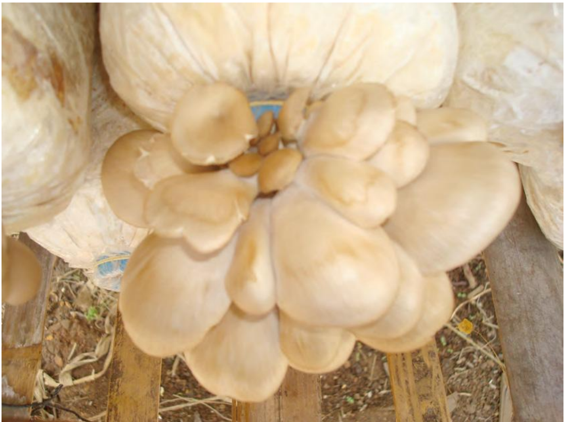
ផ្សិតឡើងពណ៌លឿង ស្លុត ផ្នែកខាងលើ បណ្តាលមកពីខ្វះសំណើម ។