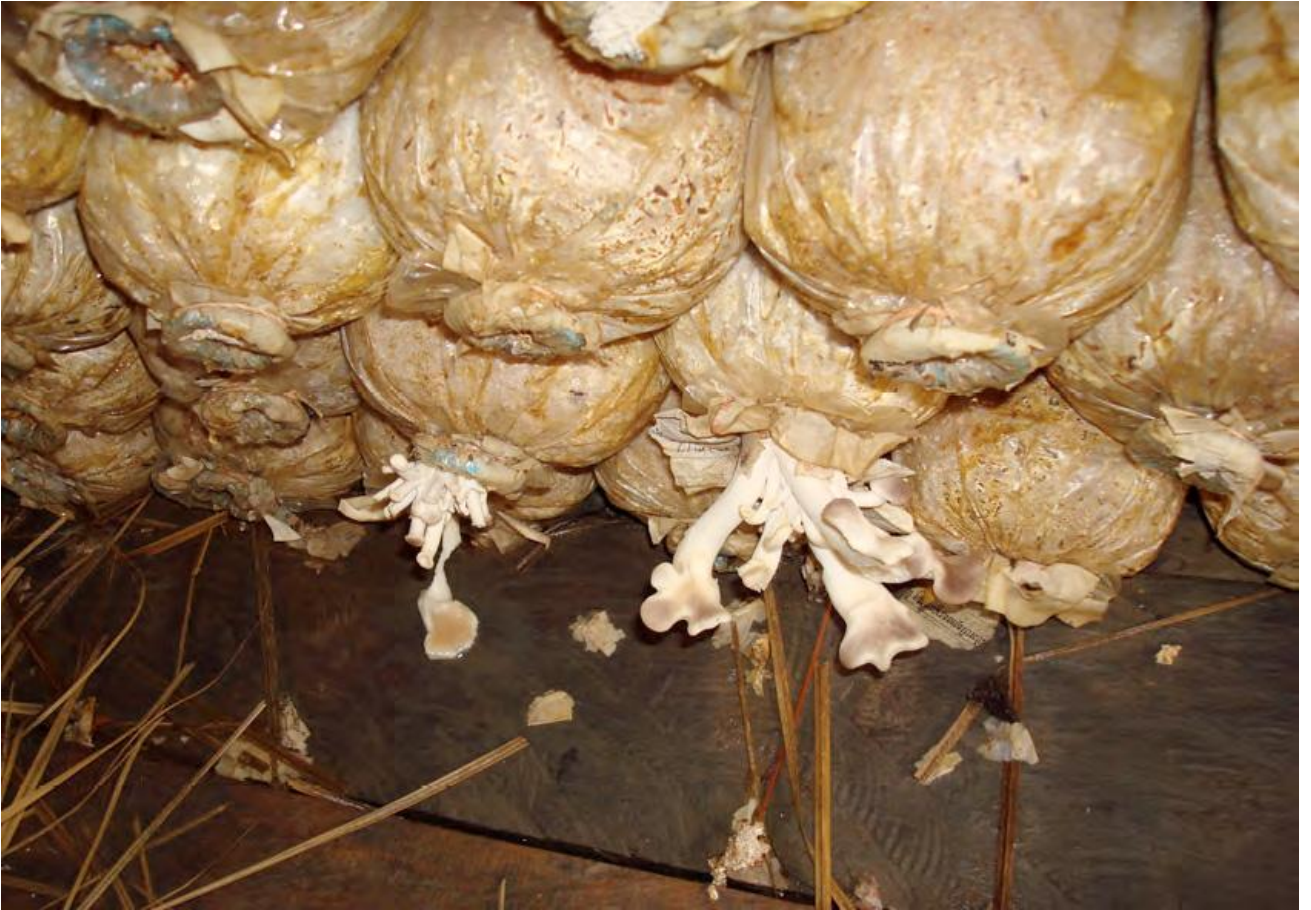
ផ្សិតដុះមិនល្អ ដោយសារប្រើទឹកក្រខ្វក់ស្រោច និងខ្វះអនាម័យ ។