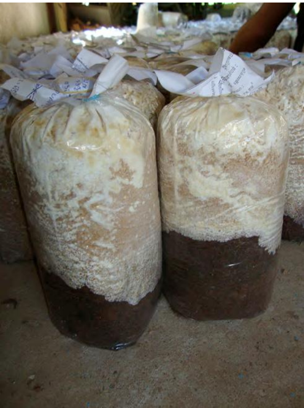
ស្តុំផ្សិតដុះខ្សោយបណ្តាលមក ពី កំហុសឆ្គងពេលផលិតមេ