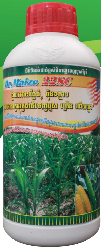
Dr. Maize 22 SC