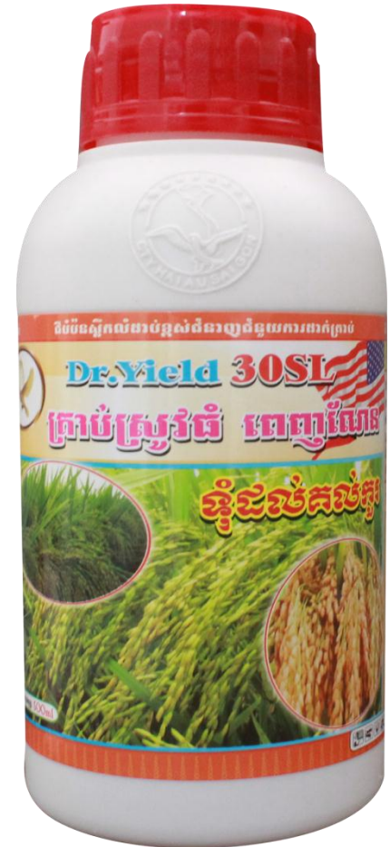
Dr. Yield 30SL