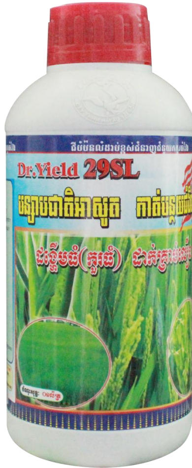
Dr. Yield 29SL