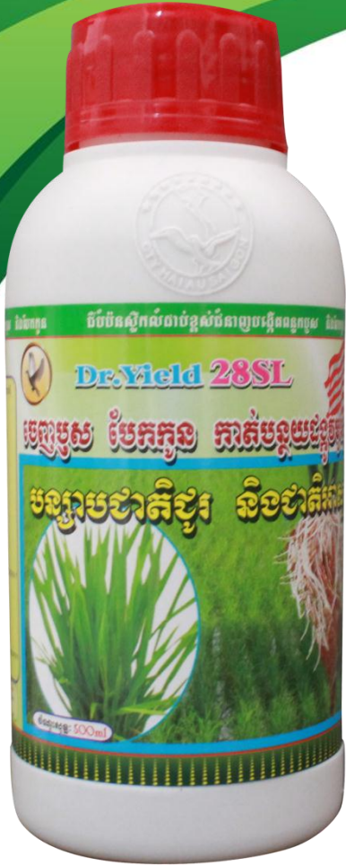
Dr. Yield 28SL