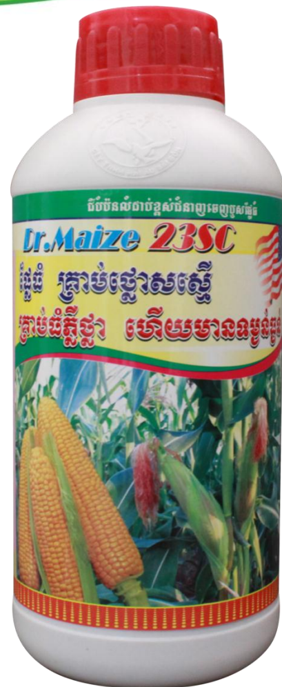
Dr. Maize 23 SC