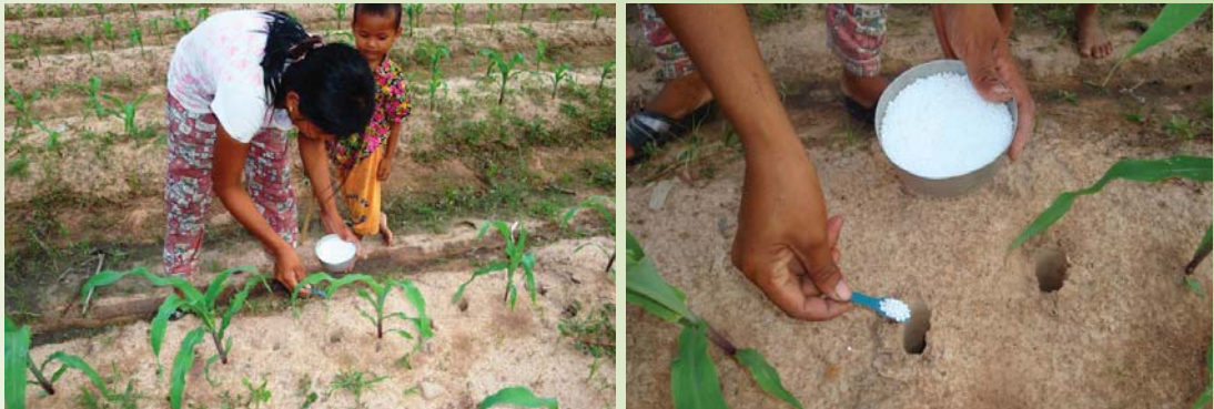
១ កូនស្លាបព្រាជីវ មានទំងន់ប្រហែល ១,៥ ក្រាម

នៅចន្លោះនៃការដាក់ជី កសិករចាំបាច់ត្រូវបាញ់ជីទឹកបំប៉ន យ៉ាងហោចណាស់ នៅថ្ងៃទី ១៣ ឬ ទី១៤ និង ថ្ងៃទី៣៥ ឬ ៣៧ បន្ទាប់ពីដាក់ដាំ។