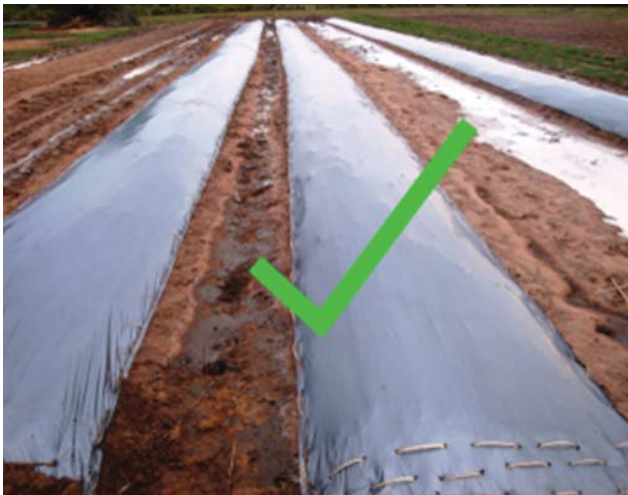
ការគ្របក្នុងរូបភាពបែបនេះជាការត្រឹមត្រូវ