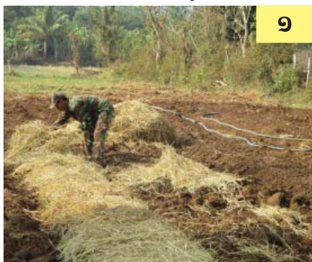
គ្របចំបើងកម្រាស់ពី ០,៦ តិក ទៅ ១ តិក (៦ សង្កីម៉ែត្រ ទៅ ១០ សង្កីម៉ែត្រ)