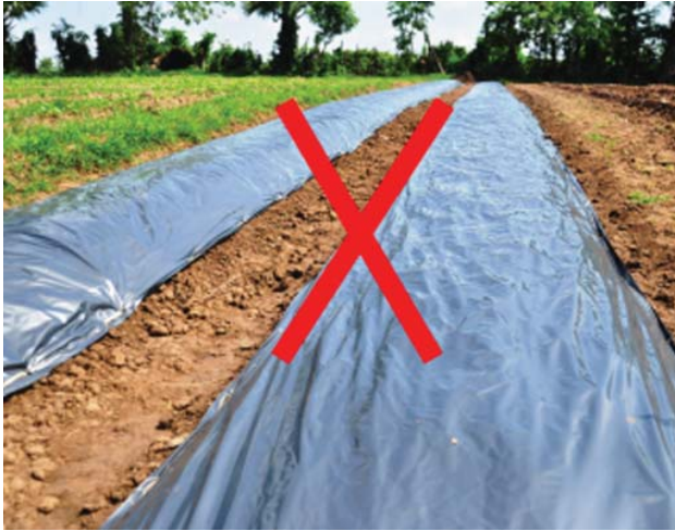
ការគ្របក្នុងរូបភាពបែបនេះគឺមិនត្រឹមត្រូវទេ