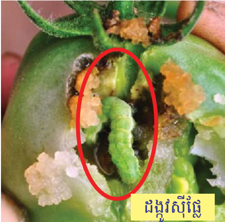
ដង្កូវស៊ីផ្លែ

(chlorpyrifos+ cypermethrin) ថ្នាំឡាំដាស៊ីហាឡូហ្ស៊ីន (Lambda cythalothrin) ថ្នាំហ្វីប្រូនីល (fipronil) ថ្នាំបាក់តេរីយ៉ូសស្យូរីនជៀនស៊ីស (Bacillusthuringiensis) ។