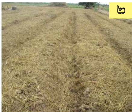
គ្របចំបើងត្រៀមដាំកូនប៉េងប៉ោះ