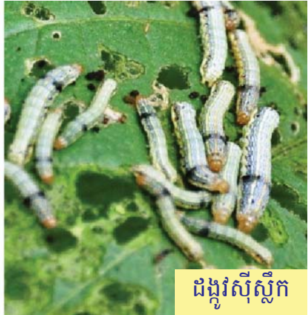
ដង្កូវស៊ីស្លឹក