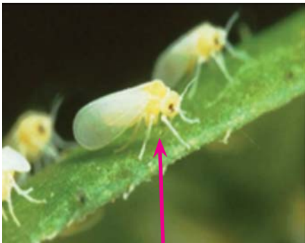
មេរុយសពេញវ័យ

រុយសជាអ្នកចម្លងជំងឺ ដែលបានជញ្ជក់យកពីដើមដំណាំមុនៗរួចហើយវានឹង ធ្វើរមេរោគ ( វីរុស ) ទៅឱ្យដើមដំណាំបន្ទាប់នៅពេលវាជញ្ជក់។ ការជញ្ជក់នេះហើយ ធ្វើឱ្យជំងឺឆ្លងពីដើមប៉េងប៉ោះមួយ ទៅដើមប៉េងប៉ោះមួយទៀតពាសពេញចម្ការ។