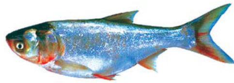
ត្រីកាបស