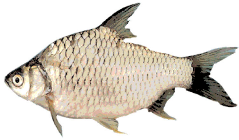
ត្រីឆ្អិន

ការថែបំប៉នកូនត្រីក្នុងស្រះ ត្រូវបំប៉នជាពីរដំណាក់កាលផ្សេងៗគ្នាគឺ : ដំណាក់កាលថែបំប៉នកូនត្រីម្សៅ និងដំណាក់កាលថែបំប៉នកូនត្រីពូជ។ សម្រាប់កសិករ មានដើមទុនតិច គួរជ្រើសរើសប្រភេទត្រីទាំងឡាយណាដែលស៊ីចំណីធម្មជាតិមានស្រាប់នៅក្នុងស្រះជាអាហារសំខាន់ និងចំណីបន្ថែមអាចរកបាន ឬមានស្រាប់នៅ តាមមូលដ្ឋាន ភូមិ ឃុំ របស់ខ្លួន ដូចជា កន្ទក់ ចុងអង្ករ ជន្លួន កណ្តៀវ ចកបាយទា កាកសំណល់បន្លែ ឬ ផ្ទះបាយជាដើម...។ល។ ប្រភេទត្រីទាំងនោះរួមមានដូចជា : ត្រីឆ្អិន ត្រីកន្ទរ ត្រីទីឡាព្យ៉ា ត្រីកាបសាមញ្ញ ត្រីកាបស និងត្រីកាបឥណ្ឌា (ដូចរូបភាពខាងក្រោម) ។