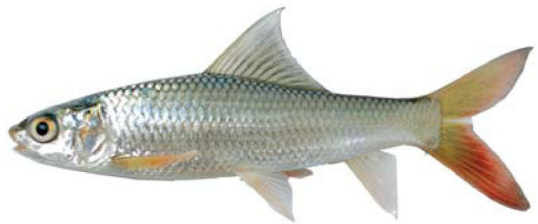
ត្រីកាបឥណ្ឌា (ម្រីហ្គាល់)