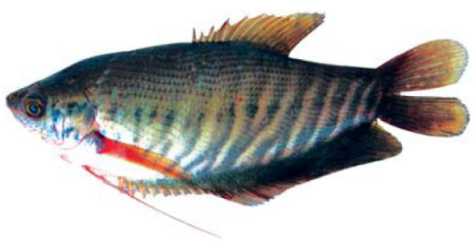
ត្រីកន្ទរ