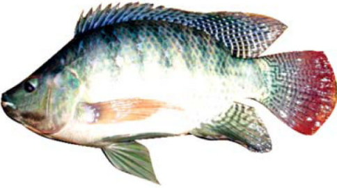
ត្រីទីឡាព្យ៉ា