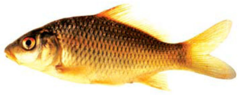
ត្រីកាបសាមញ្ញ