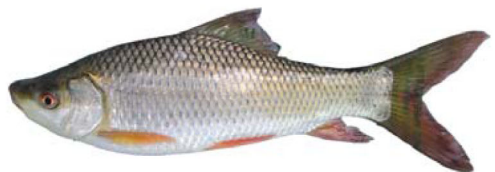
ត្រីកាបឥណ្ឌា (រ៉ូហ្គី)