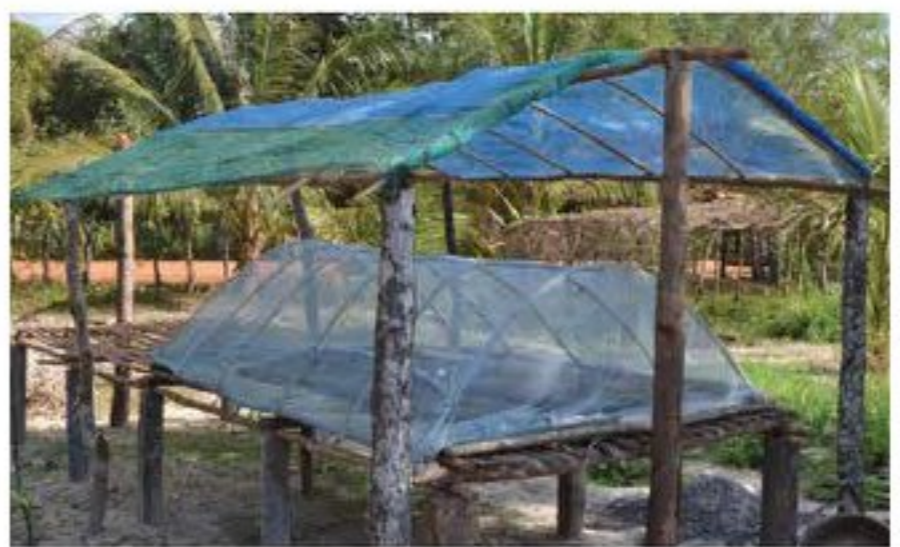
រានបណ្តុះកូនបន្លែសម្រាប់រដូវប្រាំង