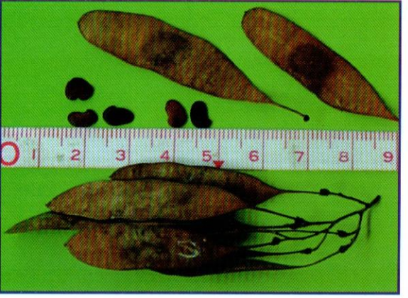
៥- រដូវចេញផ្កា ផ្លែ

-គ្រាប់: គ្រាប់សំប៉ែតមានពណ៌ប្រផេះ ឬត្នោត ហើយមានទំហំ ៤មx៧ម.ម។ ក្នុងមួយគីឡូក្រាមមានប្រហែល ៣៥ ០០០គ្រាប់។