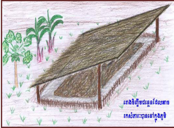
រោងចិញ្ចឹមជន្លេនដែលអាចរកសំរាប់ប្រើនៅក្នុងកូឌី