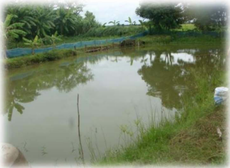
ស្រែចាស់