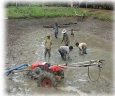
សកម្មភាពស្តារភក់បាតស្រែ