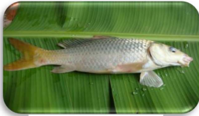
ត្រីកាបសាមញ្ញ