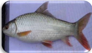
ត្រីកាបតណ្ហា