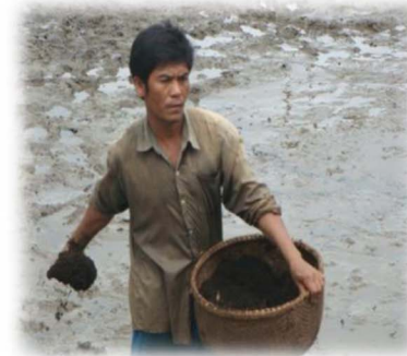
សកម្មភាពបាចជីលាមកគោទ្រាប់បាតស្រែដើម្បីបង្កើតចំណីធម្មជាតិ