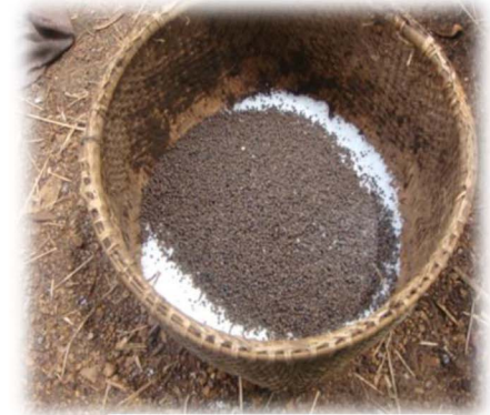
ល្បាយជី អ៊ុយរ៉េ និង ដេអាប៉េ