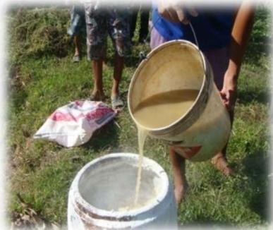
សកម្មភាពលាយកំបោរសំលាប់ត្រីកាច និងពពួកសត្វចង្រៃក្នុងស្រែ