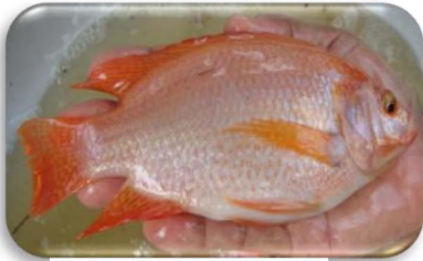
ត្រីទីឡាព្យាក្រហម