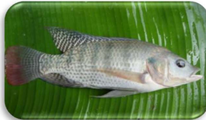
ត្រីទីឡាព្យា