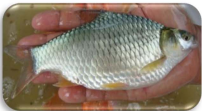
ត្រីទីឡាព្យា