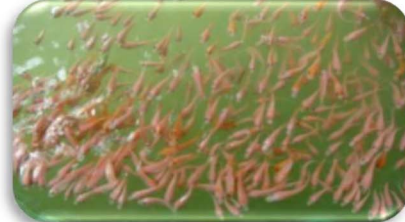
ពូជត្រីទីឡាព្យាក្រហមល្អ