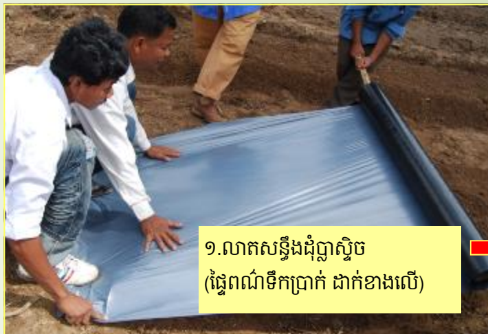
១.លាតសន្ធឹងជុំប្លាស្ទិច (ផ្ទៃពណ៌ទឹកប្រាក់ ដាក់ខាងលើ)