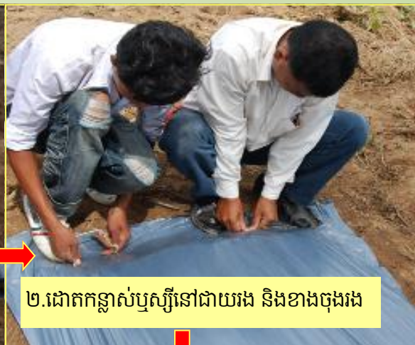
២.ដោតកន្ត្រាសំបូស្សីនៅជាយរង និងខាងចុងរង