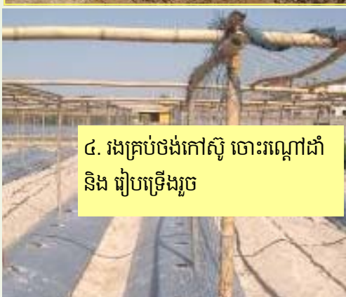
៤. រងគ្រប់ចងកៅស៊ូ ចោះរណ្តៅដាំ និង រៀបច្រើងរួច