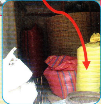
ការទុកដាក់ស្រូវក្នុងតាម រួចដាក់ក្បែរសរសរក្នុងផ្ទះ