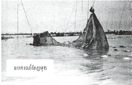
ឧបករណ៍ស្បែក