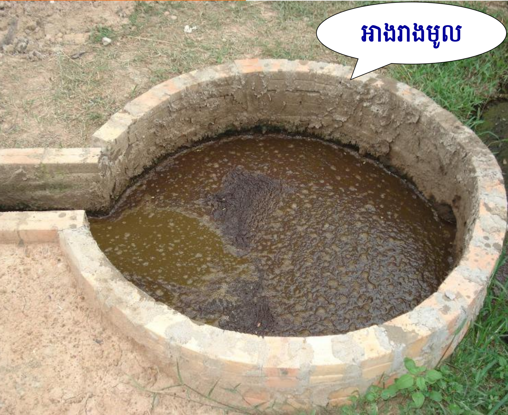
អាងរាងមូល