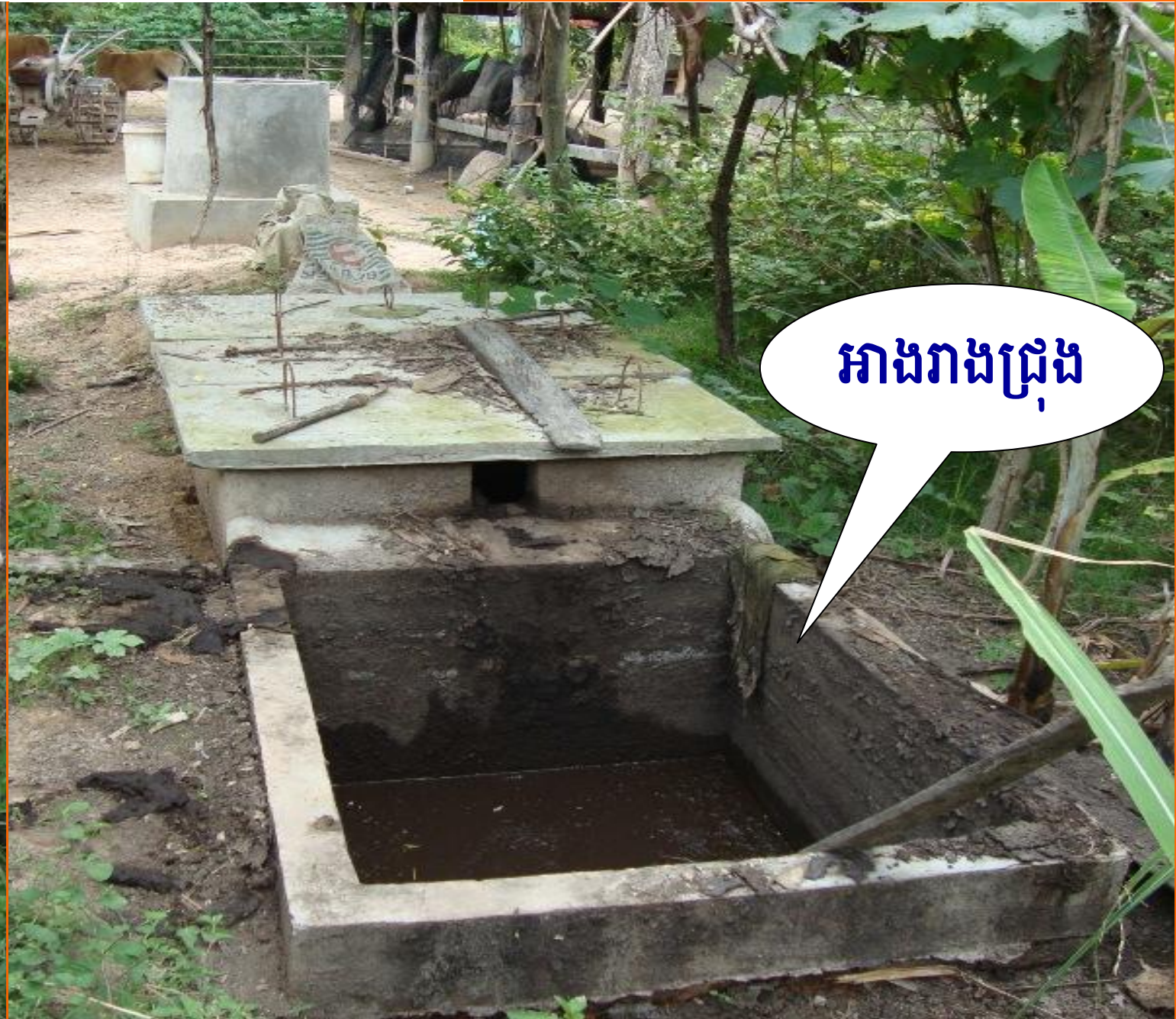
អាងរាងជ្រុង