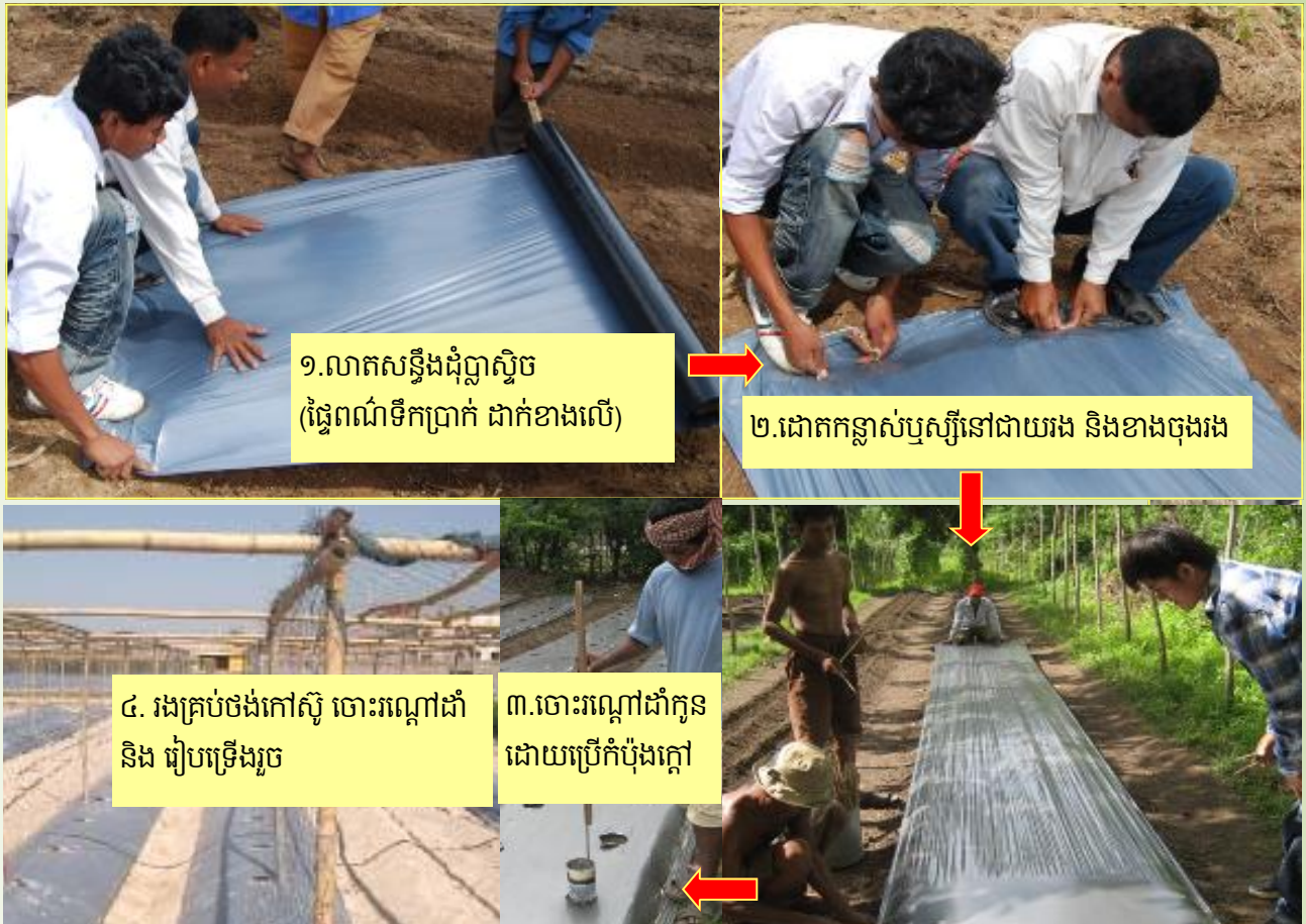
១.លាតសន្ធឹងដុំប្លាស្ទិច (ផ្ទៃពណ៌ទឹកប្រាក់ ដាក់ខាងលើ)