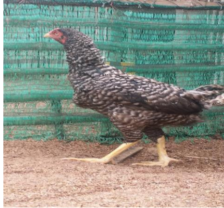
មាន់ស្នូយ