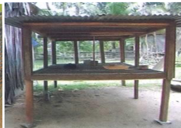
ទ្រុងកូនមាន់