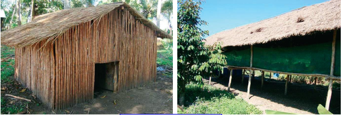
ទ្រុងមាន់សាច់