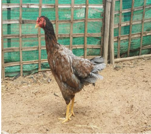
មាន់សំពៅ

ពូជនេះធន់អាកាសធាតុមិនសូវងាយស្រួលចិញ្ចឹម។