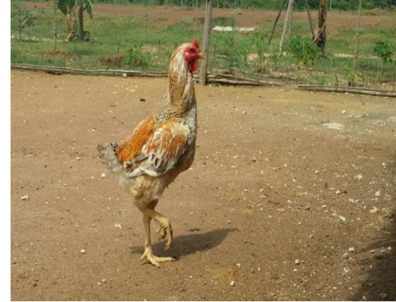
មាន់កណ្តុង