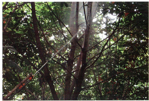
ឧបករណ៍ព្យាបាលជំងឺផ្កាកូលាប

កៅស៊ូមិនទាន់ចៀរដើរ ដែលត្រូវបាញ់ប្រវែង ៣០-៥០ស.ម ផ្នែកខាងលើនិងខាងក្រោមកន្លែងដែលកើតជំងឺ។ ថ្នាំនេះហាមប្រើចំពោះដើមកៅស៊ូកំពុងចៀរដើរ ព្រោះវាអាចធ្វើឲ្យប៉ះពាល់ដល់គុណភាពទឹកដី។ - ទ្រីដីម៉ូហ្វ (Tridemorph) នៅកំហាប់ 1% - វ៉ាលីដាមីស៊ីន (Validamycin) នៅកំហាប់ 1.5% - 2%។