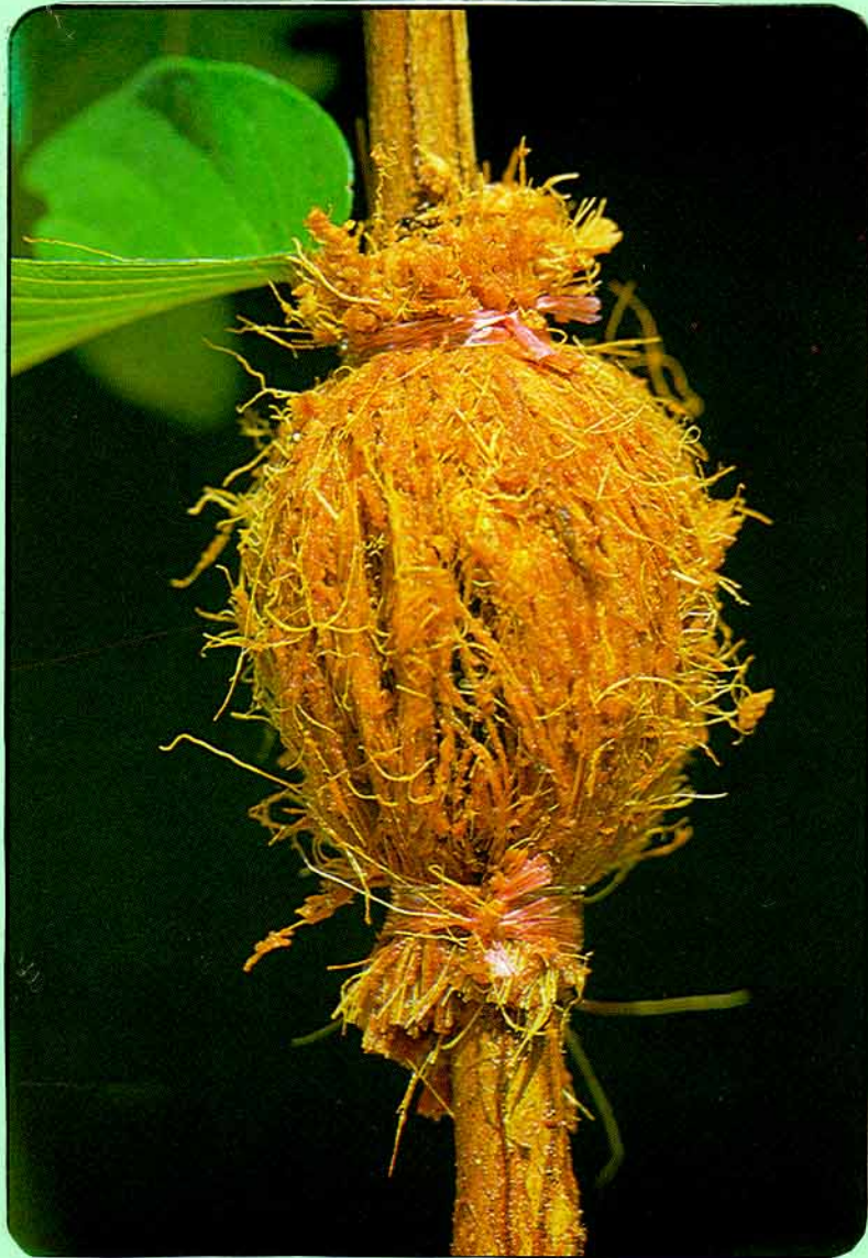
ជំងឺរាងទឹកបិះ យកស្រក់ដូងដែលបានត្រាំទឹកមុន ២-៣ថ្ងៃ ហ៊ុមជុំវិញដើម្បីយកចងអោយណែន ។