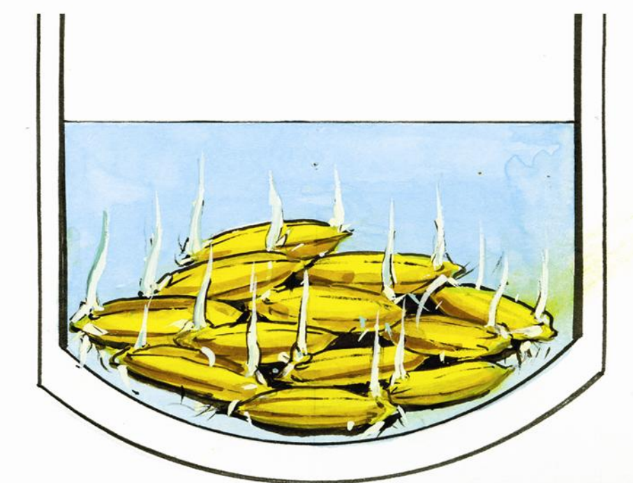
ត្រាប់ពូជមិនល្អ ដុះមិនល្អ