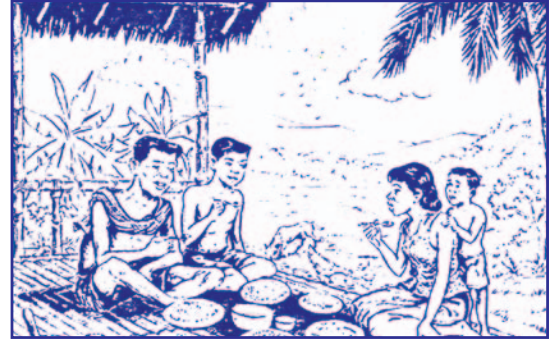
ជីវភាពគ្រួសារមុនពេលចិញ្ចឹមត្រី