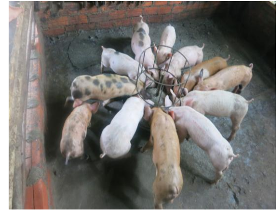
ពូជកូនកាត់