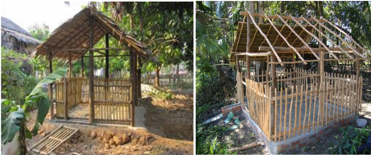
ការសាងសង់ទ្រុង