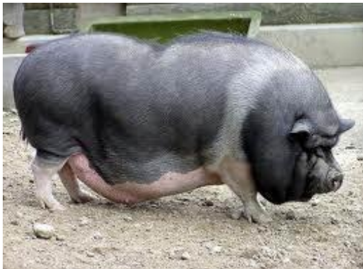
ពូជខ្យក់