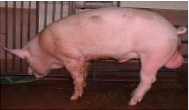
ពូជឡាយវ៉ាយ