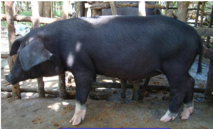
ពូជជ្រូកកណ្តុរកូនកាត់