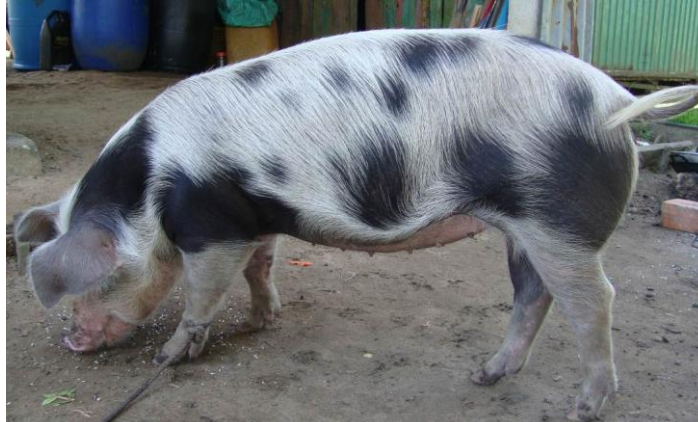
ពូជជ្រូកកូនកាត់