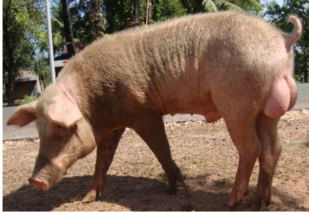
បាកូនកាត់ក្នុងស្រុក