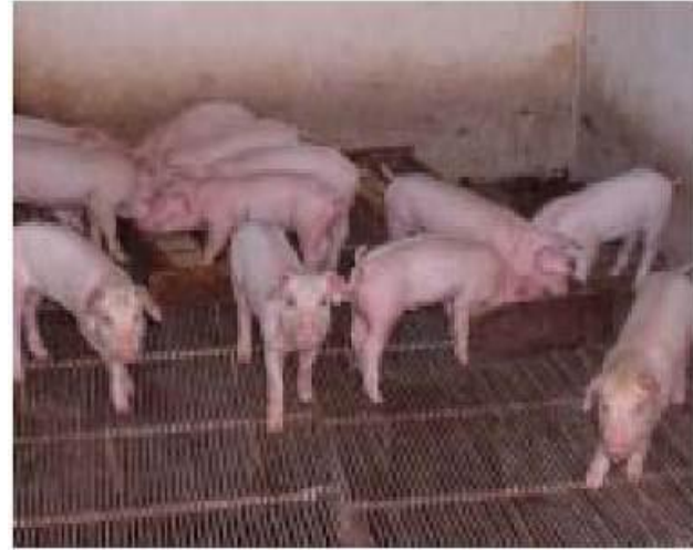
កូនជ្រូកពូជ ក្រុមហ៊ុន