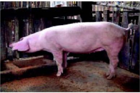
ពូជឡេនជ្រេស