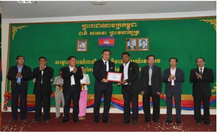
រូបភាព: រដ្ឋមន្ត្រីពាណិជ្ជកម្មអញ្ជើញបើកពិព័រណ៍ពាណិជ្ជកម្ម និងទេសចរណ៍ខេត្តកែប