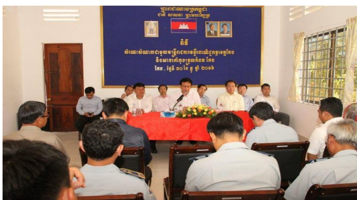
រូបភាព: រដ្ឋមន្ត្រីពាណិជ្ជកម្ម គ្រោងបង្កើតម៉ាកសម្គាល់ភូមិសាស្ត្រផ្កាអំបិល

សូមបញ្ជាក់ថា ពិព័រណ៍ពាណិជ្ជកម្ម និងទេសចរណ៍ខេត្តកែប នឹងប្រារព្ធឡើងក្នុងរយៈពេលបីថ្ងៃគឺចាប់ពីថ្ងៃ២៩ ដល់ថ្ងៃទី៣១ខែធ្នូឆ្នាំ២០១៦នៅក្នុងបរិវេណសាលាខេត្តកែប។ ពិព័រណ៍នេះ មានការដាក់តាំងបង្ហាញនូវផលិតផលក្នុងស្រុក និង ទំនិញនាំចូលពីប្រទេសថៃសរុបចំនួន ៨០ស្តង់ និងមានការប្រគំតន្ត្រីក្នុងពេលរាត្រីដែលចូលរួមសម្តែងដោយ សិល្បករ និងសិល្បការនីល្បីៗ របស់កម្ពុជាផងដែរ ។