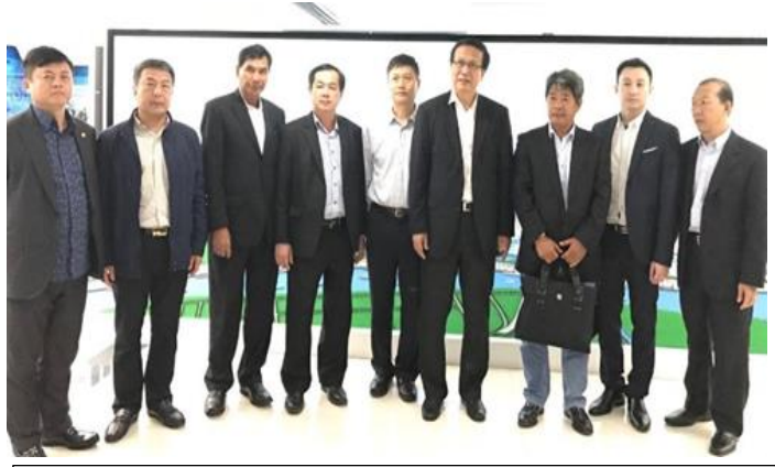
រូបភាពភាគីចិនបានទទួលរដ្ឋមន្ត្រីពាណិជ្ជកម្ម ប្រតិភូអមដំណើរ ខេត្តក្រចេះ

គួររំលឹកដែរថា ការដាក់ម្រេចជាផលិតផលសម្គាល់ ភូមិសាស្ត្រសម្រាប់ខេត្តកំពត បានប្រើរយៈពេលប្រមាណជាង ៥ ឆ្នាំ និងថវិកាប្រមាណ ១លានអឺរ៉ូ។ បច្ចុប្បន្នម្រេចកំពតត្រូវបាន ទទួលស្គាល់យ៉ាងទូលំទូលាយ ពីសហគមន៍អឺរ៉ុប និងប្រទេស ផ្សេងៗ ជាច្រើនក្នុងពិភពលោក ដែលជាមោទនភាពសម្រាប់ ក្រសួងពាណិជ្ជកម្ម និងដៃគូអភិវឌ្ឍន៍អន្តរជាតិ ជាពិសេស ទីភ្នាក់ងារអភិវឌ្ឍន៍បារាំង (AFD) ។