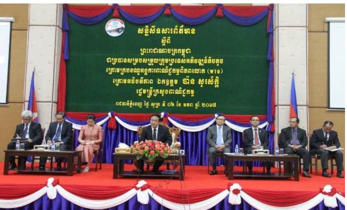
រដ្ឋមន្ត្រីពាណិជ្ជកម្មកំណើនពាណិជ្ជកម្ម សេដ្ឋកិច្ច ជួយឱ្យកម្ពុជាក្លាយជាប្រធាន

គួររំលឹកដែរថា តាមរយៈដំណើរទស្សនកិច្ច របស់ប្រធានាធិបតីចិន មកកម្ពុជាកាលពីឆ្នាំមុនរដ្ឋាភិបាល នៃប្រទេសទាំងពីរបានចុះហត្ថលេខា លើអនុស្សរណៈយោគយល់ចំនួនពីរ ។ អនុស្សរណៈទី១ គ្របដណ្តប់លើការប្តេជ្ញាចិត្តរបស់ចិន ក្នុងការទិញអង្ករកម្ពុជាចំនួន២សែនតោន សម្រាប់ឆ្នាំ២០១៥ និង២០១៦ហើយអនុស្សរណៈទី២ គ្របដណ្តប់លើភាពអនុគ្រោះពន្ធគយចំនួន ៩៧%សម្រាប់ទំនិញកសិកម្មកម្ពុជាចំនួន ១ម៉ឺនប្រភេទ ដែលត្រូវនាំចេញទៅកាន់ប្រទេសចិន។