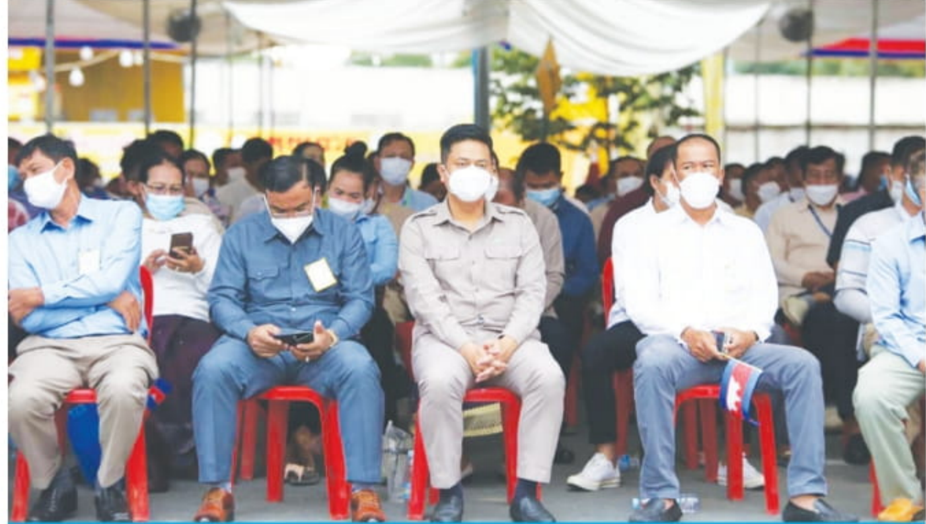
ប្រជាពលរដ្ឋ មន្ត្រីរាជការ អញ្ជើញចូលរួម

សម្តេចតេជោ ហ៊ុន សែន បានបង្ហាញនូវក្តីរីករាយអញ្ជើញបើកការដ្ឋានសាងសង់ស្ថានអាកាសចំនួនពីរបន្ថែមទៀតក្នុងទីក្រុងភ្នំពេញដោយមានប្រសាសន៍លើកថា កាលពីទសវត្សរ៍៨០ និង៩០ តម្រូវការរបស់ប្រជាពលរដ្ឋខ្ពស់យូរពីពេលបច្ចុប្បន្ន ដែលពីមុនតម្រូវការខ្ពស់បំផុត គឺត្រឹមជាស្បៀងអាហារតែប៉ុណ្ណោះ ក៏ប៉ុន្តែសម្រាប់បច្ចុប្បន្ននេះវិញប្រជាពលរដ្ឋមិនមែនខ្វះស្បៀងអាហារទៀតនោះទេ គឺពួកគាត់មានតម្រូវការប្រព័ន្ធហេដ្ឋារចនាសម្ព័ន្ធសម្រាប់ធ្វើដំណើរវិញ។ ការសាងសង់ហេដ្ឋារចនាសម្ព័ន្ធ និងស្ថានអាកាសក្នុងរាជធានីភ្នំពេញ គឺជា