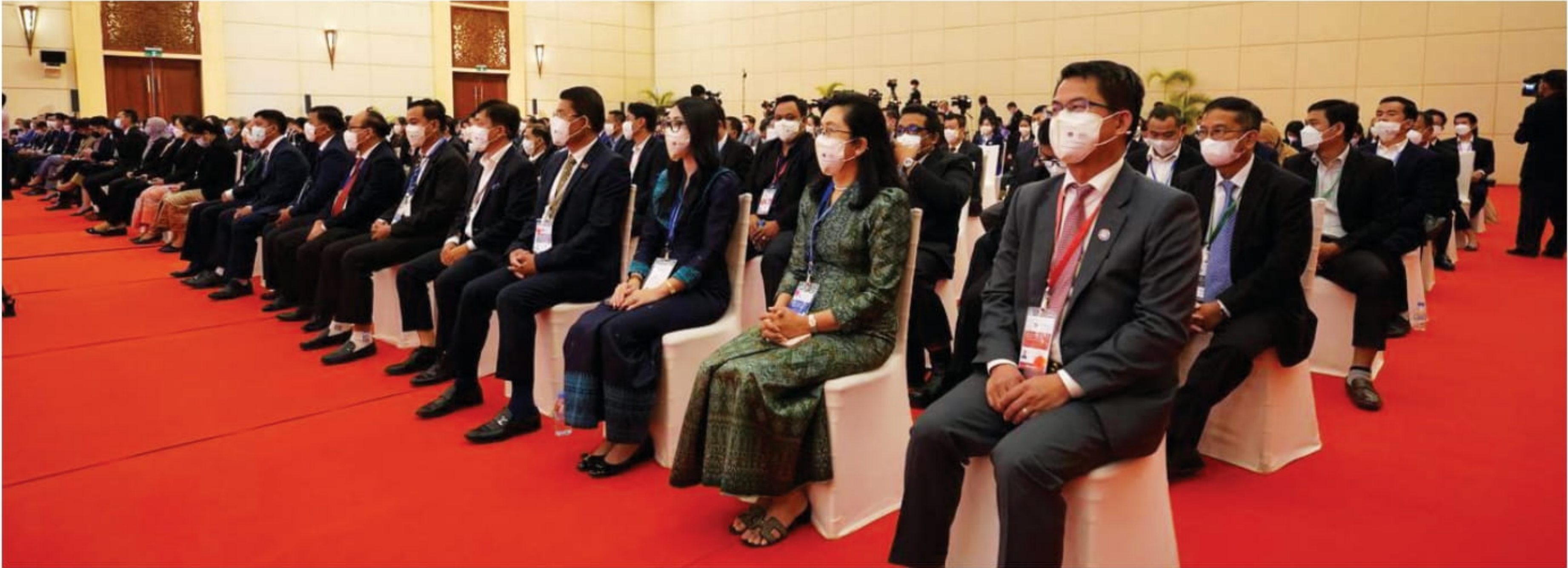
គណៈប្រតិភូភ្ញៀវកិត្តិយសជាតិ និងអន្តរជាតិ អញ្ជើញចូលរួម

ក្នុងពេលដែលពិភពលោកកំពុងប្រឈមនឹងឧបសគ្គជាច្រើន ការអភិវឌ្ឍ អាស៊ានត្រូវតែផ្តល់សារៈសំខាន់កាន់តែខ្លាំងថែមទៀតដល់ការក្សាឱ្យបាននូវប្រព័ន្ធពាណិជ្ជកម្មឈរលើ