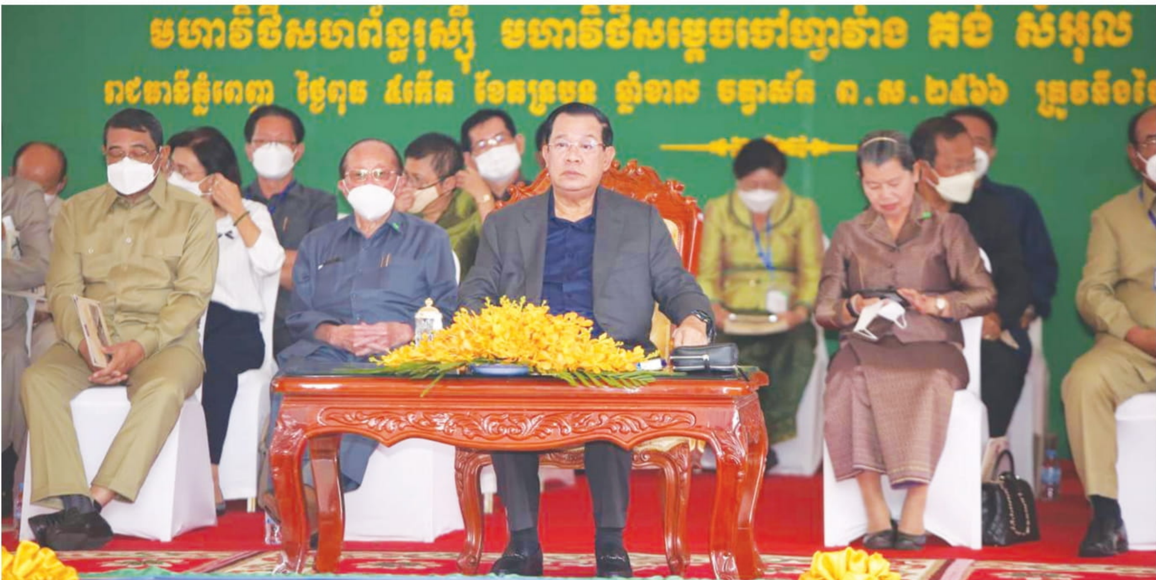
សម្តេចតេជោ ហ៊ុន សែន អញ្ជើញបើកការដ្ឋានសាងសង់ស្ថានអាកាស ក្នុងរាជធានីភ្នំពេញ