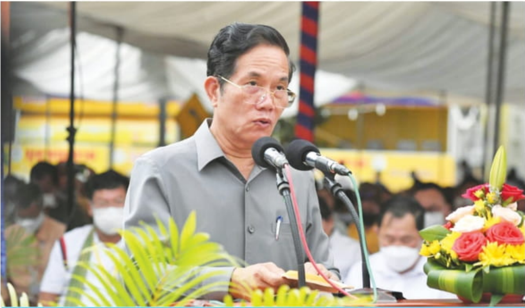
ឯកឧត្តម យូដ ស្រី អភិបាលរាជធានីភ្នំពេញ

ខេមរភូមិន្ទ (ឆ្នាំ១៩៧១) ក្នុងទឹកដីខណ្ឌចំការមន និងខណ្ឌមានជ័យ។ ទី២ ស្ថិតនៅចំណុចប្រសព្វមហាវិថីសហព័ន្ធរុស្ស៊ី ជាមួយមហាវិថីសម្តេចចៅហ្វាវ៉ាងរៀងជ័យអធិបតីស្រីង្ការ គង់ សំអុល (ឆ្នាំ១៩០៤) ក្នុងខណ្ឌពោធិ៍សែនជ័យ។ ស្ថានអាកាសទាំងពីរនេះ សាងសង់ដោយក្រុមហ៊ុនវិនិយោគទុនអាណិកជនកម្ពុជា (OCIC) ដោយចំណាយថវិកាសរុប ៤៦ ៧៧៥ ០០០ដុល្លារអាមេរិក ក្នុងនោះស្ថានអាកាសចំណុចប្រសព្វមហាវិថីសម្តេចតេជោ ហ៊ុន សែន មហាវិថី ព្រះមុនីវង្ស ជាមួយវិថីកងយោធពលខេមរភូមិន្ទ (ឆ្នាំ១៩៧១) ចំណាយថវិកា ៣៦ ៧៧៥ ០០០ដុល្លារ និងចំណាយពេលសាងសង់ ៣៦ខែ ដោយឡែកស្ថានអាកាសចំណុចប្រសព្វមហាវិថីសហព័ន្ធរុស្ស៊ី ជាមួយមហាវិថី សម្តេចចៅហ្វាវ៉ាងរៀងជ័យអធិបតីស្រីង្ការ គង់ សំអុល ចំណាយថវិកា ១០ ០០០ ០០០ ដុល្លារអាមេរិក ចំណាយពេលសាងសង់១៦ខែ។ សម្តេចតេជោបានសម្រេច