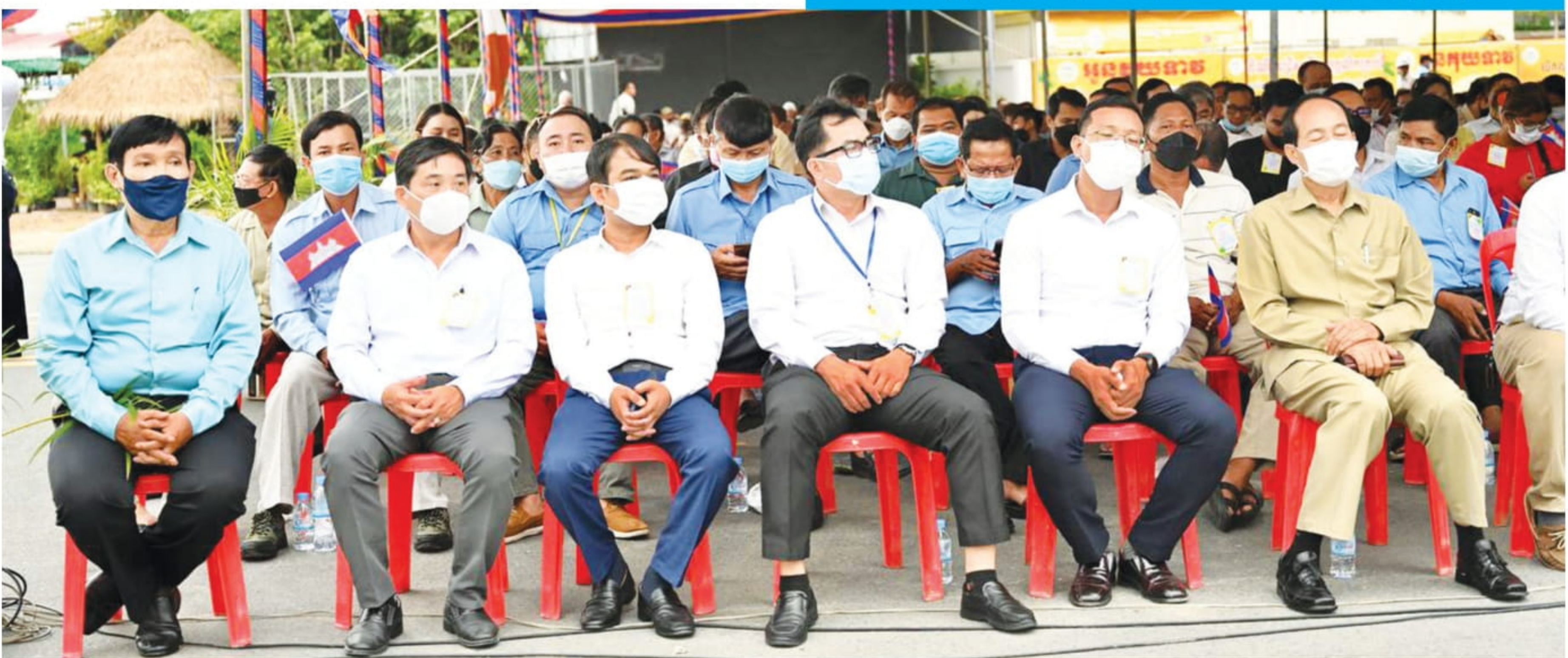
ប្រជាពលរដ្ឋ មន្ត្រីរាជការ អញ្ជើញចូលរួម