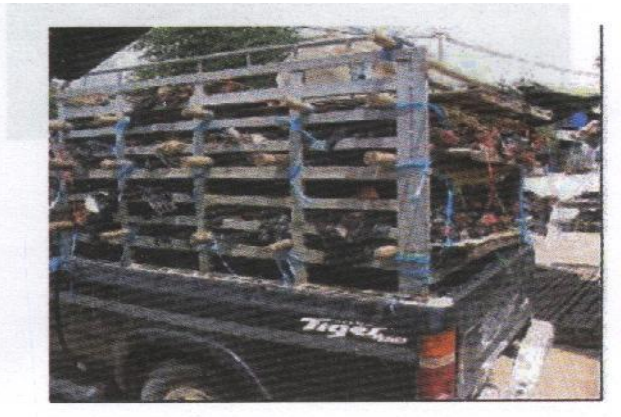
ការដឹកជញ្ជូនបក្សី និងផលិតផលពីបក្សី ដែលអាចនាំវីរុសផ្តាសសាយបក្សីពីកន្លែងមួយទៅកន្លែងមួយ