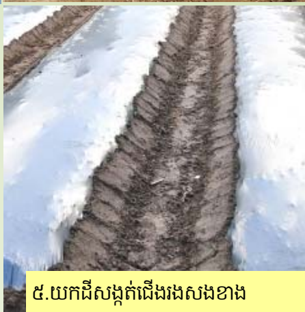
៥. យកដីសង្កត់ជើងរងសងខាង