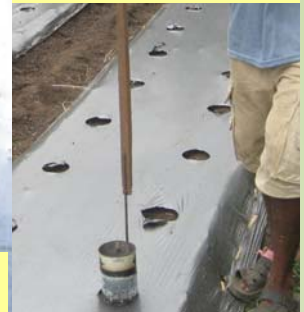
៦. ចោះរណ្តៅដាំកូនដោយប្រើកំប៉ុងក្តៅ