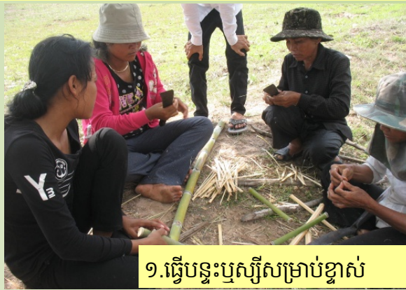
១. ធ្វើបន្ទះឫស្សីសម្រាប់ខ្នាស់