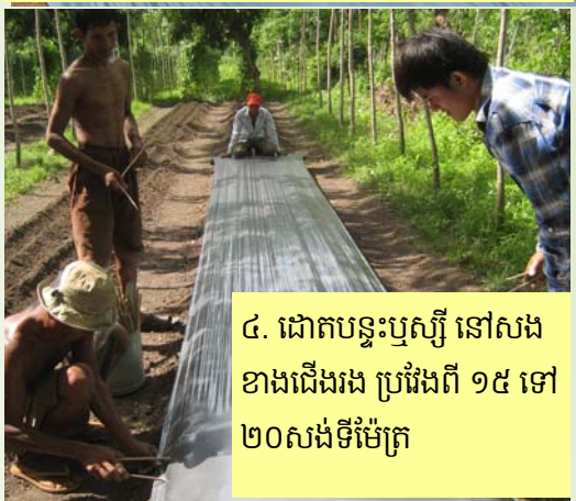
៤. ដោតបន្ទះឫស្សី នៅសងខាងជើងរង ប្រវែងពី ១៥ ទៅ ២០សង់ទីម៉ែត្រ