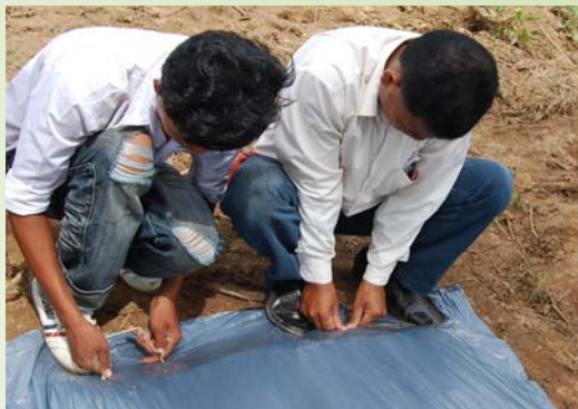
២. ដោតកន្លាស់ឫស្សីនៅជាយរង និងខាងចុងរង