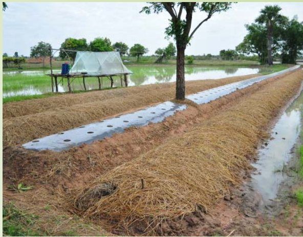
ដាក់ដីទ្រាប់បាតហ៊ុយ ស្រោចទឹក ទើបគ្របចំបើង