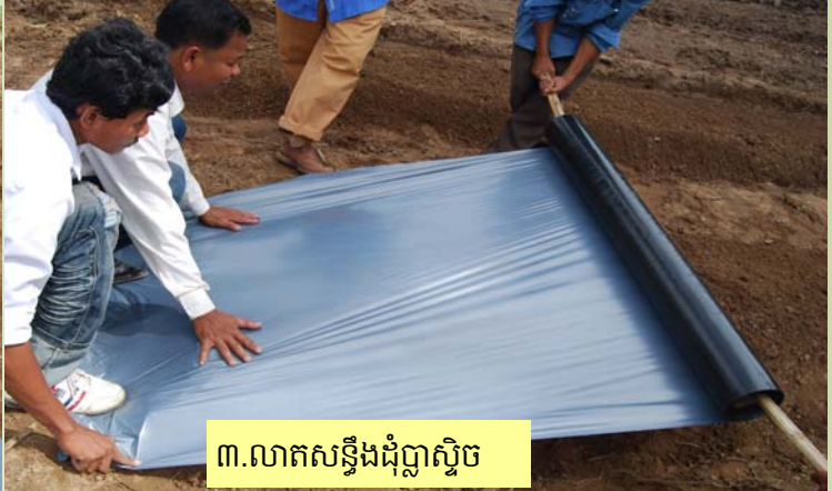
៣. លាតសន្ធឹងជុំប្លាស្ទិច