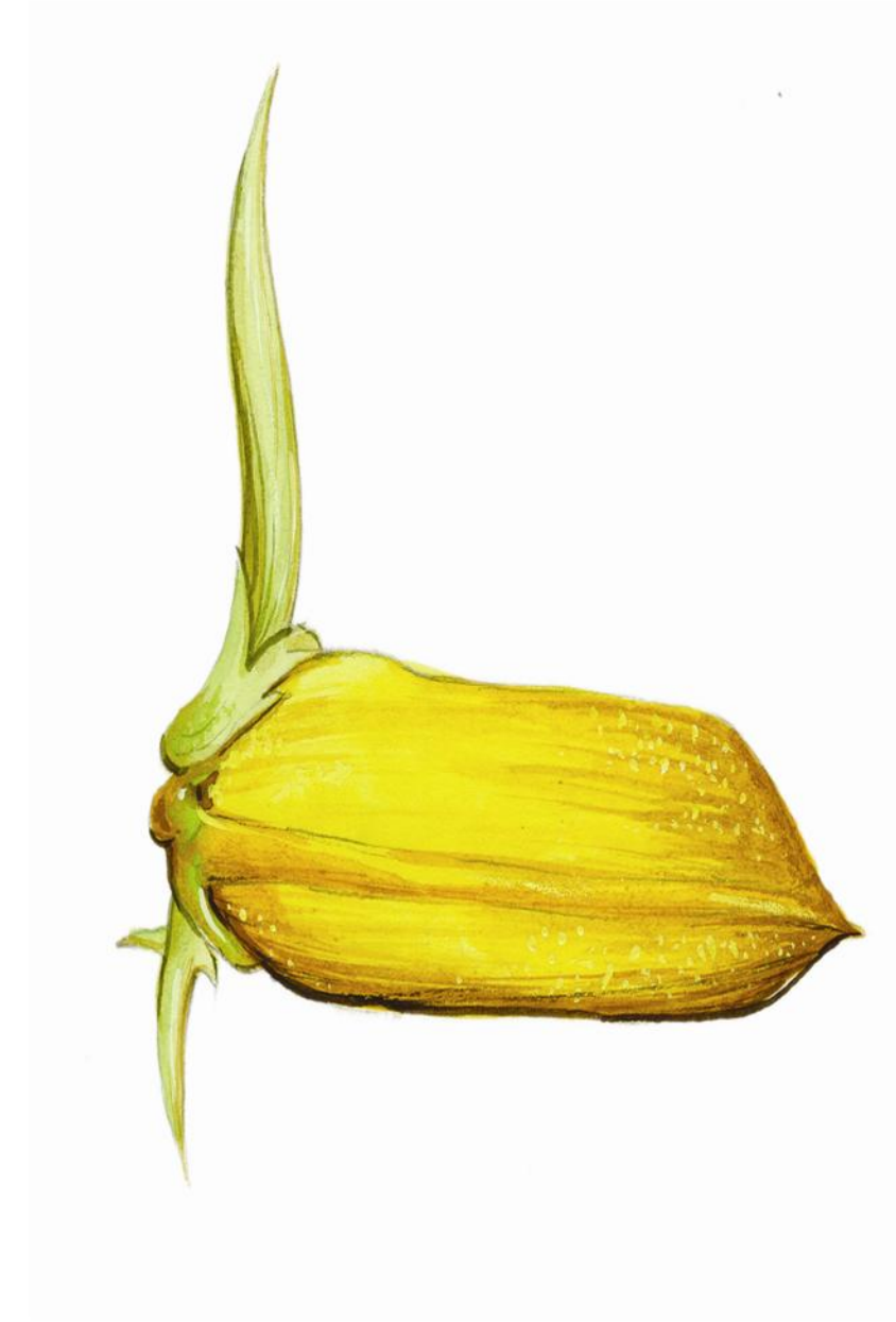
១- ដំណាក់កាលដុះពន្លក