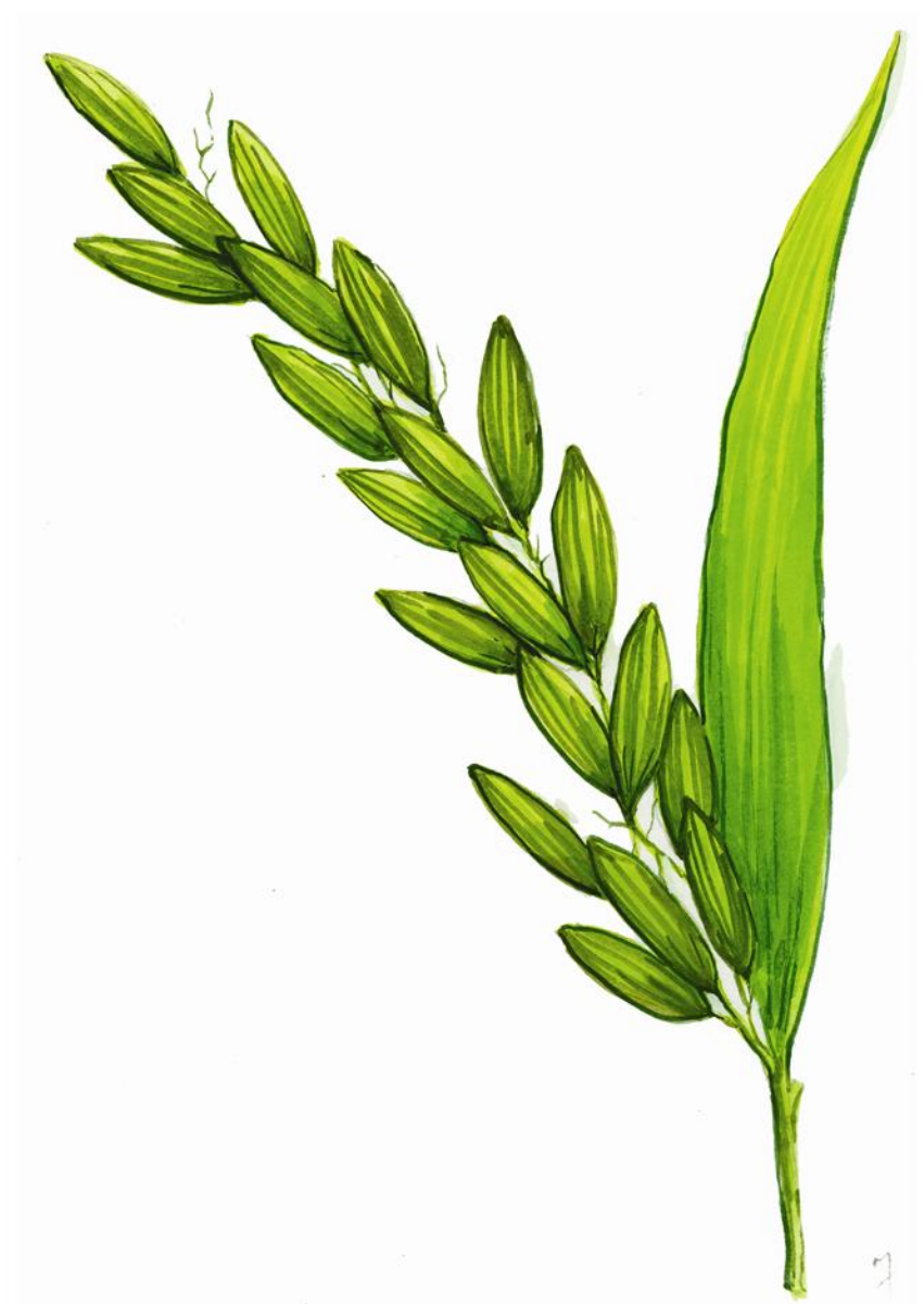
៨-ដំណាក់កាលដាក់ទឹកដោះ