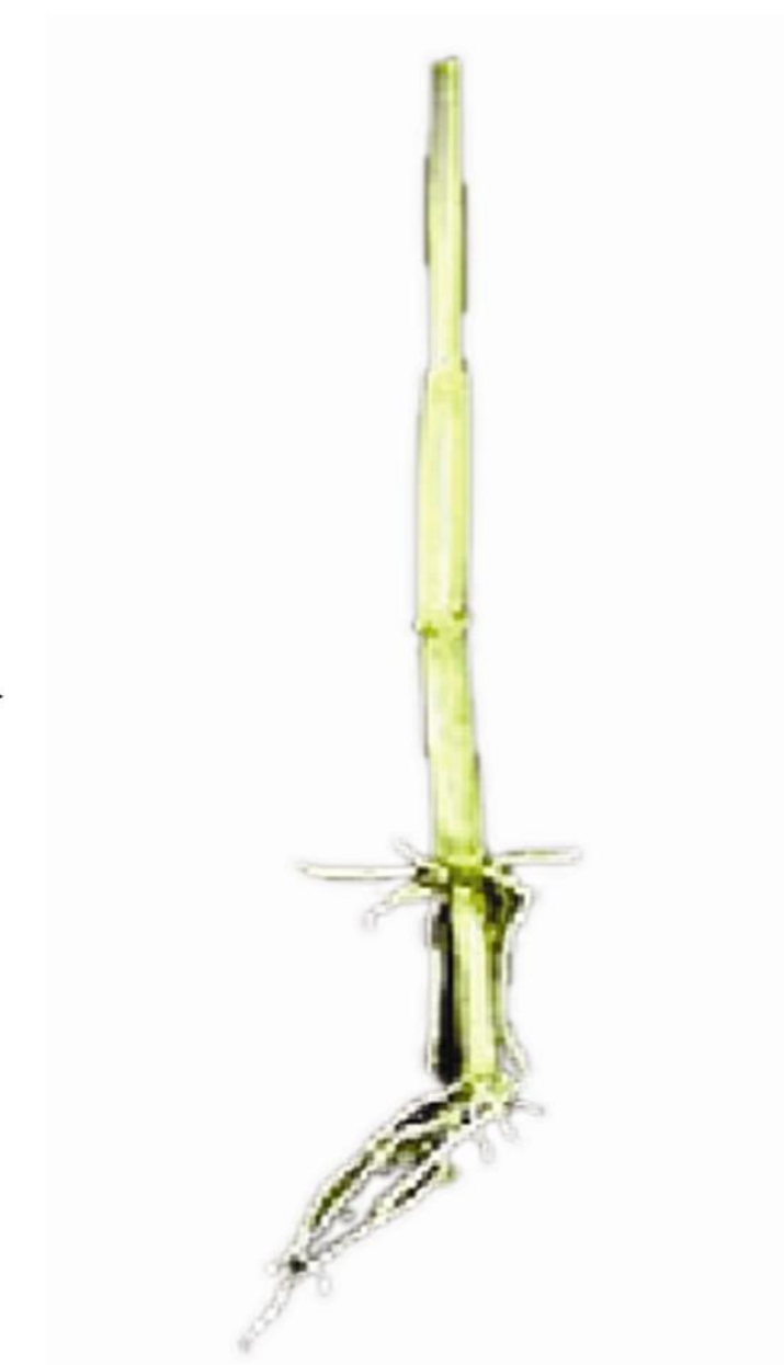
៤- ដំណាក់កាលពន្លតដើម