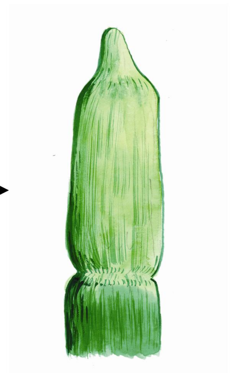
៥- ដំណាក់កាលកកើតកូន