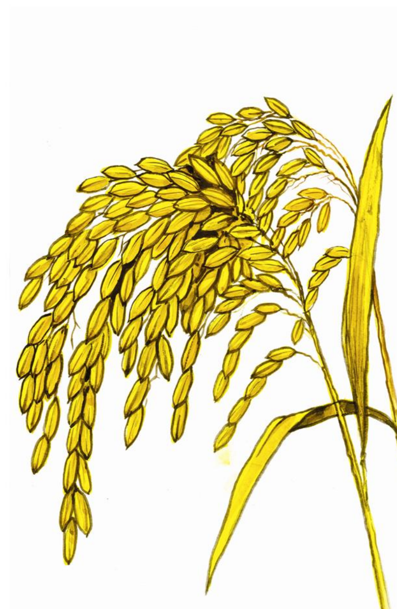
១០-ដំណាក់កាលទុំ