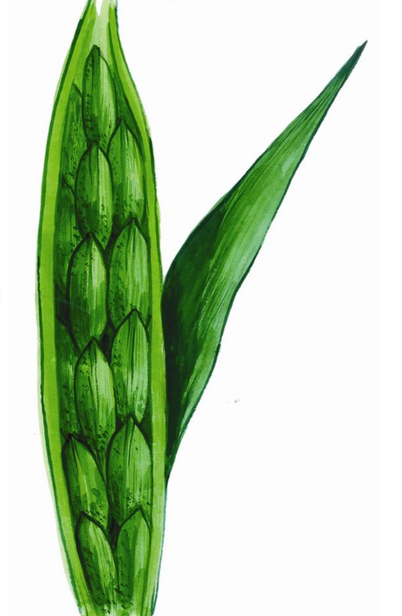
៦- ដំណាក់កាលដើម