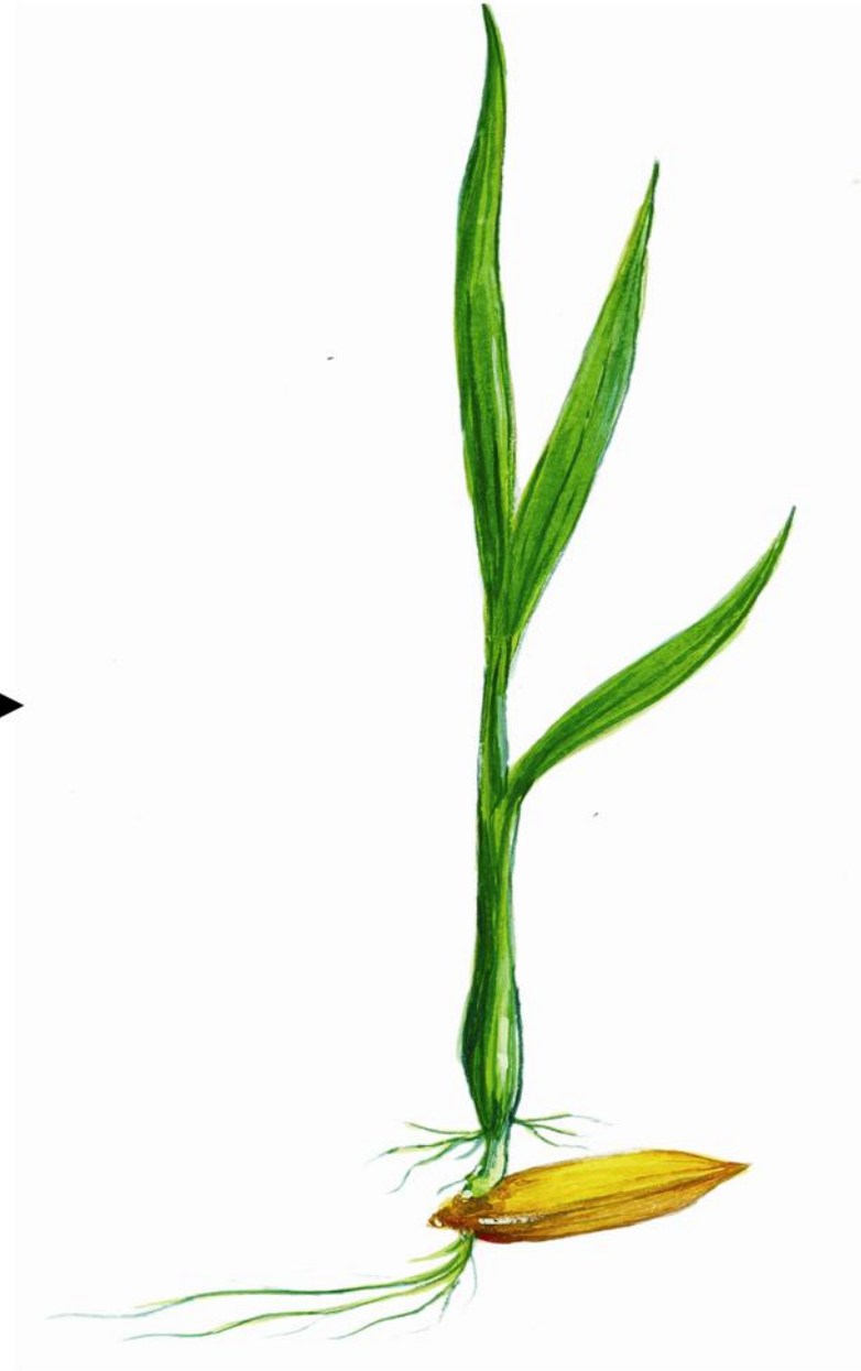
២- ដំណាក់កាលសំណាប់