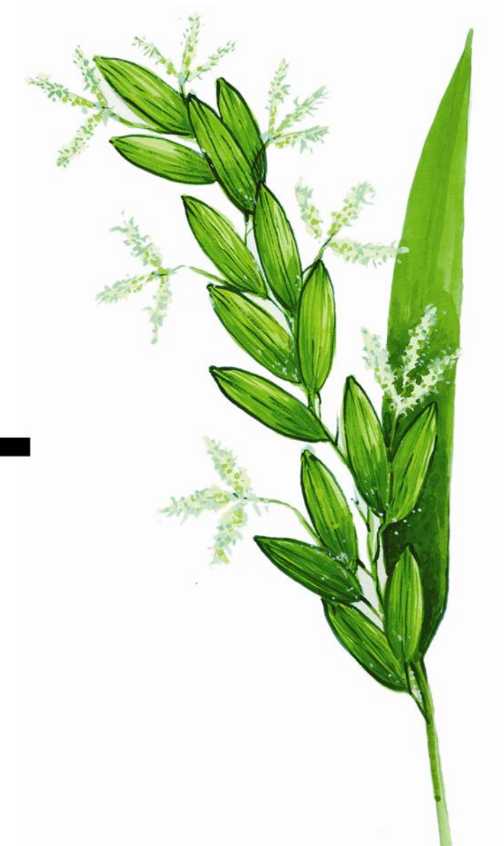
៧-ដំណាក់កាល ចេញកូន ចេញផ្កា