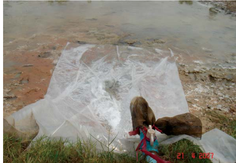
ស្រះបញ្ចូលទឹកដោយប្រើតម្រង និងទ្រនាប់