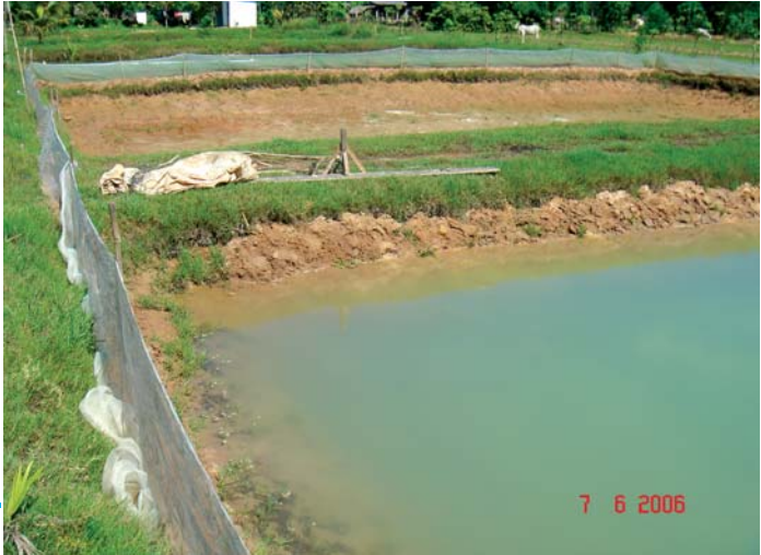
ស្រះបំប៉នកូនត្រីរៀបចំហើយ និងមានសំណាញ់ព័ទ្ធជុំវិញ