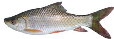
ត្រីកាបឥណ្ឌា (រ៉ូហ្វី)