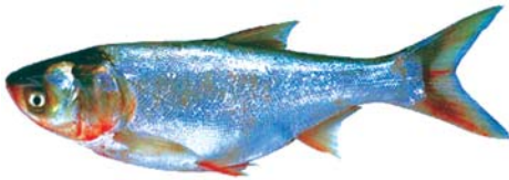
ត្រីកាបស