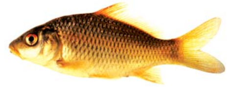
ត្រីកាបសាមញ្ញ