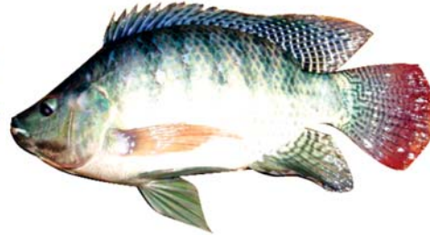
ត្រីទីឡាព្យ៉ា