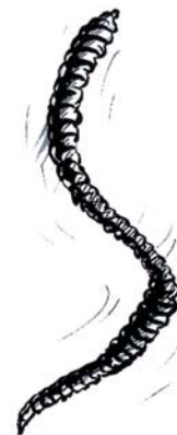
រូបភាពសត្វល្អិត បំផ្លាញកូនត្រី