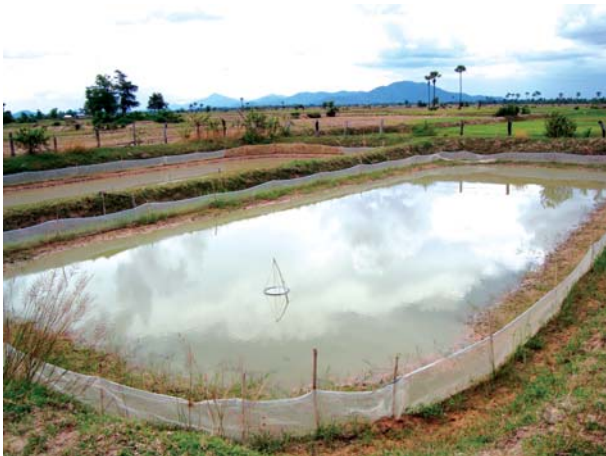
ស្រះថែបំប៉នកូនត្រីមានសំណាញ់ព័ទ្ធជុំវិញ