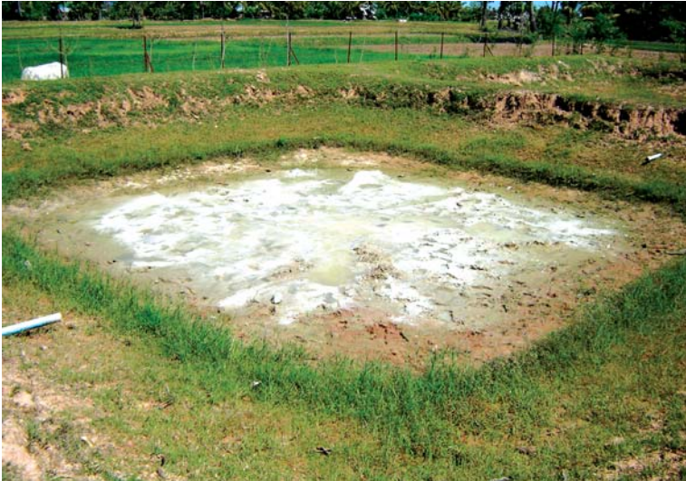
ស្រះបាចកំបោរហើយ