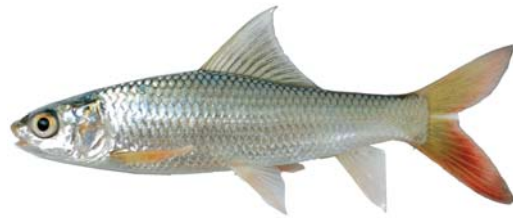
ត្រីកាបឥណ្ឌា (ម្រីហ្គាល់)