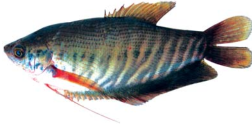
ត្រីកន្ទរ